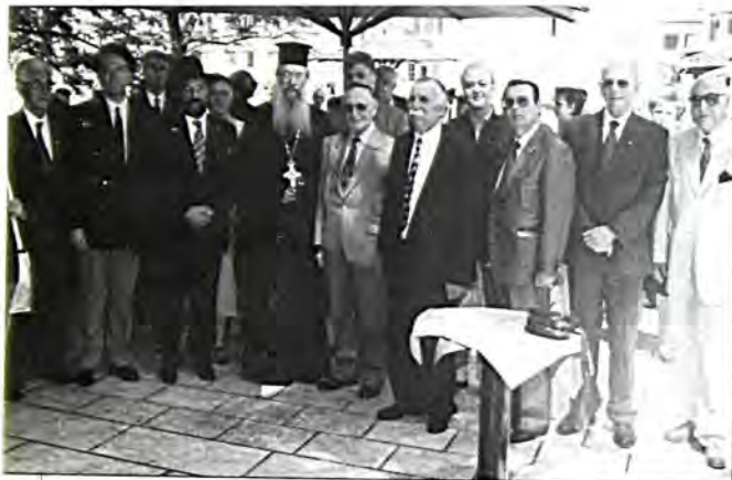
Από την τελετή αποκαλυπτηρίων της αναμνηστικής πλάκας. Στο κέντρο διακρίνονται ο εκπρόσωπος του Μητροπολίτη Δράμας και ο Ραββίνος Θεσσαλονίκης μεταξύ εκπροσώπων των τοπικών Αρχών και εβραϊκών οργανισμών.