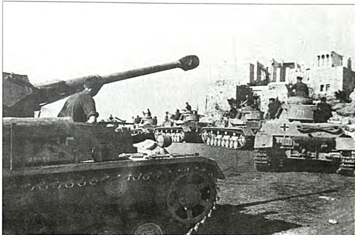
Γερμανικά τανκς σταθμευμένα κάτω από την Ακρόπολη, Απρίλιος 1941 (Από το βιβλίο του M.Mazower "Στη Ελλάδα του Χίτλερ").

δράσει ελεύθερα γιατί η Ιταλική κυριαρχία την εμποδίζει, οι Γερμανοί δεν άφησαν καμία ευκαιρία όποτε μπορούσαν να ενοχλούν τους Εβραίους.