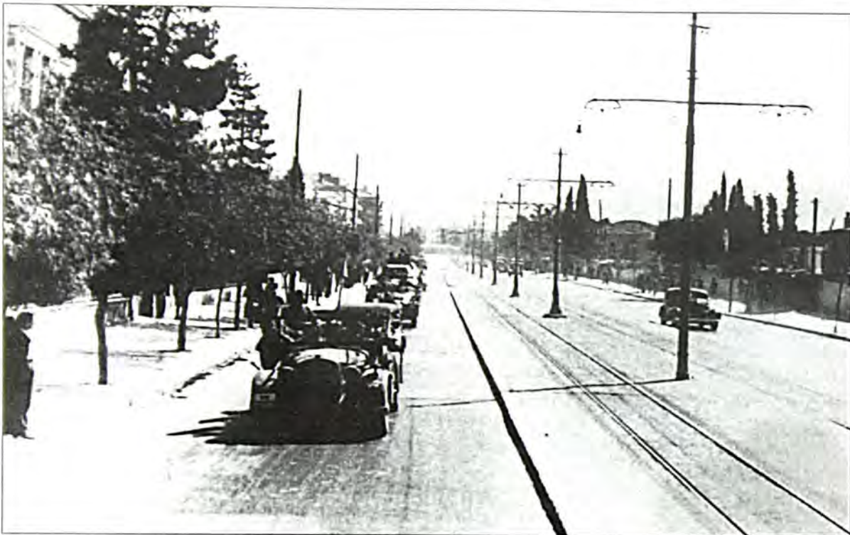
Οι πρώτες Γερμανικές δυνάμεις μπαίνουν στην Αθήνα, 27 Απριλίου 1941. (Από το διθλίο του Μ. Mazower "Στην Ελλάδα του Χίτλερ").

έτσι ώστε ούτε οι Γερμανοί ούτε οι Έλληνες γείτονες να μην ξέρουν που είναι. Σ' αυτούς που δεν ήρθαν τηλεφώνησα και τους είπα μεταφορικά (για να μην καταλάβουν οι Γερμανοί) ότι "ο άρρωστος είναι πολύ βαριά και οι γιατροί προτείνουν να φύγει από την πόλη και να πάει στα βουνά".