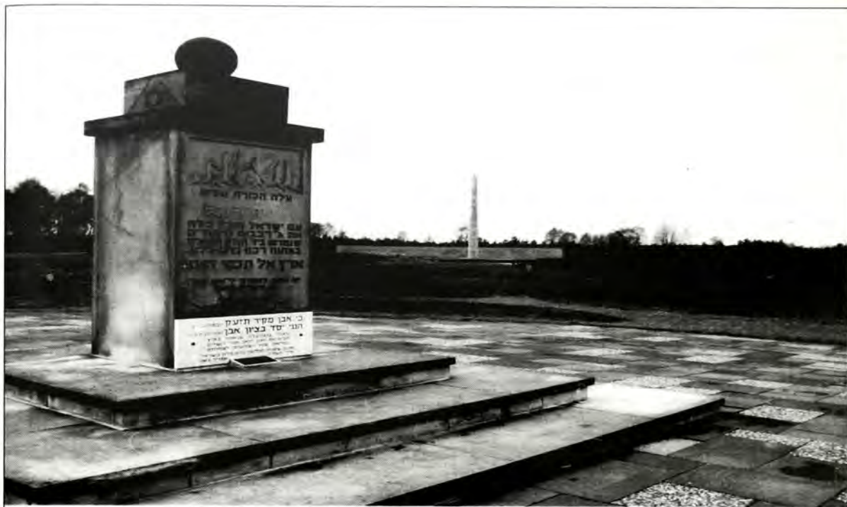
Μνημείο θυμάτων στο χώρο του στρατοπέδου συγκέντρωσης Bergen - Belsen.