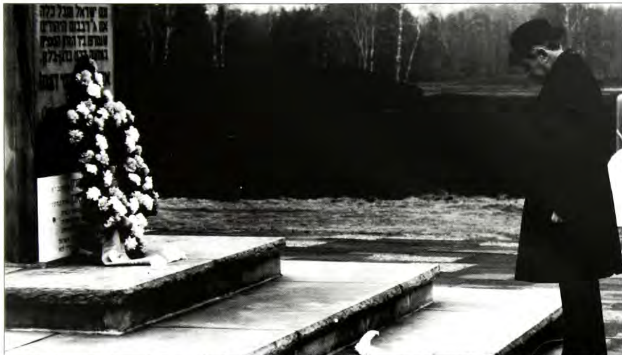
Ο κ. Χαΐμ Χέρτζοκ, Πρόεδρος του Κράτους του Ισραήλ κατά την κατάθεση στεφάνου στο μνημείο του στρατοπέδου συγκεντρώσεως Bergen - Belsen στα πλαίσια της επίσημης επίσκεψής του στην Ομοσπονδιακή Δημοκρατία της Γερμανίας τον Απρίλιο 1987.