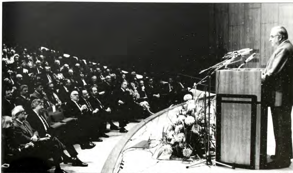
Από την ομιλία του Καγκελάριου κ. Χέλμουτ Κολ σε παγκόσμιο συνέδριο ιστορικών που έγινε με την αιγίδα του Ινστιτούτου Leo Baeck της Νέας Υόρκης, στην Κρατική Βιβλιοθήκη του Βερολίνου, στις 28 Οκτωβρίου 1985.