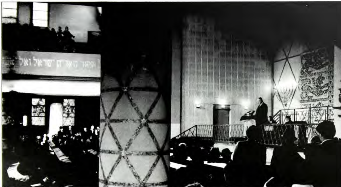
Ο κ. Χέλμουτ Κολ κατά την ομιλία στη Δυτική Συναγωγή της Φρανκφούρτης