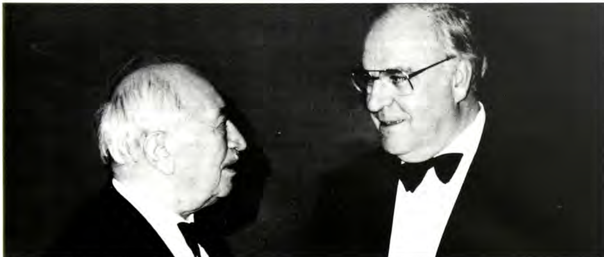
Ο Καγκελάριος Κολ συζητώντας με τον κ. Σίμον Βίξενταλ.