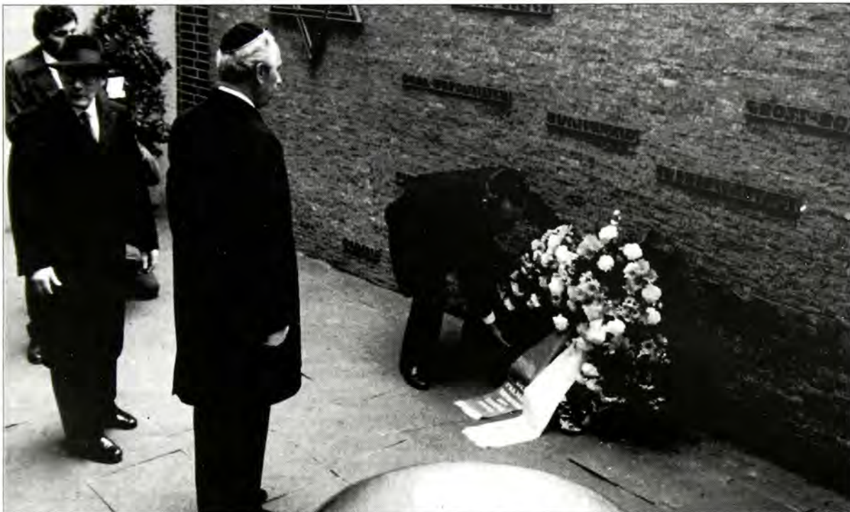
Από την κατάθεση στεφάνου στο Κέντρο της Εβραϊκής Κοινότητας του Δ.Βερολίνου, στις 29 Ιανουαρίου, 1986. Από αριστερά προς τα δεξιά: Helmut Gallinski, πρόεδρος της Ισραηλτικής Κοινότητας του Βερολίνου, Shimon Peres πρωθυπουργός του κράτους του Ισραήλ και οι Yitzhak Ben Ari, πρόεδρος του Ισραήλ στη Βόννη.