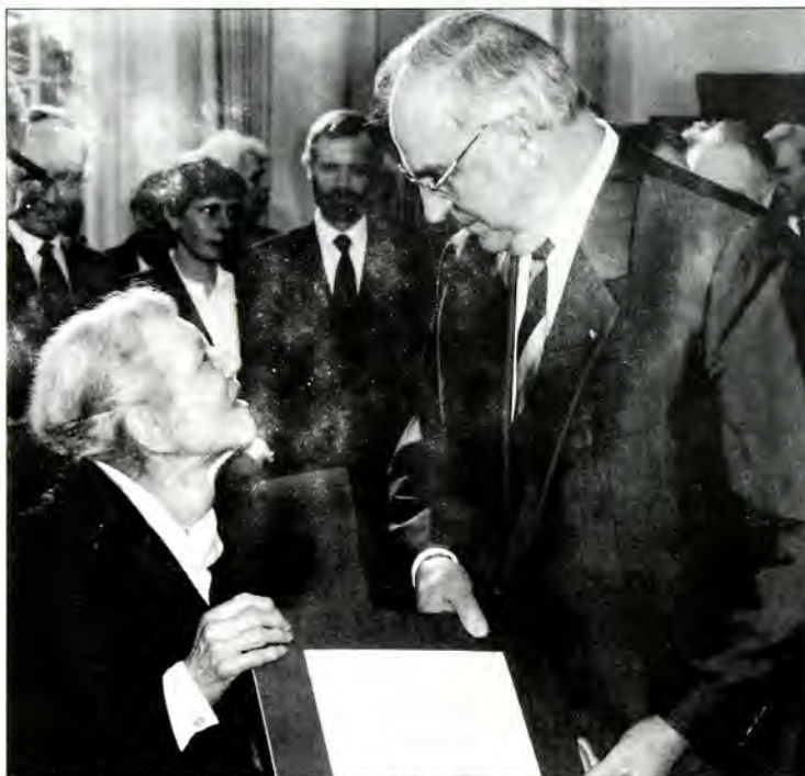
Η Δρ. Gertrud Luckner ενώ λαμβάνει το βραβείο Sir Sigmund Strenberg από το Καγκελάριο Κολ, στη Βόννη στις 16 Δεκεμβρίου 1987