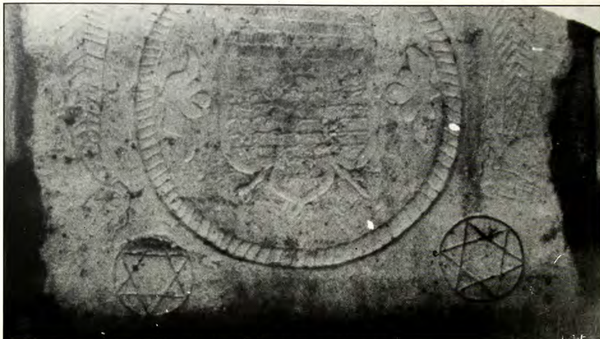
ΥΠΑΤΗ (1987): Εβραϊκά σύμβολα σε βυζαντινό μνημείο.