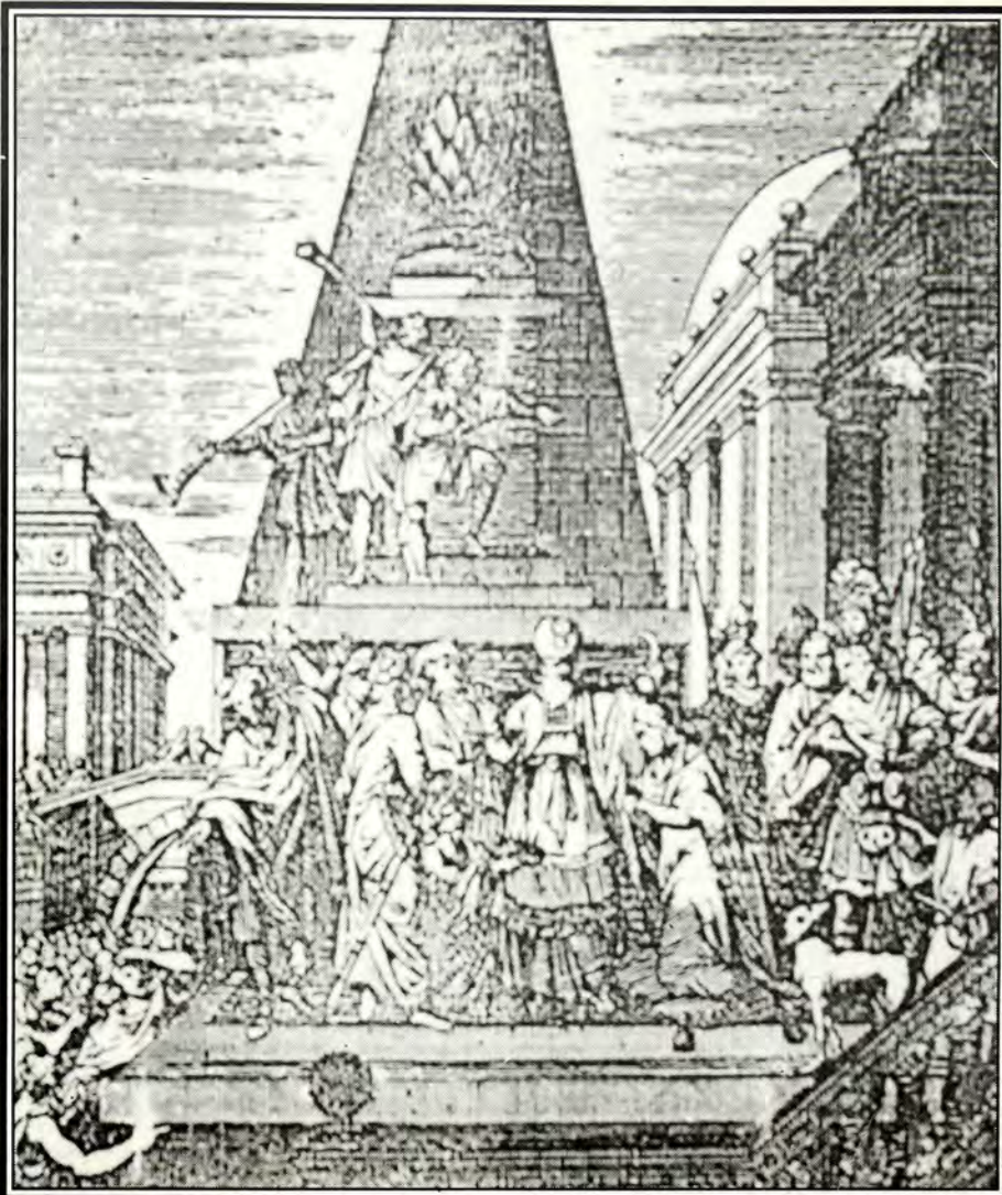
Απεικόνιση του ιδιορρυθμού (και "απειθαρχού") βασιλιά Σολομώντα, δημιουργού του "Ύμνου Αρμάτων"