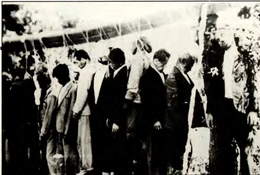
Οι εκτελεσθέντες πατριώτες