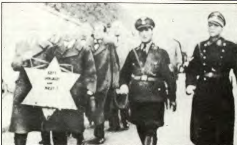
Η αρχή του δρόμου προς το Ολοκαύτωμα