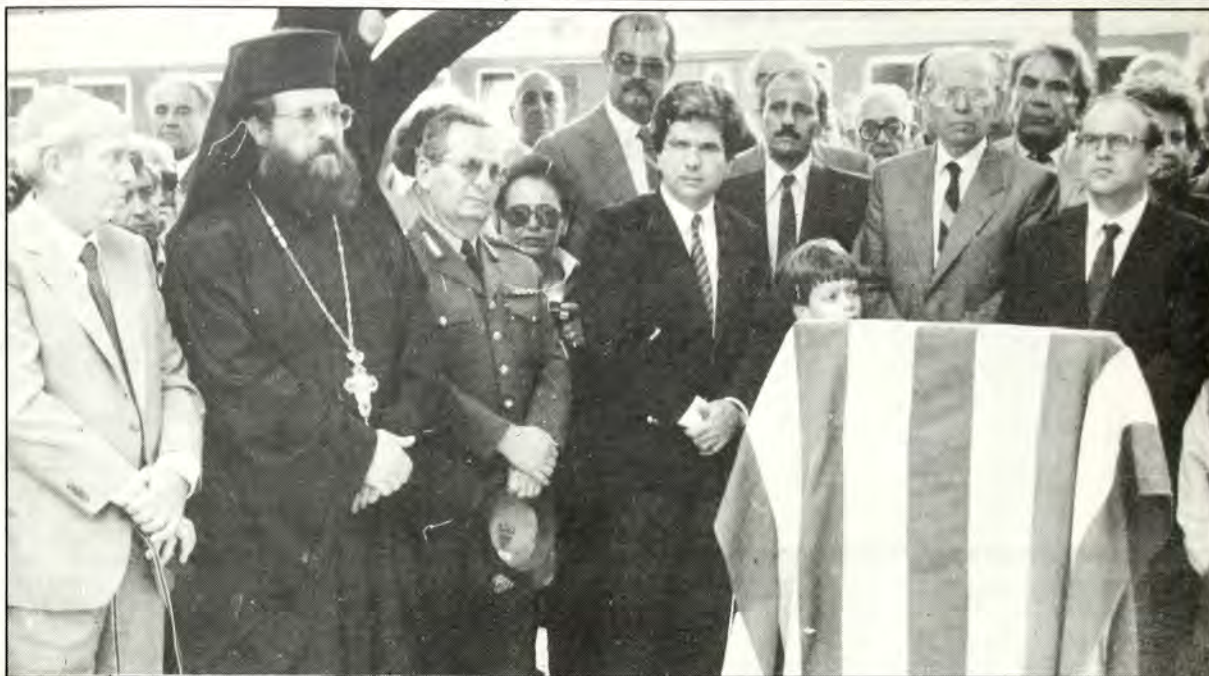
Από την τελετή στο Λιανοκλάδι