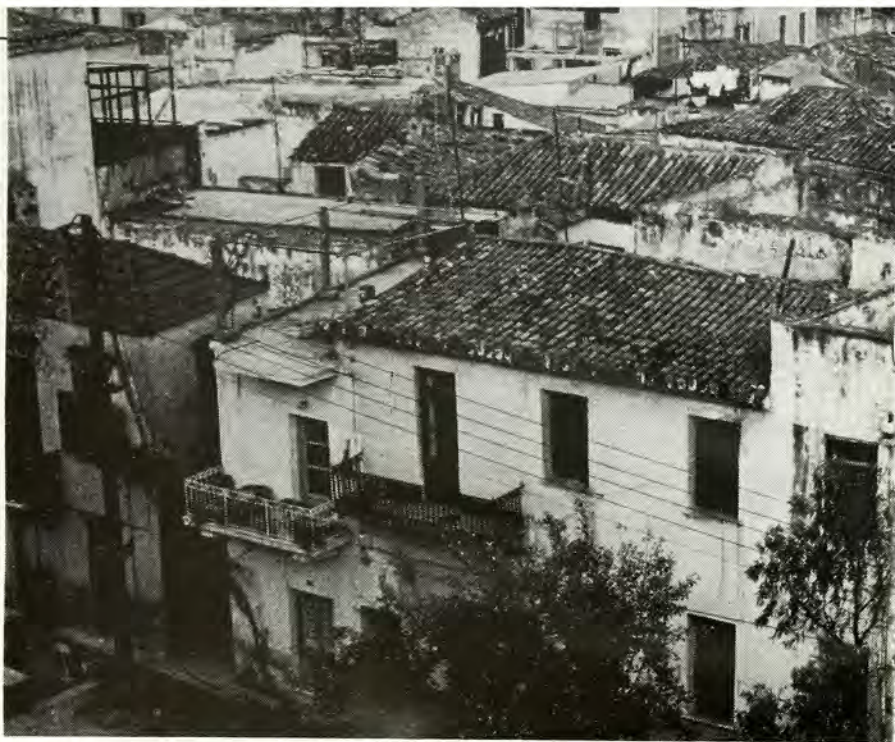
Οι φωτογραφίες του άρθρου είναι από την παλιά έβραϊκή συνοικία τών Χανίων.

'Η ζωή δέ αύτών έν Κρήτη, υπό τό καθεστώς της 'Ενετίας ήτο παρομοία πρός εκείνην τών κατά την έποχήν του μεσαίωνος έν Γαλλία κ.λ.π. διαβιούντων όμοεθνών των. Δηλαδή τό Κράτος συμπεριεφέρετο πρός αύ- τούς, περίπου όπως σέ κτήνη καί σέ δούλους. "Ετσι τούς επεβάλλετο, νά διαμένουν εις όρισμένα μέρη καί εις όρισμένες συνοικίες τών πόλεων, κα-