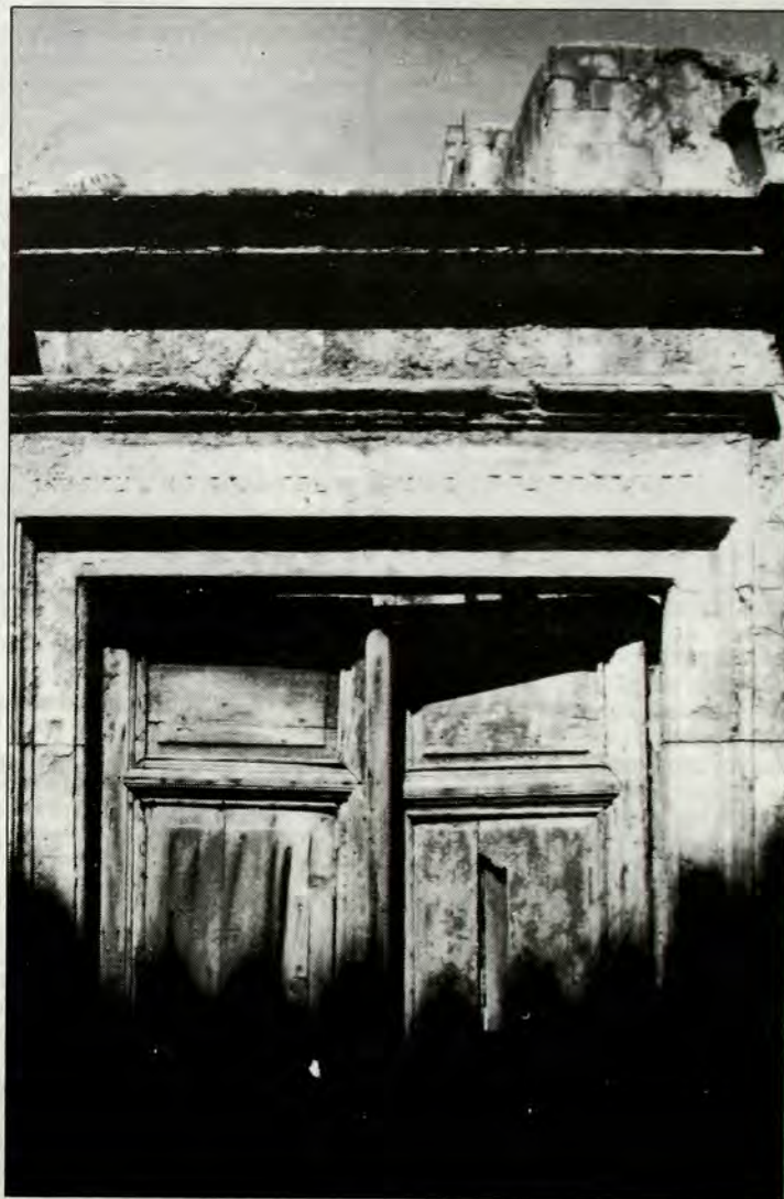
“Ό,τι άπομένει σήμερα από τή Συναγωγή Χανίων (ή είσοδος).

Η Συναγωγή Χανίων (κειμένη επί της όδου Κονδυλάκη 60) χρονολογείται από του έτους 1522 καί έχει πολύ ένδιαφέρον από ιστορικής άπόψεως. Είναι ισπανικού σφαραδικού τύπου, αλλά καί μέ χαρακτηριστικά βενετσιάνικα κρητικά (μέ τρούλο). Η Συναγωγή έχει παραδοσιακό χαρακτήρα. Είται τό μόνον μνημείο τό όποιον άπομένει από τόν Έβραϊσμό της Κρήτης.