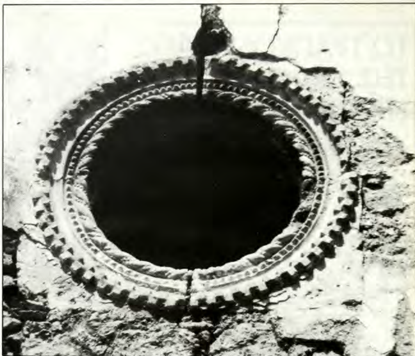
ΧΑΝΙΑ: Ἀπὸ τὴ Συναγωγή

Χριστέ μου καὶ νὰ γίνονταν ἡ γι' Ὁβρηκὴ λειβάδι