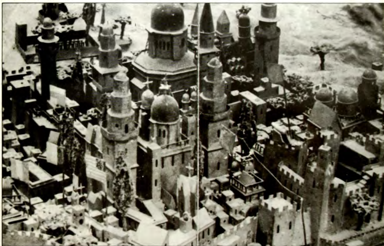
ΙΕΡΟΥΣΑΛΗΜ: Πανοραμική ὄψη τοῦ Ὄρους τῶν Ἐλαιῶν ἔξω ἀπό τήν Παλιά Πόλη, ἡ Κοιλὰδα τῶν Κέδρων, ἡ ρωσική θρησκευτική ἐγκατάσταση καί ὁ ἀνεμόμυλος τῆς Montefiore. (Φωτογραφία ἀπό τό Ἰσραηλινό περιοδικό «Ariel»).

(Εἰρήνηση πού ἐγίνε στό Πνευματικό Κέντρο Ἀθηνῶν, στίς 17 Φεβρουαρίου 1988 μέ θέμα τόν τίτλο τοῦ ἄρθρου).