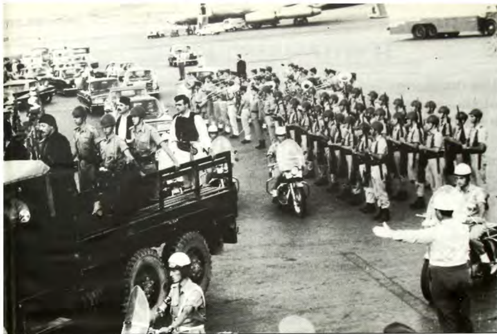
Μεταφορά των οστών και της τέφρας με τελετική πομπή από το γερμανικό στρατόπεδο στο αεροδρόμιο του Έλληνικού και εκείθεν στο Κοιμητήριο Αθηνών. Την τέφρα συνοδεύει τιμητικό απόσπασμα των ενόπλων δυνάμεων και της ανακτορικής (τότε) φρουράς.