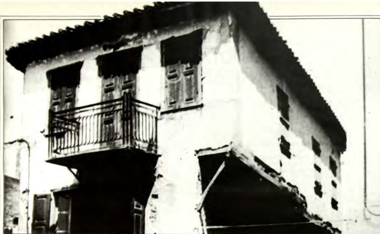
ΧΑΛΚΙΔΑ: Παλαιά εβραϊκή οικία. (Φωτογραφία Μ. Κοέν).

Μετά την άπελευθέρωσιν τῆς Ἑλλάδος κατὰ τὸ 1830 ἡ Ἰσραηλιτικὴ κοινότης Χαλκίδος ἦτο λίαν πολυάνθρωπος ὥς προσφυγόντων κατὰ τὴν ἐπανάστασιν εἰς Χαλκίδα πολλῶν οἰκογενειῶν ἐκ Θηβῶν, Λεβαδείας καὶ ἀλλαχόθεν (ἴδε καὶ οἰκογένειαν Σιμαντοῦ Σακῆ ἢ Μιστριώτου καταγομένων ὥς μοί ἔλεγεν ἐκ Μιστρᾶ) ἐνθα ἤκμαζον Ἰσραηλιτικαὶ κοινότητες πρό τῆς Ἐπαναστάσεως Ἑλληνικῶταται ἐκ τῶν ὁποίων προσφύγων οἰκογενειῶν πολλαὶ ὡς Χαλκιδαικαὶ ἀπόκισαν μετὰ τὴν ἐπανάστασιν εἰς Μ. Ἀσίαν, Θεσσαλονίκην, Κωνσταντινούπολιν καὶ ἀλλαχοῦ διατηρήσασαι ὅμως μέχρι σήμερον τὴν πατροπαράδοτον γλῶσσαν τῶν (Ἑλληνικὴν) τὰ ἦθη καὶ τὰ ἔθιμά τιν μὴ ἀφομειωθεῖσαι ὑπὸ πατριωτικῆν ἐποψιν πρὸς τοὺς ὁμοφύλους τῶν Ἰσπανιόλους καὶ ὑπερφηανεύονται νὰ ὀνομάζωνται "Ἕλληνες διατηροῦσι μέχρι σήμερον τὴν Ἑλληνικὴν ἰθαγένειαν καίτοι ἀπὸ αἰῶνος σχεδὸν ἀπεδήμησαν τῆς Χαλκίδος.