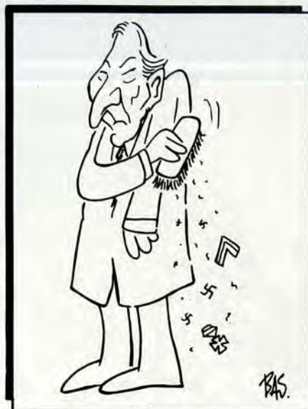
Του ΒΑΣ από τον «Ταχυδρόμο»

Ο ταν πρίν από δύο χρόνια οί 'Εβραϊκές οργανώσεις όλου του κόσμου κατηγορήσαν άνενδοίαστα τόν Κούρτ Βαλντχάιμ ως «κοινό ψεύτη», ό όποιος παραποιούσε τήν πραγματικότητα όσον άφορά τήν άτομική δράση του στην περίοδο του Β' Παγκοσμίου Πολέμου, ή άνθρωπότητα στάθηκε έκστατική. Οί πιό καλοπροαίρετοι έθεταν έρωτηματικά πώς ήταν δυνατόν ό επί σειρά έτών τιμημένος Γενικός Γραμματέας του ΟΗΕ νά είναι ένας διακεκριμένος Ναζί. Οί ίδιοι οί Αύστριακοί άδυνατούσαν νά πιστέψουν αυτή τήν κακοήθεια έκ μέρους του Βαλντχάιμ καί τήν άδυναμία τους αυτή τήν πιστοποίησαν μέ τήν ψηφο τους μέ τήν όποία τόν εξέλεξαν Πρόεδρο της χώρας τους. Οί κακόπιστοι άντισημίτες