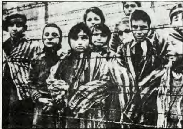
Παιδιά στό 'Αουσβιτς.

Μäs πήραν κι εμäs τὰ κλάμματα, βλέποντας τό φίλο μäs να κλαίει, χωρίς να καταλαβαίνουμε τί νόημα εἶχαν τὰ λόγια του. Ρωτήσαμε τίς μανάδες μäs κι εκείνες μäs εξήγησαν, ὅσο μπορούσαν, γιατί δέν θά ξανατρώγαμε