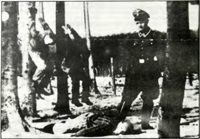
Η ανθρώπινη ζωή δεν είχε καμία σημασία.

Μέσα σ' αυτούς τούς «θαλάμους αερίων» στριμώχνανε άσφυκτικά τά τραγικά θύματά τους όλόγυμνα — έρρους, παιδιά, γυναίκες — σφαλοῦσαν την πόρτα κι άφηναν τό θανατη-