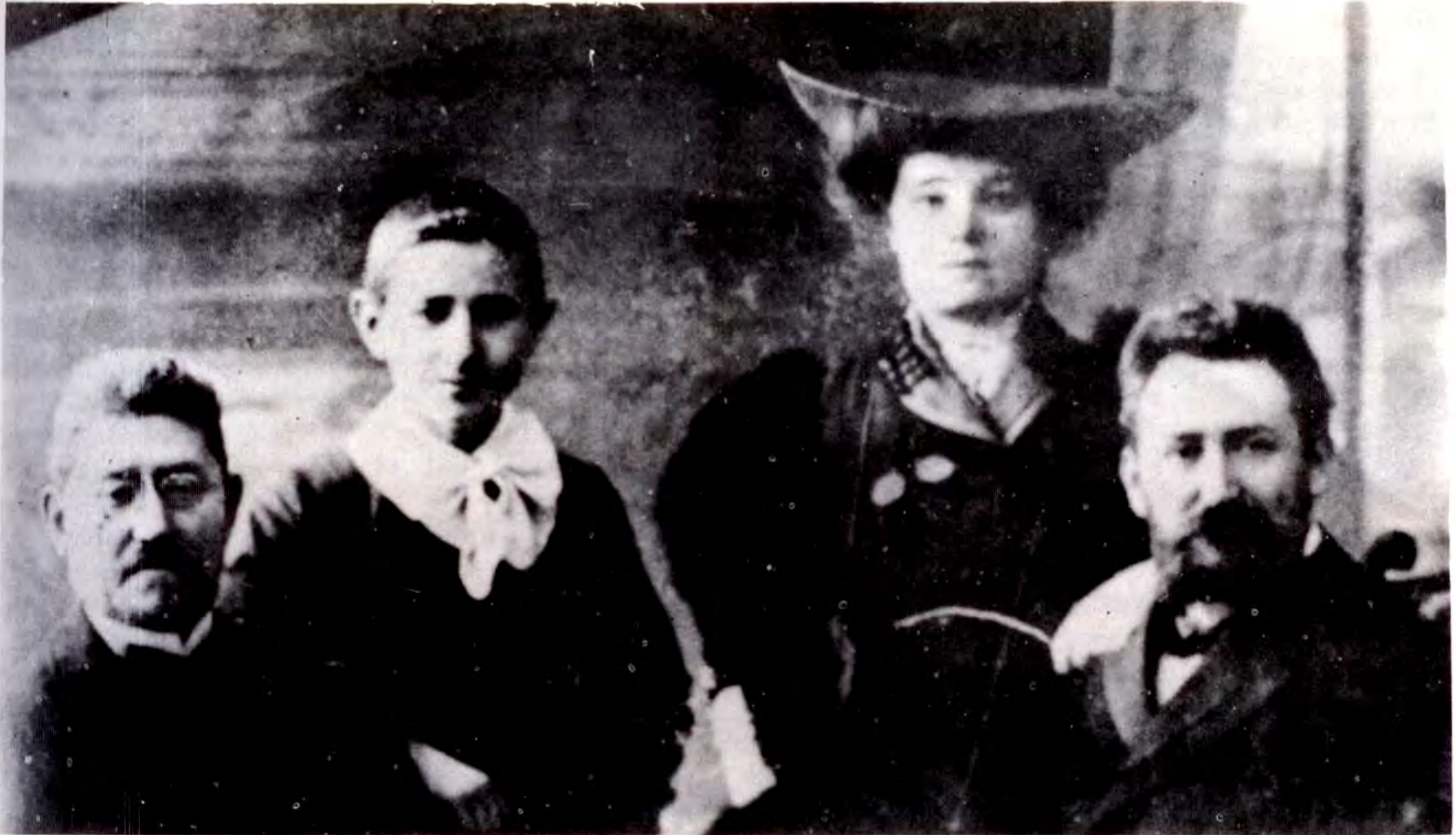
1908: Αναμνηστική φωτογραφία από τό Μπάρ – Μιτσβά του

έξωτερικό καί τό έσωτερικό. Τό έσωτερικό μέτωπο δημιουργεί τά ίδανικά, τίς πνευματικές φιλοδοξίες, ένώ τό έξωτερικό προσφέρει τά μέσα γιά τή δημιουργία τής πραγματικότητας καί τήν έφαρμογή τών ίδανικών. Θά προσπαθήσω νά αναλύσω, περιληπτικά, αὐτά τά δύο μέτωπα τής σημερινής Έβραϊκής κατάστασης.