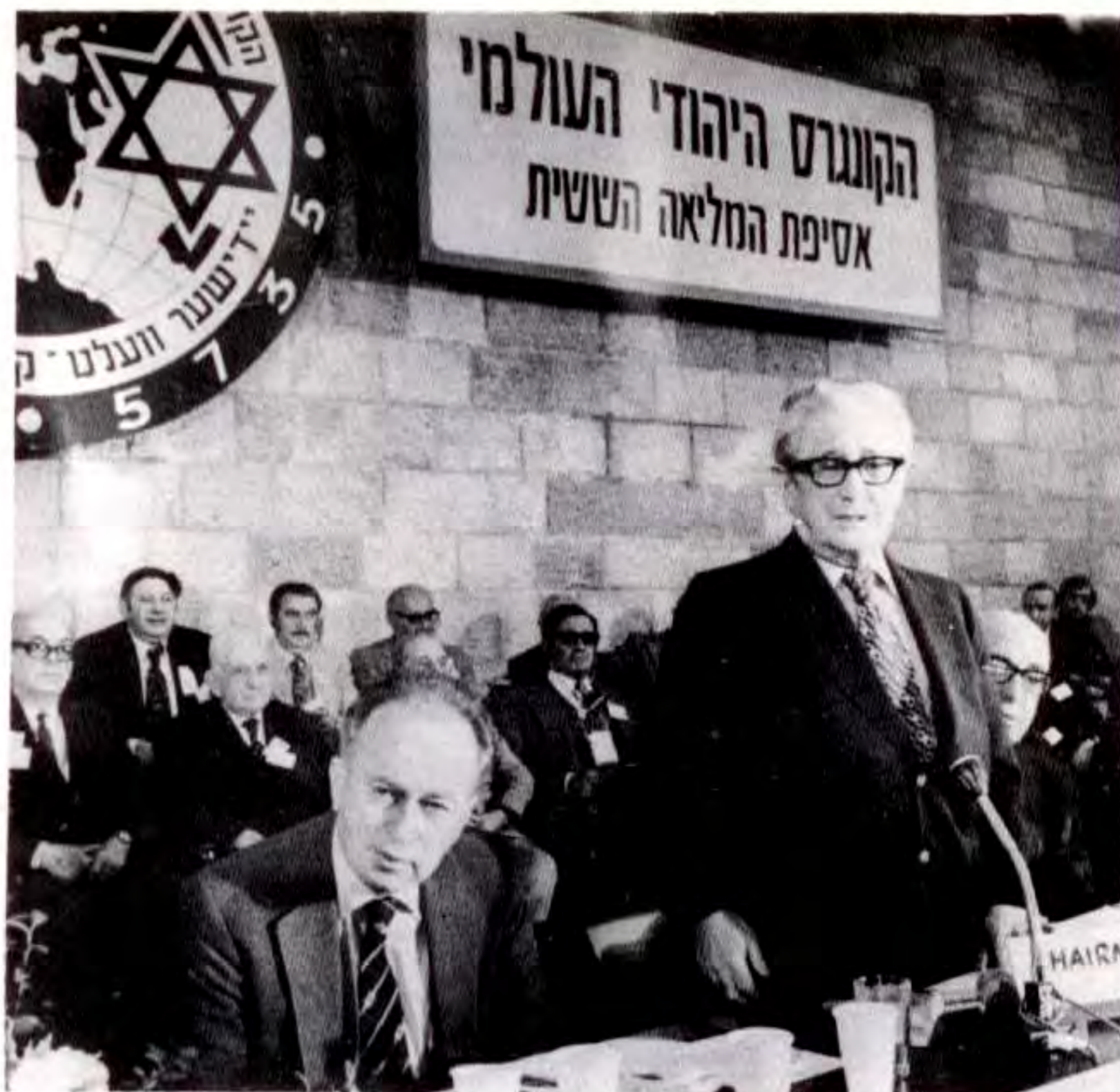
Προσφώνηση τοῦ Γκόλντμαν στή Σύνοδο τοῦ 1975 στήν ‘Ιερουσαλήμ.

Τό Π.Ε.Σ. σήμερα ἐκπροσωπεῖ ἑκατομμύρια ‘Εβραίων, μέσω τῶν ‘Εβραϊκῶν κοινοτήτων καί ὀργα- νισμῶν σέ 60 χῶρες τοῦ κόσμου, καί - μέ ἐξαιρεση