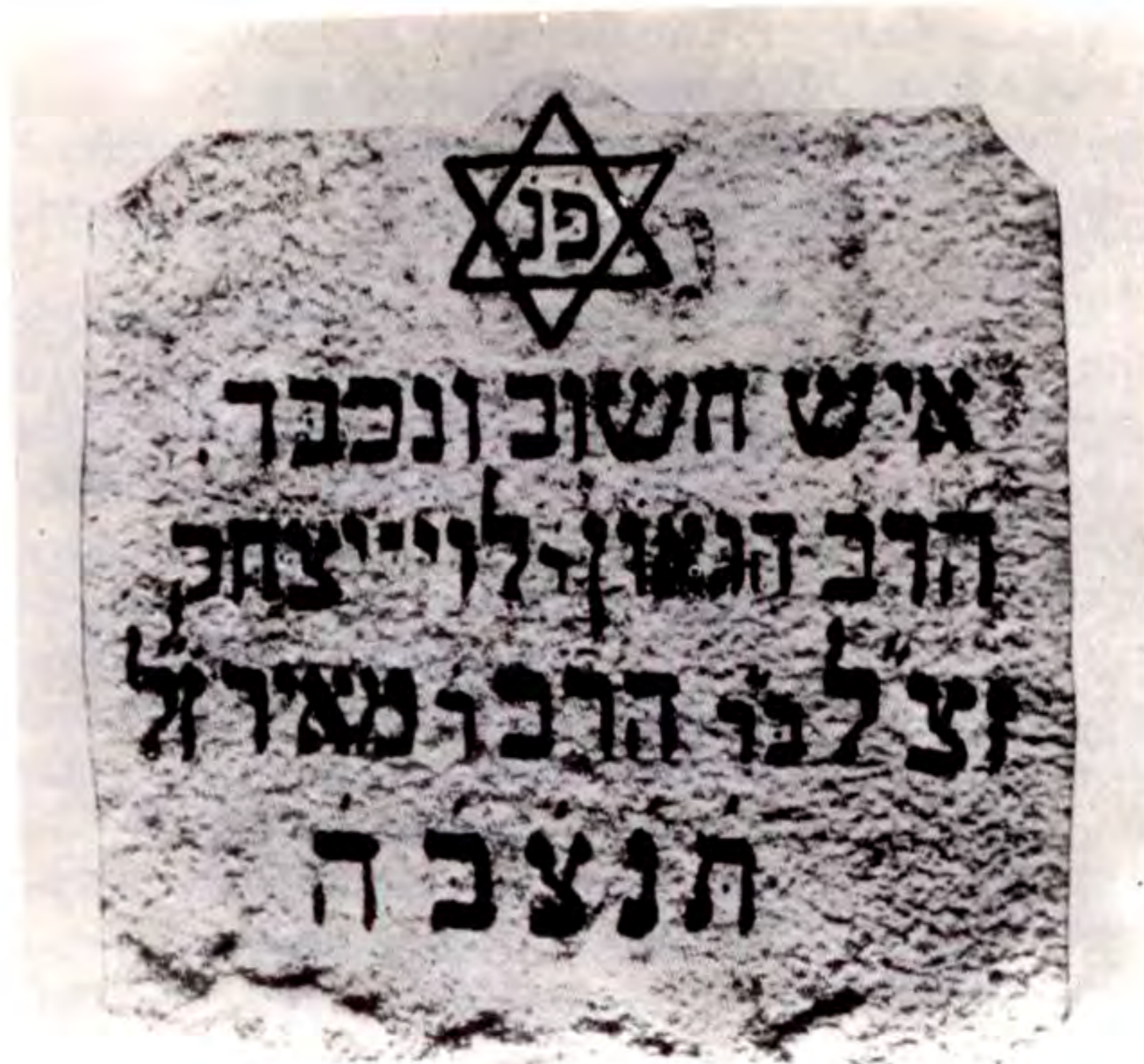
Ἡ ταφόπετρα τοῦ Ραββίνου Levi Isaac ben Meir ἀπὸ τό Μπερντίσεβ.

Ἡ Ἑβραϊκή λαογραφία ἀσχολεῖται μέ τόν οὐρανὸν καί τή γῆ, τόν Παράδεισο καί τόν Ἄδη, τό καλὸ καί τό κακὸ, τό φυσικὸ καί τό ὑπερφυσικὸ, τό πνευματικὸ καί τό ὑλιστικὸ, τό ἱερό καί τό ἀκάθαρτο. Μέσα ἀπὸ ἀναρίθμητους θρύλους περνᾶνε οἱ Πατριάρχες καί οἱ