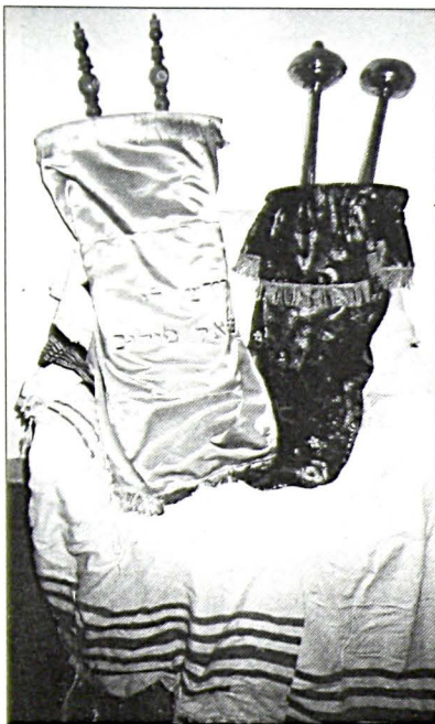
Σέφερ Τορά από τη Συναγωγή της Καβάλας.