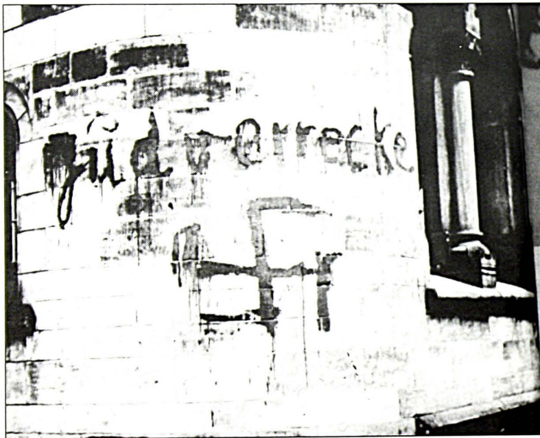
Αντιεβραϊκά σκηνήματα στη Συναγωγή του Ντίσελντορφ το 1933.

στην Ευρώπη, οι Άραβες έχουν συχνά επιτεθεί σε Εβραϊκούς, αντί για Ισραηλινούς στόχους. Η συμπαράσταση της άκρας αριστεράς σε ορισμένους από αυτούς είναι καλά στοιχειοθετημένη, και είναι γνωστοί οι επιχειρησιακοί δεσμοί μεταξύ του Λαϊκού Μετώπου για την Απελευθέρωση της Παλαιστίνης (PFLP) και της αριστεράς, καθώς και της ομάδας του