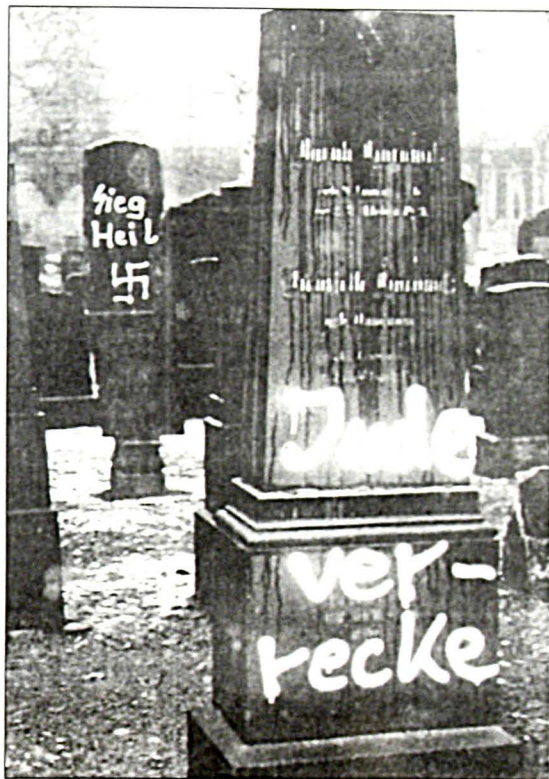
Βανδαλισμοί νεκροταφίων, Γερμανία 1993.

Δεν είναι σκοπός αυτού του άρθρου να αναλύσει την άκρα Δεξιά και το πώς αυτή λειτουργεί, αξίζει όμως να σημειώσουμε ότι η πτέρυγα αυτή, έχει αυξηθεί σε μέγεθος και κλίμακα δραστηριοτήτων σε ολόκληρη την Ευρώπη. Εν τούτοις, το πιο σημαντικό είναι το γεγονός ότι ο ρατσισμός εγκαταλείπει τις στενές εθνικιστικές του ρίζες, υπέρ μιας πίστης σ' ένα κίνημα παν-Αρίων.