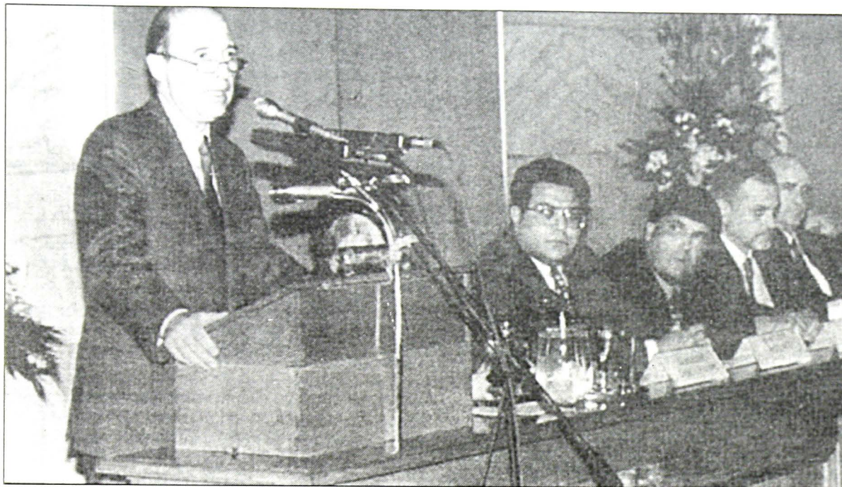
Από την ομιλία του πρωθυπουργού κ. Κων. Σημίτη στην επίσημη τελετή έναρξης του Έτους κατά τον Ρατσισμό που έγινε στην Αθήνα, στο Μέγαρο της Παλαιάς Βουλής, στις 26.2.97. Όπως τόνισε ο πρωθυπουργός: «Εμείς οι Έλληνες ξέρουμε καλά τι σημαίνει προσφυγιά και αντισημιτισμός»

να υπερβούν το εμπόδιο του Ολοκαυτώματος. Η δολοφονία εκατομμυρίων αθώων, άμαχων ανθρώπων για ιδεολογικούς σκοπούς, θα αποτελέσει πάντα εμπόδιο σε οποιαδήποτε εκλογική υποστήριξη αναζητούν οι Ναζί. Δεν μπορούν να το υπερβούν, άρα το αρνούνται.