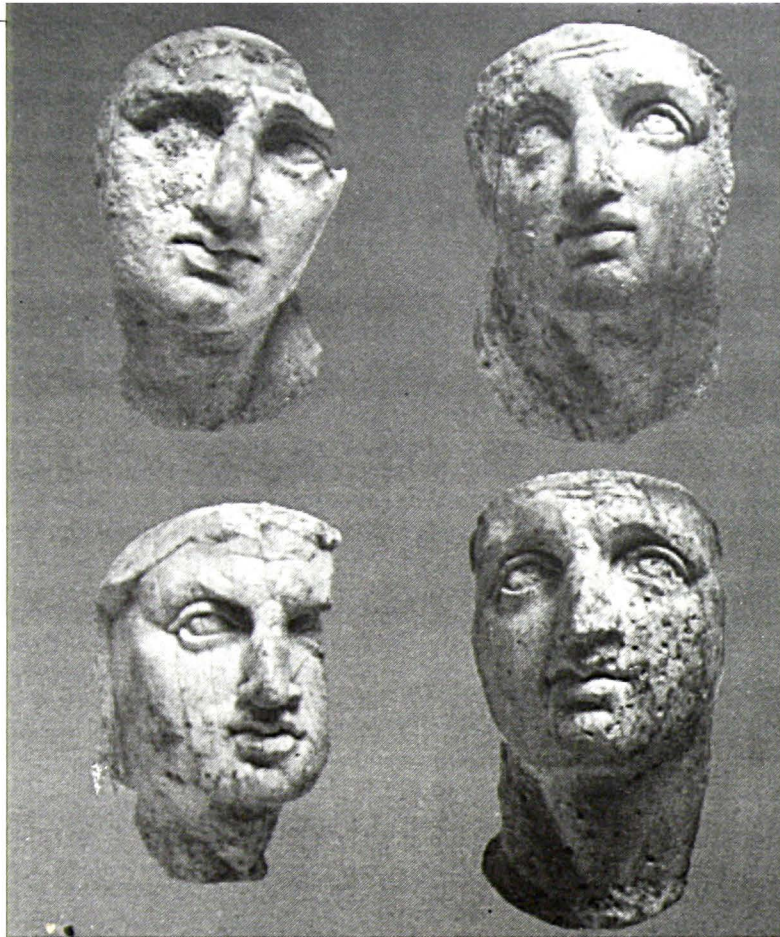
Ελεφαντοστέινα κεφάλια που διακοσμούσαν τη κλίνη του τάφου της Βεργίνης ανήκουν στον Αλέξανδρο, την Ολυμπιάδα και το Φίλιππο

Αντίοχου Γ'. Το Συνέδριον είχε δικαστική και διοικητική εξουσία, διευθύνον τα της Ιουδαϊκής κοινότητας. Η εβραϊκή γλώσσα εξακολουούθησε να είναι η τελετουργική γλώσσα του ναού και των Συναγωγών. Οι Ιουδαίοι αντικατέστησαν την αρχαία εβραϊκή γλώσσα με την τετράγωνο Αραμιαϊκή, πιθανώς από τον 4ο π.Χ. αιώνα.