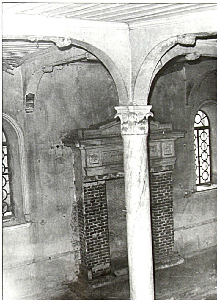
Το Ιερό (Εσχό) της παλαιάς Συναγωγής της Καβάλας που καταστράφηκε από τους Βούλγαρους.