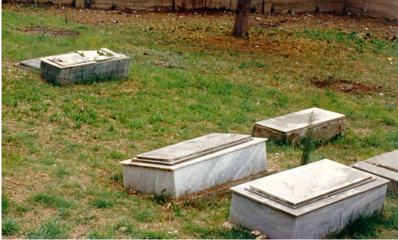
ΤΑ ΕΒΡΑΪΚΑ ΝΕΚΡΟΤΑΦΕΙΑ

Οι Εβραίοι της Πάτρας ζούσαν στο βορειοδυτικό μέρος του Κάστρου, στις περιοχές Βλατερού, Αγιαλεξιώτισσας και, κατά την περίοδο της Φραγκοκρατίας, στην Αρόη, που αργότερα ονόμαζαν «Τσιφούτ Μαχαλά», γνωστή και ως «Εβραιομαχαλάς». Κοντά στην Εβραϊκή συνοικία υπήρχε το παλιό νεκροταφείο με το τοπωνύμιο «εβραιομνήματα» (φωτογραφία επάνω), τοπωνύμιο που έχει διατηρηθεί ως τις μέρες μας. Στην περιοχή έχουν βρεθεί εβραϊκές ταφόπλακες. Από το 1880, που δημιουργήθηκε το Α΄ δημοτικό κοιμητήριο στην περιοχή «Ζαβλάνι», παραχωρήθηκε ένας άλλος χώρος, όπου λειτούργησε το νεώτερο εβραϊκό νεκροταφείο (φωτογραφία αριστερά) μέχρι την περίοδο της Κατοχής. Σήμερα το νεκροταφείο συντηρείται με φροντίδα του Πολιτιστικού Συλλόγου Ζαβλανίου.