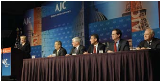
Από την ομιλία της Χ. Κλίντον. Στο πάνελ οι υπουργοί Εξωτερικών της Ολλανδίας και της Ισπανίας, ο υπουργός Άμυνας του Ισραήλ, με τον πρόεδρο και τον διευθυντή της Α.Ι.Σ.

Το Συνέδριο ξεκίνησε με συγκέντρωση για το καλωσόρισμα των συμμετεχόντων και με ομιλία του κ. Μάικλ Ορεν, πρέσβη του Ισραήλ στις Η.Π.Α., με θέμα «Παγκόσμιες Προκλήσεις για τον Εβραϊσμό στις μέρες μας». Κατά τις εργασίες της συνάντησης έγιναν εισηγήσεις από πολιτικούς επιστήμονες, πρέσβεις και αξιωματούχους για θέματα όπως η τρομοκρατία και η διεθνής νομοθεσία, τα ανθρώπινα δικαιώματα, η ταυτότητα της Ευρώπης ως πολυπολιτισμικής κοινωνίας σε σχέση με την άνοδο των φαινομένων αντισημιτισμού και ρατσισμού, η σημασία του διαλόγου και ο ρόλος των θρησκειών στην εξέλιξη των προκαταλήψεων κ.ά.