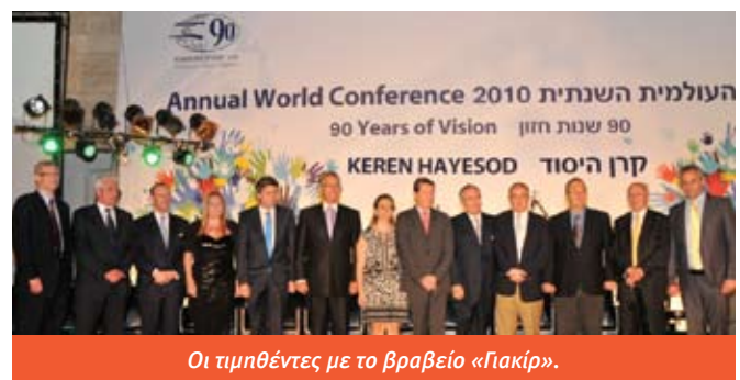
Οι τιμηθέντες με το βραβείο «Γιακίρ».

Το ποικίλο πρόγραμμα της συνάντησης, όπως κάθε χρόνο, ήταν