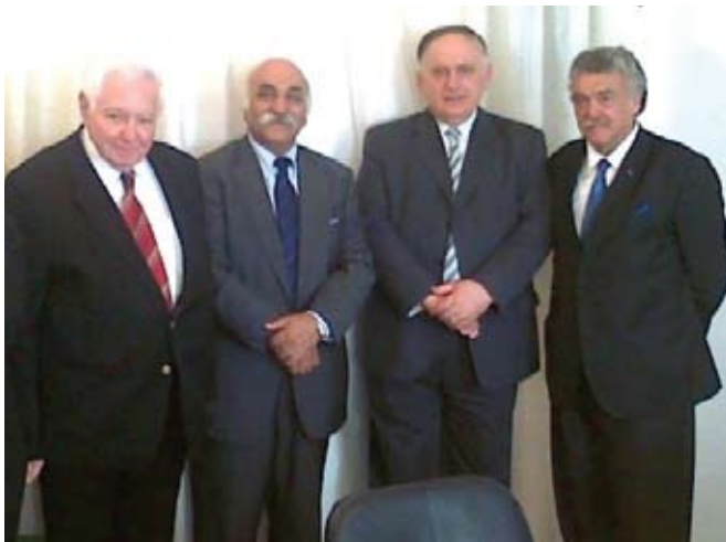
Οι πρόεδροι των Ελεγκτικών Συνεδρίων Ισραήλ και Ελλάδος με τον πρέσβη του Ισραήλ και τον πρόεδρο του Κ.Ι.Σ.Ε.

Σε δηλώσεις του για την κατάσταση της ελληνικής οικονομίας ο λόρδος Τζέικομπ Ρότσιλντ τόνισε ότι «Στην Ελλάδα πρέπει να δοθεί χρόνος για να βάλει το σπίτι της σε τάξη. Χρειάζεται χρόνος. Και χρειάζεται να μην μεσολαβήσουν επιπρόσθετα σοκ σ' αυτή τη διάρκεια».