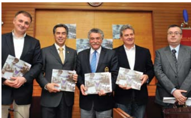
Από αριστερά: ο αντιδήμαρχος Πολιτισμού, ο δήμαρχος Θεσσαλονίκης, ο πρόεδρος του ΚΙΣΕ και της ΙΚΘ, ο πρόεδρος της Μακαμπή και ο συγγραφέας του βιβλίου.

Το λεύκωμα υλοποιήθηκε μετά από πρόταση της Ι.Κ. Θεσσαλονίκης προς το δήμαρχο Θεσσαλονίκης και αποτελεί μέρος σει-