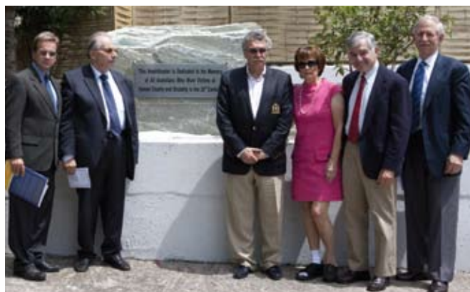
Το ζεύγος Δουκάκη (δεξιά) με τον κ. Σαλιτιέλ και τον κ. Clymer. Αριστερά ο πρόεδρος του Ανατόλια και ο πρόεδρος της Αρμενικής Κοινότητας κ. Κονταξίν.

Στις 29.5.2010, στα πλαίσια της καθιερωμένης συνάντησης των Εφόρων του Αμερικανικού Κολλεγίου Ανατόλια και της επίσκεψης του Μάικλ και της Κίττυ Δουκάκη για την επέτειο των 10 ετών από την ίδρυση της έδρας «Μάικλ Δουκάκη» στο ACT, έγιναν τα εγκαίνια της νέας αίθουσας του Ingle Hall που είναι αφιερωμένη στους Εβραίους μαθητές και αποφοίτους του «Ανατόλια» που χάθηκαν στο Ολοκαύτωμα. Στην τελετή εγκαίνιων έγιναν και τα αποκαλυπτήρια της πλάκας με τα ονόματα των Εβραίων μαθητών που φοίτησαν στο Σχολείο πριν το Ολοκαύτωμα. Σε μια δεύτερη τελετή, στο ανοικτό αμφιθέατρο της Βιβλιο-