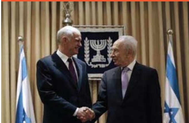
Από τη συνάντηση με τον Σιμόν Πέρες