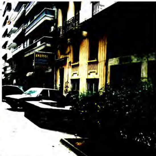
Η οικοδομή στην Καρμπολά 6, η μόνη σωζόμενη από τις προπολεμικές πολυκατοικίες στη νότια πλευρά του δρόμου. Έτσι ήταν οι κατοικίες των «κεκοιμημένων» Εβραίων της Καρμπολά

Αριστερά, οι σωζόμενες προπολεμικές οικοδομές με αριθμηση 1 και 3. Πίσω από το φωτογράφο βρίσκονται τα «παλιατζήδικα», το «μπίτ παζάρ» της Θεσσαλονίκης