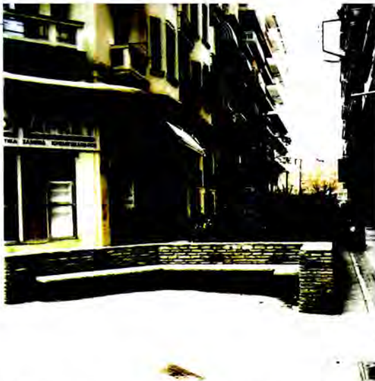
Η «εισόδος» της οδού Καρμπολά από την οδό Τσοτίσα, 2001.

Αριστερά, οι σωζόμενες προπολεμικές οικοδομές με αριθμηση 1 και 3. Πίσω από το φωτογράφο βρίσκονται τα «παλιατζήδικα», το «μπίτ παζάρ» της Θεσσαλονίκης