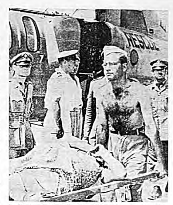
Και άλλο στιγμιότυπον από την ξένην βοήθειαν προς τους σεισμοπαθείς του Ιονίου: Νοσοκόμοι του Ισραήλ μεταφέρουν εις αμερικανικόν ελικόπτερον μίαν έγκυον Αργοστολίτισσαν. («Ακρόπολις», 16/8/1953)

Και κάτω από τα εφείπια, μέσα σε κατώγια, στα μπουλεβάφια, τα γουλόστφωτα, τις ανηφόφες, τα βόφτα, τα καντούνια, που ο απόηχος της κιθάφας και της αφιέτας δεν είχε σβύσει ακόμα, η ζωή σφάδαζε, λα-