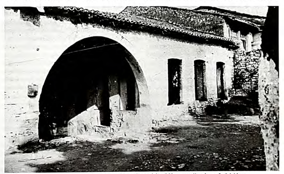
1946: Το Ισραηλιτικό Δημοτικό Σχολείο Άρτας, δίπλα στη Συναγωγή, όπου διδάσκονταν η ελληνική και η εβραϊκή γλώσσα.

του Δεσποτάτου της Ηπείρου υπήρχαν Εβραίοι στην Άρτα. Αυτή την περίοδο, χάρη στην εργατικότητα της φυλής και την υποστήριξη των Δεσποτών - κυρίως του Μιχαήλ Κομνηνού-Δούκα - η Ισραηλιτική παροικία της Άστας έγινε αξιόλογη και επέδειξε σπουδαία πολιτιστική και οικονομική δραστηριότητα. Τότε ιδρύθηκε και η πρώτη Συναγωγή κοντά στο φρούριο της Άρτας, γνωστή ως Κεϊλάτ Κόντες Τασσαβίμ, με σχολή διδασχαλίας της Εβραϊκής (Μιζράς), από την οποία αποφοίτησαν πολλοί σπουδαίοι διδάσκαλοι (Ραμπανίμ)2. Επίσης, την εποχή αυτή η Κοινότητα απέχτησε και νεχροταφείο, στο Πετροβούνι, σε χώρο που δώρισε με χουσόβουλο η Αγία Θεοδώρα, σύζυγος του Μιχαήλ Κομνηνού. Το χουσόβουλο αυτό σωζόταν στα αρχεία της Κοινότητας μέχρι το 19443. Η περίοδος οιχονομικής ανάπτυξης των Εβραίων της Άρτας διήρχεσε μέχρι το