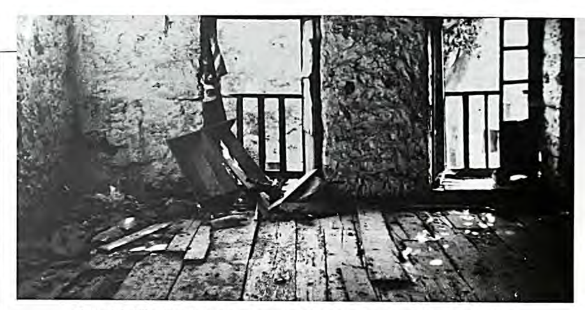
Συναγωγή «Πουλιέζα» - 22/5/1946: Άποψη του γυναικωνίτη. Στη στέγη υπάρχει άνοιγμα που προκλήθηκε από διαρρήκτες.

στο Τουρχοπάζαρο κοντά στο Φρούριο, στα Εβραϊκά 18.