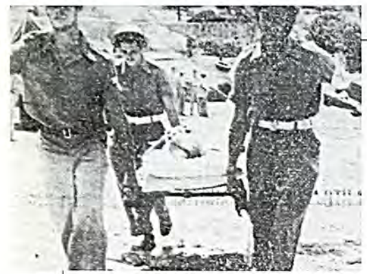
Άνδρες των Ισραηλινών πολεμικών πλοίων τα οποία έφθασαν εκ των πρώτων εις τον τόπον της καταστροφής μεταφέροντες τραυματίας. («Τα Νέα», 24/8/1953)