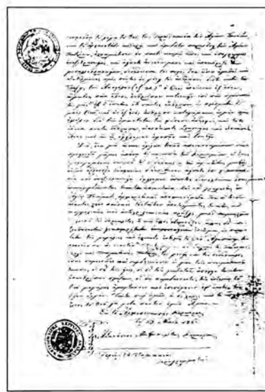
Η εγκύκλιος του Μητροπολίτη Κερκύρας, το 1861.

γνώστη Θεό, δεν είναι κριτής της συνείδησης των αλλοθρήσκων. Στις «χτηνώδεις» πράξεις κατά των Ισραηλιτών αντιπαράτασσε τη χριστιανική αγάπη. Η Ορθόδοξη Εκκλησία πάντοτε απεκήρυξε τη μισαλλοδοξία και διακήρυξε την ανεξιθρησκεία. Ο Θεός εποίησε όλους «εξ ενός αίματος» και όλοι από τη φύση είναι «α-