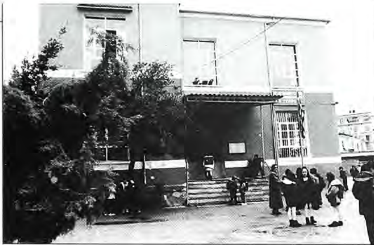
Το άλλοτε εβραϊκό σχολείο στη σημερινή οδό Αθανασίου Αργυρού στα Σέρρα, που σήμερα στεγάζει το 6ο και 16ο δημοτικό σχολείο (φωτογραφία του Θρασύβουλου Παπαστρατή).

χτηκαν από τα κρεβάτια τους αλαφιασμένοι και πίσω από τις κατακλειστες πόρτες και τα παντζούρια, που δεν τολμήσαν ν' ανοίξουν από το φόβο του κατακτητή, μπόρεσαν να διακρίνουν μα πιο πολύ να νιώσουν το μεγάλο κακό που γινόταν στους μέχρι πρότινος γείτονές τους. Και θυμήθηκε την Αλλέγκρα, που όταν έπαιζαν και μάλωναν της έλεγε: