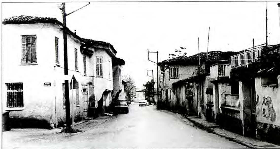
Η εβραϊκή συνοικία στα Σέρρας, σημερινή οδός Αθανασίου Αργυρού.

Στη συνέχεια δίνουμε τον αφανισμό τους, έτσι όπως