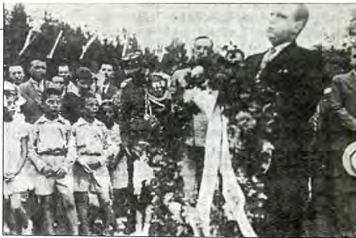
Από τα εγκαίνια της Συναγωγής στα Σέρρες το 1933 (φωτογραφία του Α. Πέννα από εφημερίδα της εποχής).