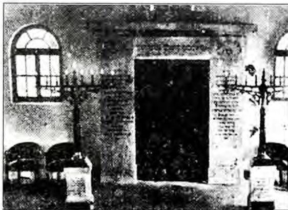
Σπάνια φωτογραφία του εσωτερικού της εβραϊκής συναγωγής που υπήρχε στα Σέρρας στην αυλή του βου και 16ου δημοτικού σχολείου. και δημοσιεύτηκε στην εφημερίδα «Το Φως» της Θεσσαλονίκης το 1933.