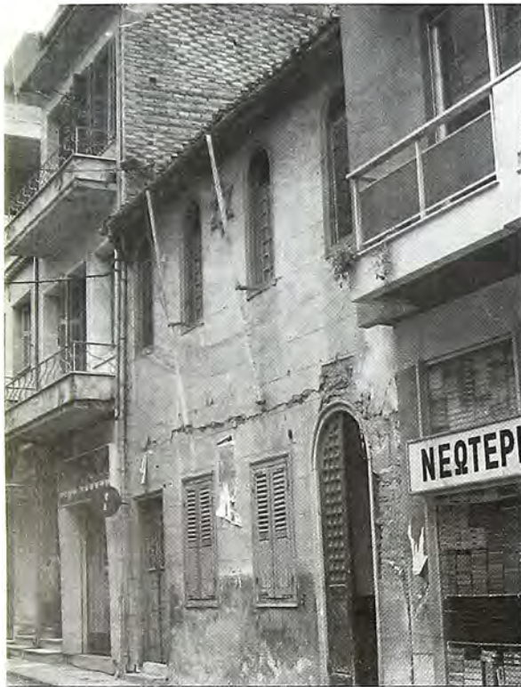
Εξωτερική άποψη της Συναγωγής Πάτρας (1979). Σήμερα δεν υπάρχει πια.