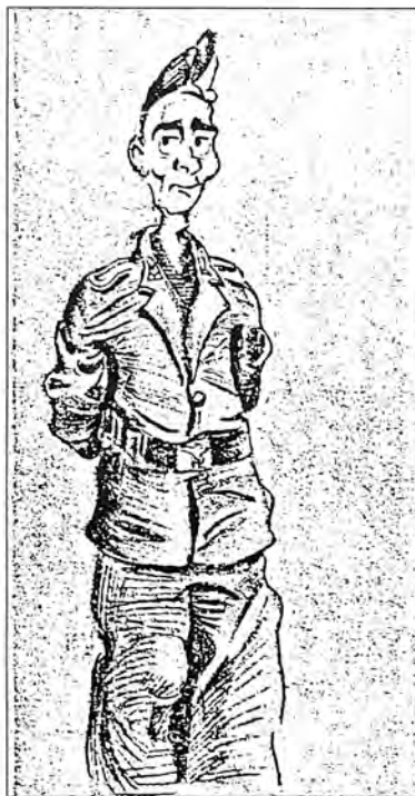
Δείγμα της τελικής μορφής των Γερμανών φρουρών μας στο τέλος του πολέμου.

«Για πέστε μας τώρα» τους είπα «πώς βρεθήκατε εδώ κοντά μας;» Ευχαρίστως μας έδωσαν αρκετές, γεμάτες πόνο, πληροφορίες για το Στρατόπεδό τους, που βρισκότανε λίγο πιο πέρα απ' το αεροδρόμιο και που περιείχε, προτού αρχίσουν να τους εκτελούν την παραμονή της Πρωτομαγιάς του 1945, δυό έως δυόμισι χιλιάδες, περίπου Εβραίους εργάτες της ίδιας περίπου καταστάσεως, μ' αυτούς τους δυό που μας μιλούσαν, για να μην πω και χειρότερα, αφού δεν είχαν το κουράγιο, ούτε μαζί τους να έλθουν, μερικοί άλλοι που υπήρχαν. Είχαν υποφέρει τα πάνδεινα από τα Γερμανικά ΕΣ-ΕΣ κατά την διάρκεια που τους διοικούσαν, κι είναι γνωστά, σ' όλη την ανθρωπότητα, τα μαρτύρια που υπέστησαν, ήσαν εξαντλημένοι από την πείνα, γιατί δεν εύρισκαν τίποτα να βάλουν στο στόμα τους. Τους