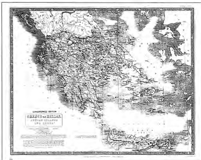
A. K. Johnston, «Greece or Hellas, Ionian Islands and Crete», χρ. 1850.

να μέρη από τα τέλη του 15ου αιώνα. "Πολλοί εγκαταστάθηκαν στα Μαντεμοχώρια..., στην Αδριανούπολη, Θεσσαλονίκη, Σκόπια, Μοναστήρι, Σόφια και μάλιστα στην Κωνσταντινούπολη" 15 . Εκτός όμως από τη Θεσσαλονίκη και στη Λάρισα, τα Τρίκαλα, τα Ιωάννινα, σε πόλεις του Μοριά, την Κρήτη και τα νησιά του Αιγαίου και του Ιονίου.