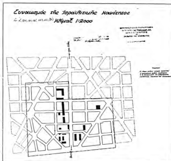
Εικ. 1: Σχέδιο συνοικισμού Κάμπελ, 1928. Με τη συνεχή γραμμή δηλώνονται τα εγκεκριμένα όρια οχυροτομίας και με την εστιασμένη η μελλοντική του επέκταση. Με το μαύρο σημειώνονται οι υφιστάμενες κτιριακές εγκαταστάσεις.

Ο ι συνοικισμοί Κάμπελ - Βότση, Βυζαντίου και Καλαμαριάς, συνιστούν σήμερα την εσωτερική ζώνη του Δήμου Καλαμαριάς, από την οδό Εθνικής Αντίστασης ως το γήπεδο του Απόλλωνα. Ως προς τον τρόπο δημιουργίας τους, αντιπροσωπεύουν τρεις διαφορετικές ιστορίες ίδρυσης προσφυγικών συνοικισμών: Ένας εβραϊκός συνοικισμός, του Κάμπελ, που μετατράπηκε μετά από βίαια επεισόδια σε προσφυγικό, ένας συνεταιριστικός του Βυζαντίου και ένας κρατικός, της Καλαμαριάς, με τα διάφορα τμήματά του.