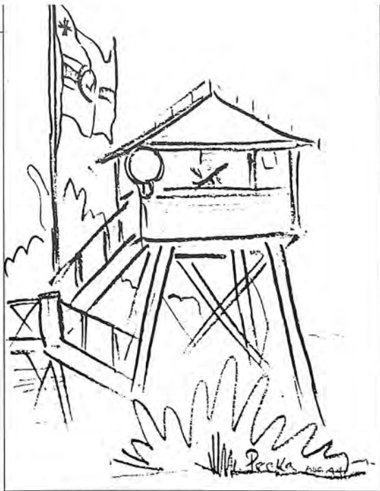
Το φυλάκιο της κύριας πύλης του στρατοπέδου μας.