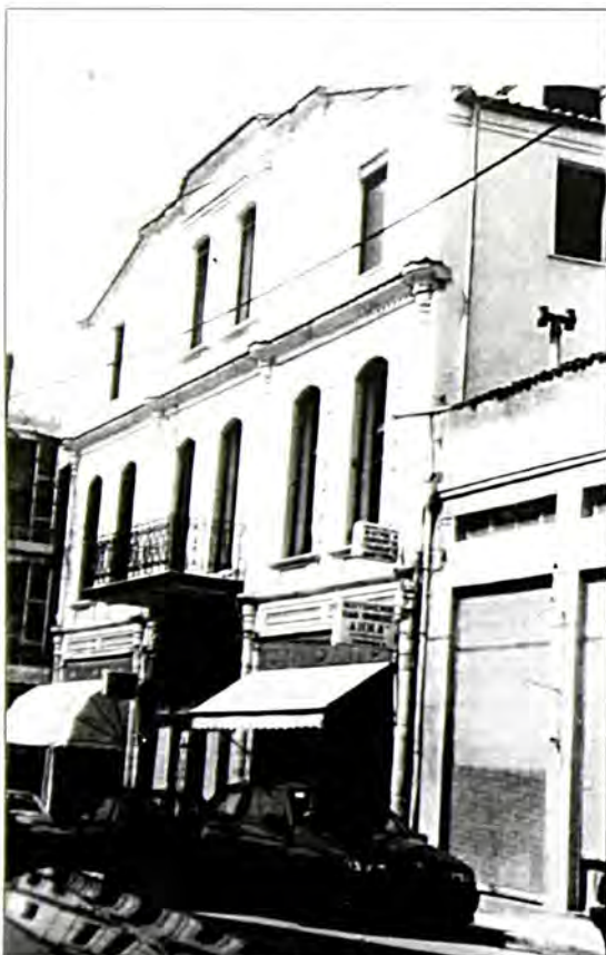
Παλιά κατοικία του Ελιέζερ Τσιβέτ. Σήμερα αναπαλαιωμένη, έχει ανακηρυχθεί διατηρητέα.