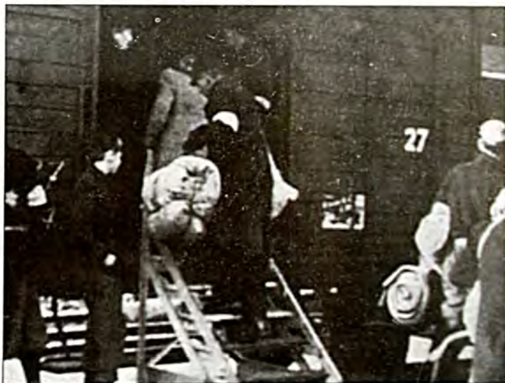
Αναχώρηση για το στρατόπεδο

Α ντίθετα από ό,τι «πιστεύουν οι περισσότεροι, ο συνολικός αριθμός των θανάτων των στρατοπέδων ήταν δέκα εκατομμύρια, και όχι έξι. Έξι εκατομμύρια Εβραίοι, και τέσσερα διάφοροι άλλοι, κυρίως Ρώσοι, Ουκρανοί, Πολωνοί, αλλά και Αθίγγανοι και αντιναζιστικοί από όλες τις κατακτημένες χώρες. Βασανίζονταν όχι μόνο από την πείνα, το κρύο, τις αρρώστιες, αλλά και από τους δεσμοφύλακες τους. Εξαντλημένοι, ημιπερπατοί, έπρεπε να εργάζονται χωρίς στιγμή αναπαύσεως. Αν οι φρουροί τους έβλεπαν να ζωντανασαίνουν, τους χτυπούσαν με μαστίγια. Σώζεται έγγραφο του «οίκου» που ζητά από την κεντρική διεύθυνση να ενισχυθούν τα μαστίγια με δερμάτινες εξοχές και αλυσίδες. Υπάρχει αναφορά του οικογενειακού γιατρού των Κρουπ η οποία λέει ότι το φαγητό που δινόταν - 350 θερμίδες - ήταν τελείως ακατάλληλο και ανεπαρκές. Άλλοι, όπως για παράδειγμα η επιχείρηση I. Γκ. Φάρμπεν, έδιναν κάτι περισσότερο, και για όσους έκαναν βαριές εργασίες υπήρχαν και συμπληρωματικά γεύματα. Αυτό φανερώνει ότι οι εταιρείες που χρησιμοποιούσαν σκλάβους αν ήθελαν μπορούσαν να βελτιώσουν τις συνθήκες διαβίωσής τους. Ο Άλφρεντ