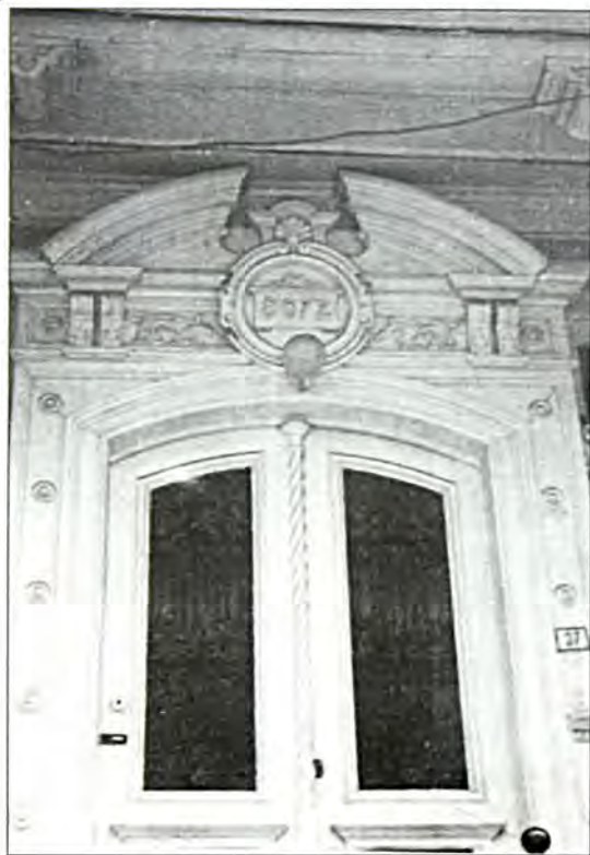
Στη φημισμένη πρωτεύουσα της Ανατολικής Θράκης, την Αδριανούπολη, υπήρχε ανθούσα Ισραηλιτική Κοινότητα και Αρχιραββινεία με αρμοδιότητα όλη τη Θράκη. (Σχετικό άρθρο έχει δημοσιευθεί στο τεύχος 91, Νοέμβριος 1986, του περιοδικού μας).

Από τη σχολική χρονιά 1936/7 καταργήθηκε η διδασκαλία των γαλλικών και της ισπανοεβραϊκής και διατηρήθηκε η διδασκαλία της των ελληνικών και των