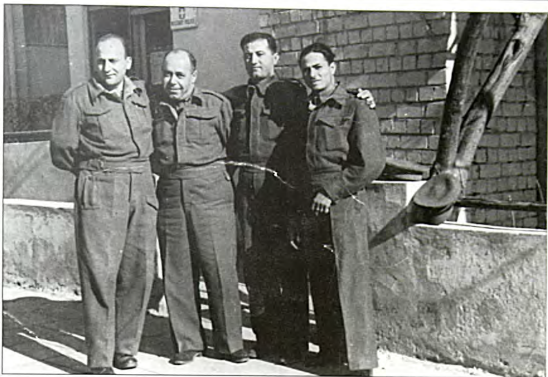
Διδυμότειχο: Εβραίοι στρατευμένοι.

λωση. Από τα προηγούμενα χρόνια η Κοινότητα είχε ενδιαφερθεί για τη μόρφωση των κοριτσιών της, και την περίοδο εκείνη οι συνθήκες είχαν ωριμάσει ώστε το σχολείο να γίνει μεικτό. Ο μικρός όμως χώρος του κτιρίου δεν επαρκούσε για το μεγάλο αριθμό των μαθητών, και η Κοινότητα πρότεινε στην Alliance την ανέγερση νέου σχολείου, αναλαμβάνοντας τη δαπάνη κατά το 1/3. Ύστερα από πολλές δυσκολίες και καθυστερήσεις, έγιναν τον Μάιο του 1911 τα εγκαίνια του νέου κτιρίου, με την παρουσία των θρησκευτικών, πολιτικών και στρατιωτικών αρχών. Μέσα σε μια πανηγυρική και συγκινητική ατμόσφαιρα ο διευθυντής εκφώνησε ένα σημαντικό λόγο και οι μαθητές απήγγειλαν ποιήματα στα γαλλικά, και ανέβασαν το έργο του Μολιέρου "Ο Αρχοντοχωριάτης", επίσης στα γαλλικά, γεγονός που έκανε μεγάλη εντύπωση τόσο στους γονείς, όσο και στο κοινό για τη μεγάλη πρόοδο των μαθητών. Η ισπανοεβραϊκή εφημερίδα της Ανδριανούπολης "La voz de la verdad" (Η Φωνή της Αλήθειας) έκανε εκτενή περιγραφή των εγκαίνιων και σχολίαζε ότι "οι Εβραίοι του Διδυμοτείου αποτελούν μια υποδειγματική Κοινότητα".