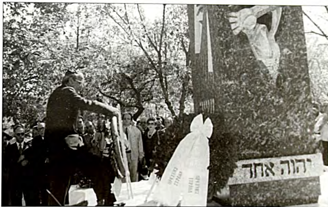
Κατάθεση στεφάνων στο Μνημείο Ολοκαυτώματος