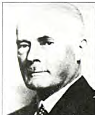
Άλφρεντ Κρουπ (1907 - 1967)

Ο Οίκος Κρουπ, στη Γερμανία, βαρύνεται με φοβερά εγκλήματα πολέμου. Μεταξύ των άλλων οι Κρουπ είχαν δικά τους στρατόπεδα αιχμαλώτων και χρησιμοποιούσαν τους κρατούμενους για να εργαστούν στα εργοστάσιά τους μέχρι να πεθάνουν από τις στερήσεις. Οι περισσότεροι πέθαναν, αλλά αυτοί που επέζησαν μίλησαν.