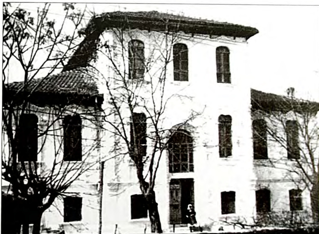
Το κτίριο του παλαιού Εβραϊκού Δημοτικού Σχολείου