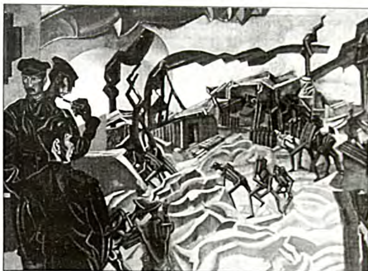
Στον Πρώτο Παγκόσμιο Πόλεμο ο Λιένης Ερυθρός Σταυρός είχε σαράντα χρόνια πείρας και, παρά τις απρόβλεπτες πράξεις των Ερρίκων Ντυνάν, είχε την ικανότητα πλέον να προσφέρει ουσιαστικά στους λαβωμένους και τους αιχμαλώτους ιστήν φροντίδα, έργο του Ονίστερ Λιούις “Έκρηξη οβίδας”, 1919).

Ο Ερυθρός Σταυρός δεν είναι μια ενιαία οντότητα. Υπάρχει η Διεθνής Επιτροπή του Ερυθρού Σταυρού, με έδρα της τη Γενεύη, που επιβλέπει τις πολεμικές επιχειρήσεις και είναι ο φύλακας της Συνθήκης της Γενεύης. Η διοικούσα επιτροπή του αποτελείται από 25 Ελβετούς πολίτες (όπως γίνεται από το 1875), οι οποίοι διευθύνουν όλες τις εθνικές επιτροπές του Ερυθρού Σταυρού ανά τον κόσμο, όπως τον Αμερικανικό Εθνικό Σταυρό ή την Ερυθρά Ημισέληνο, του Μαρόκου. Υπάρχει και η Λίγκα του Ερυθρού Σταυρού και η Επιτροπή της Ερυθράς Ημισέληνου με έδρα επίσης την Γενεύη από το 1994, που έργο τους είναι η αποστολή βοήθειας σε καταστροφές πολιτών. Οι δύο αν-