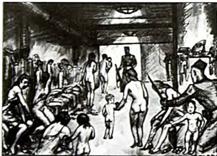
Γυναίκες και παιδιά περιμένουν τη σειρά τους στον προθάλαμο για να τουςβάλουν στους φούρνους των καμμοτορίων. (Σκίτσo D. Oler, 1946).

Στις αρχές του 1951 δόθηκε γενική αμνηστία. Το 1952 ρυθμίστηκε το ιδιοκτησιακό καθεστώς. Ο πρωτότοκος Κρουπ κρατούσε όλα τα εργοστάσιά του με την συμβατική υποχρέωση να μην παράγει χάλυβα - άρα ούτε και όπλα. Η νεόκοπη Ομόσπονδη Γερμανική Δημοκρατία τον αποζημίωσε με 70 εκατομμύρια μάρκα για την παραγωγή που του στερούσαν. Σε τέσσερα χρόνια η συμφωνία του 1952 ανακλήθηκε. Με μόνη εξαίρεση τους εξοπλισμούς. Ο «οίκος» ήταν ελεύθερος να παράγει ό,τι ήθελε. Εφτιαχνε εξοπλιστικά μηχανήματα, εξόπλιζε εργοστάσια τοιμέντου σε όλη την Ευρώπη, έφτιαχνε ζρεμαστές γέφυρες και φράγματα. Το σήμα των Κρουπ κυμάτιζε σε πολλές χώρες - ανάμεσά του ήταν και η Ελλάδα όπου κατασκεύασε διυλιστήρια.