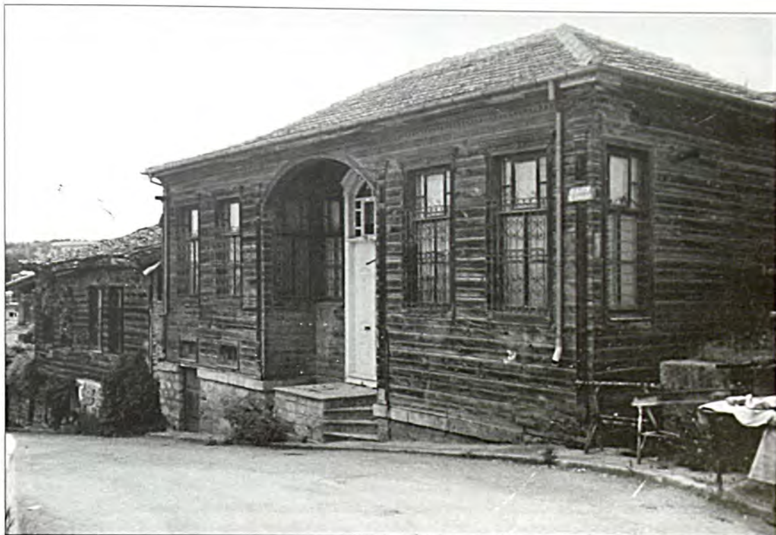
Η οικία του Νισήμ Ταραμπονλούς στο Διδυμότειχο. Πιο κάτω διακρίνεται το παγογυάλιο και το σημειολογικό του ανήκαν στον Χ. Εργάζ.