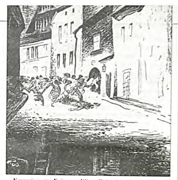
Κουμμένοι στο Γκέτο της Vilna (Πολωνία) κατά τη διάφκεια έφευνας της Αστυνομίας (Πίνακας του M. Bahelfer).

Η ιστορία της δημοσίευσής του ή μάλλον της μη - δημοσίευσής του δίνει ένα δείγμα του τι σήμαινε να είναι χανείς