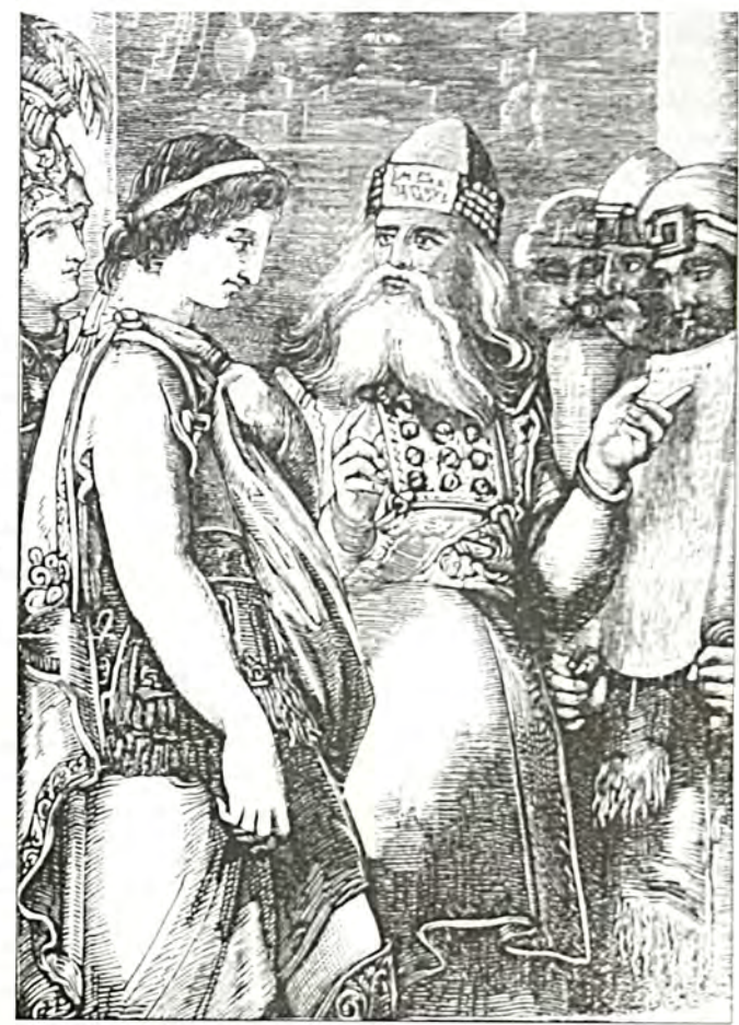
Ιαδδούς ο Αρχιερεύς δειχνύων εις τον Μέγαν Αλέξανδρον την περί αυτού προφητείαν του Δανιήλ (Δανιήλ χεφ.η'). "Εφημερίς των παίδων", Εν Αθηναις, Μαίος 1878 - [Αρχείο περιοδιχού "Γιατί"].

Του κ. ΜΩΥΣΗ ΑΙΤΣΗ Δημοσιογοάφου -Απόφοιτου τμήματος Ιστοοίας και Κλασσικών Σπουδών του Πανεπιστημίου του Τελ Αβίβ