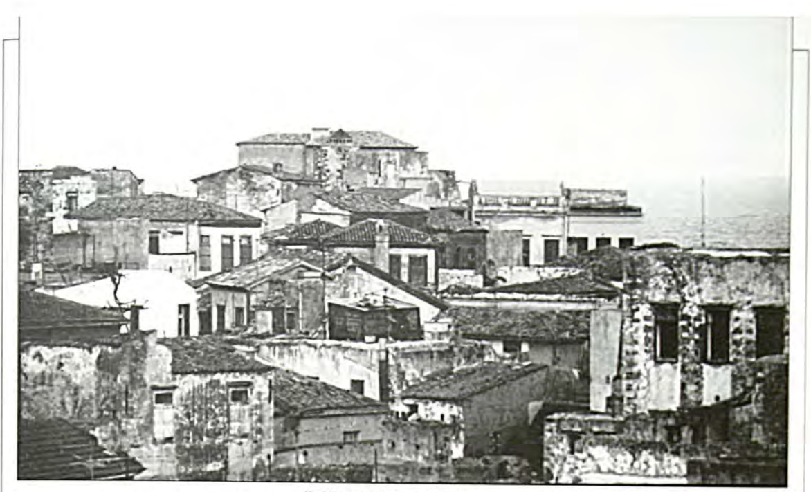
ΧΑΝΙΑ: Τμήμα της παλιάς συνοιχίας

Επίσης, υποθέτουμε ότι οι εβοαϊχές κοινότητες της Κοήτης, όπως και οι πεοισσότεοες που βοίσχονται στα όοια του Βυζαντίου, θα είχαν εσωτεοιχή αυτέλεια έναντι χαταβολής ενός σημαντιχού ποσού φόρου.