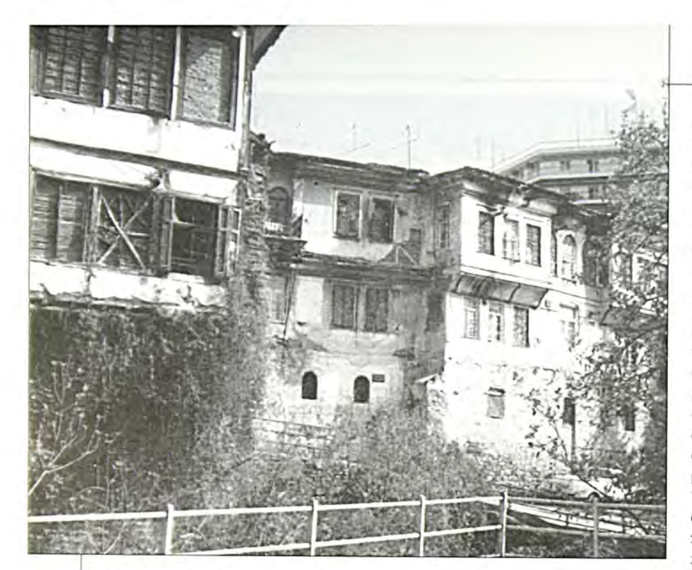
Βέφοια: Αφχοντικά στην όχθη του Τριπόταμου

εσωτεφιχού της Εβφαϊχής συνοιχίας δίπλα στην όχθη του Τφιπόταμου. Χτίστηχε ή επισχευάστηχε εχ βάθφων, με σουλτανιχό φιφμάνι του 1850 χαι συγχεντφώνει αρχιτεχτονιχά στοιχεία πφογενέστεφών της μιχφών συναγωγών της Θεσσαλονίχης. Τέσσεφις χίονες στο χέντφο του χώφου οφίζουν το βήμα (τεβά) ενώ το Ιεφό (Εχάλ) βφίσχεται στον ανατολιχό τοίχο. Το πάτωμα φτιαγμένο από ξύλινες σανίδες, είναι διαχοσμημένο στο χέντφο με μωσαϊχά διαχοσμητιχά πλαχάχια. Πίσω από τη συναγωγή διασώζεται αχόμη χαλυμένο με βλάστηση το μιχβέ (θφησχευτιχός λουτφώνας).