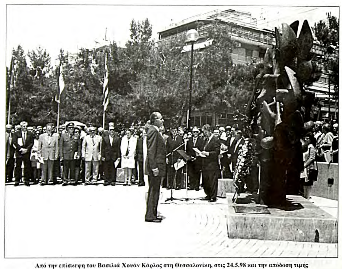
στο μνημείο Ολοχαυτώματος των Εβραίων της Θεσσαλονίχης

[Ομιλία που εχφωνήθηχε στο Ισφαηλιτιχό Νεχοσταφείο Αθηνών στις 26 Απφιλίου 1998, χατά την επέτειο του Ολοχαυτώματος]