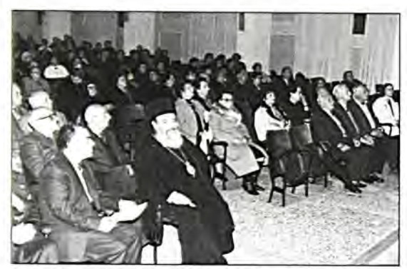
Στιγμιότυπο από την εκδήλωση στο Πνευματικό Κέντρο της Μητροπόλεως Δημητριάδος, Διακρίνονται ο Σεβασμιώτατος Μητροπολίτης κ. Χριστόδουλος και μέλη του Δ.Σ. της Ισραηλητικής Κοινότητος Βόλου.

Του Μητοοπολίτη Δημητοιάδος κ.κ. ΧΡΙΣΤΟΔΟΥΛΟΥ