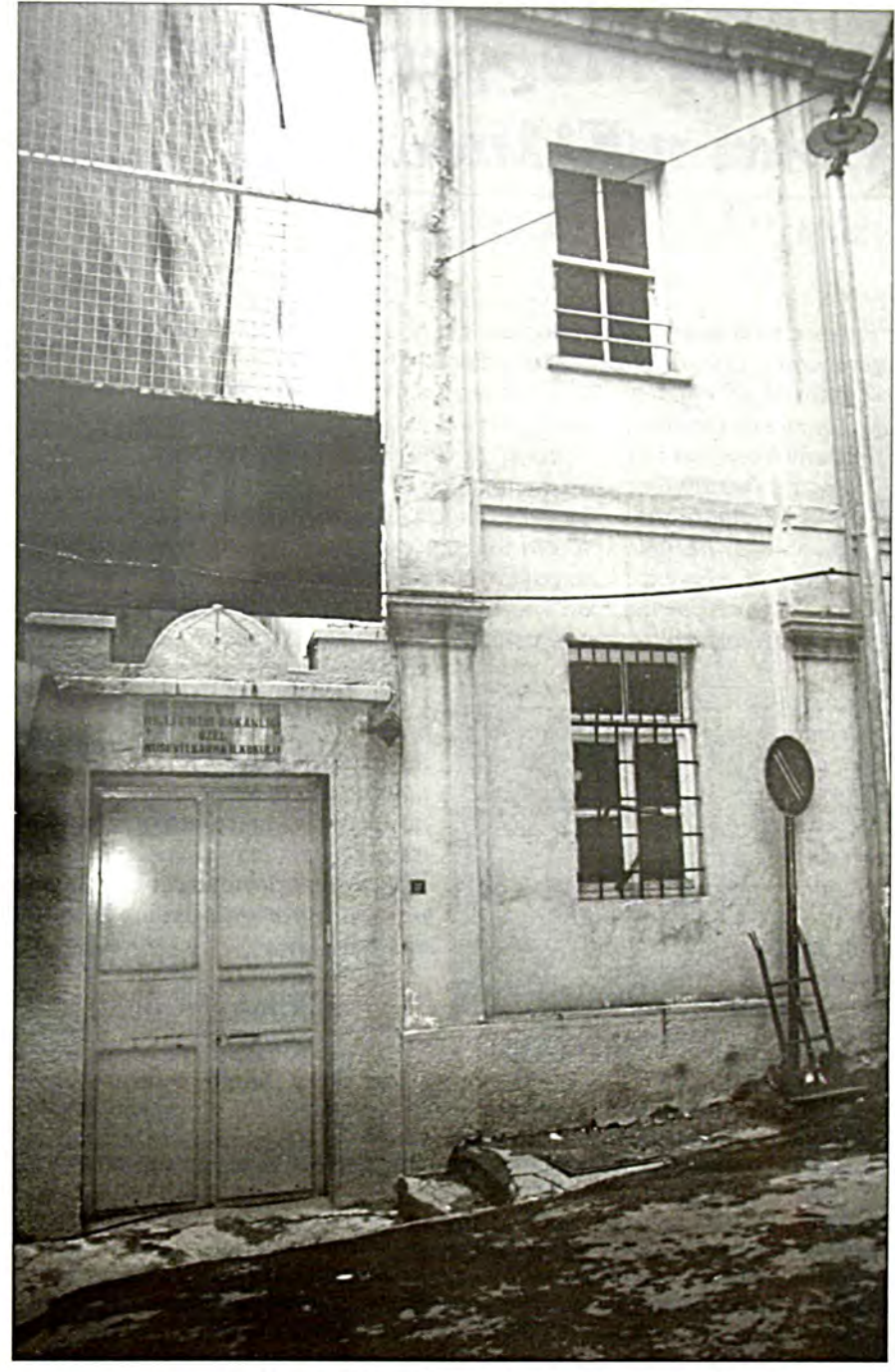
Γαλατάς: Εβραϊκό Δημοτικό Σχολείο (μικτό)

σ' όλη την Τουρχία. Έχοντας εγχαταλείψει τις παραδοσιαχές γειτονιές τους, προτιμώντας να κατοιχήσουν σε άλλα σημεία της Πόλης - συχνά στο Βόσπορο. Καίτοι διατηρούν αχόμη κάποια παρουσία και δράση στην Πόλη, λειτουργούν συλλόγους και πολιτιστικά κέντρα, εκδίδουν την εφημερίδα Salom, και μερικά μέλη της κοινότητας έχουν αξιόλογη θέση στην πνευματική και