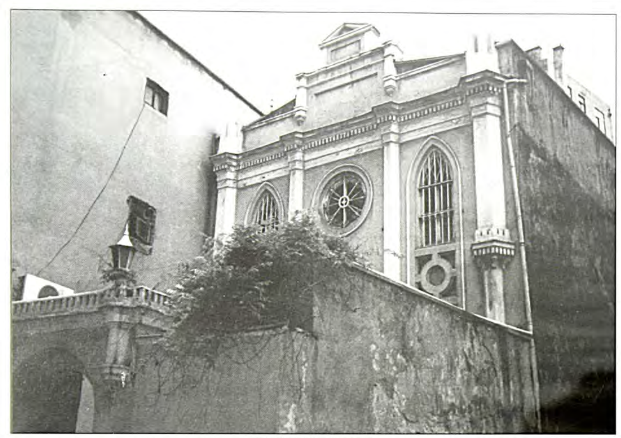
Γαλατάς: Ιταλική Συναγωγή

ντονμέδες, εξισλαμισθέντες δηλαδή Εβοαίοι, που όμως ποτέ δεν ενσωματώθηκαν απόλυτα στο Ισλάμ και διατηφούσαν στοιχεία της καταγωγής τους. Οι ντονμέδες, δηλαδή αρνησίθοησχοι, ήταν απόγονοι των οπαδών του αισετικού Sabbetai Zevi, που προσχώρησαν στο Ισλάμ τον 17ο αιώνα. Γνωστοί και με τις πιο κομψές - σε σχέση με το υποτιμητικό donme - ονομασίες Ma'min και Sabbatians, εκτιμάται σήμερα πως κινούνται πληθυσμιαχά σ' έναν αριθμό ανάμεσα στις είχοσι χαι τις πενήντα χιλιάδες. Στην Πόλη ονομάζονται επίσης και Selanikler, δηλαδή Σαλονιχιώτες, Θεσσαλονιχείς, από τον τόπο της καταγωγής τους. Και σήμερα ακόμη, τα άτομα που προέρχονται απ' αυτή την ομάδα, ξεχωρίζουν απ' τους υπόλοιπους μουσουλμάνους. Η ανάμνηση της εβοαϊκής τους οίζας είναι έντονη. Χαρακτηριστικά δε, έχουν δικό τους τζαμί και σχολεία στο Nisantas-Tesvikive και νεκοοταφείο στο Σκούταοι. Τα σχολεία τους, το Sisli Terraki της ομάδας των Καπαντζήδων και το Isik των Καραχάσηδων, είχαν πρωτοϊδουθεί στη Θεσσαλονίκη τον περασμένο αιώνα, απ' όπου μεταφέρθηκαν στην Πόλη μετά την αναγκαστική μετανάστευσή τους στα 1923. Πέραν των δύο πιο πάνω ομάδων υπάργει και αυτή των Γιακουμπίνων, γεγονός που φανερώνει την πολλαπλή διάσπασή τους ως χοινότητας, ποάγμα άλλωστε αναμενόμενο, αφού πρόκειται για αρνησίθρησκους και εξωμότες. Τέλος,