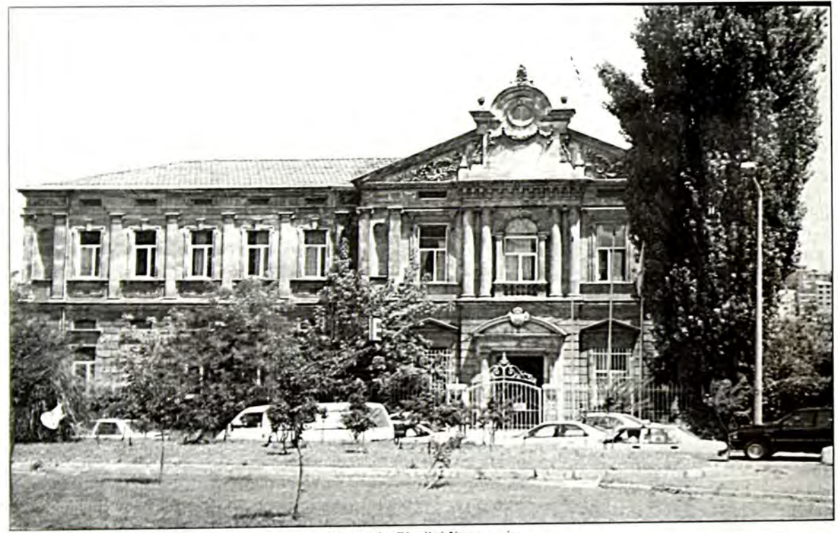
Μπαλατάς: Εβραϊκό Νοσοκομείο

να εκμεταλλευτεί τη δυναμική τους και να ενισχύσει με μια σφοιγηλή φυλή και με νέο αίμα το αχανές κράτος του, ο Σουλτάνος Βαγιαζήτ ο Β', πολύ έξυπνα ποιών, επέτρεψε και ενθάρουνε την εγκατάστασή τους αυτή. Έπειτα από λίγο, ήρθαν ως φυγάδες κι εγκαταστάθηκαν μαζικά, κυρίως στη Θεσσαλονίκη και στην Κωνσταντινούπολη. Έτυχαν μάλιστα προνομίων και δεν χαρακτηρίστηκαν ραγιάδες, όπως οι χριστιανικές εθνότητες της Αυτοκρατορίας, αλλά φιλοξενούμενοι (misafir). Ξεκινώντας από την αρχική τους αυτή εγκατάσταση, οι Εβραίοι στη συνέχεια εξαπλώθηκαν και σε άλλες πόλεις του τότε Οθωμανικού κράτους και δημιούργησαν κοινότητες τόσο στην Ευρώπη