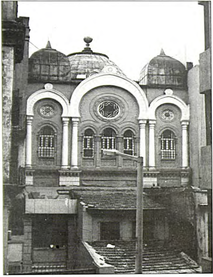
Γαλατάς: Συναγωγή Ασχενάζυ

καθώς και το Κουσκουντζούκι στα παλιότερα χρόνια, ήταν εβραιογειτονιές. Μεγάλες ρωμαίικες και αρμένικες εκκλησίες μπορεί να υπήρχαν εκεί - και υπάρχουν ακόμη - και αντίστοιχες αξιόλογες κοινότητες επίσης, όμως στις συνοικίες αυτές, το εβραϊκό στοιχείο ήταν κυρίαρχο.