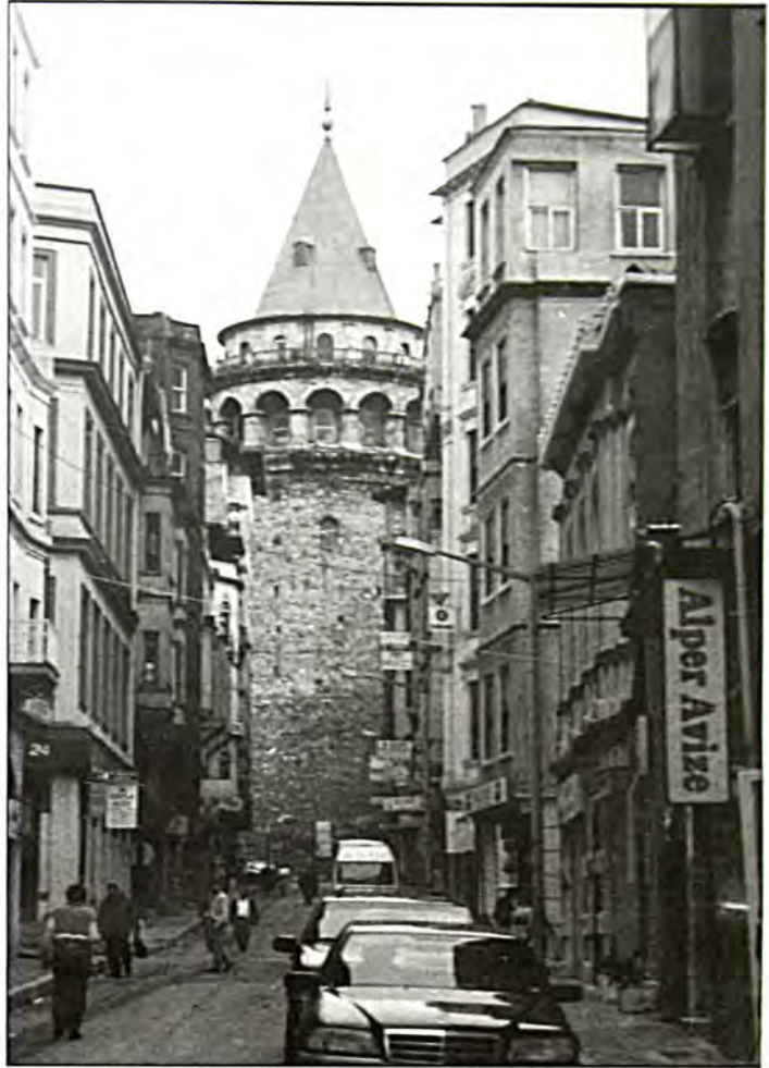
Γαλατάς: Εβραϊκός δρόμος προς τον Πύργο

Εξάλλου δεν πρέπει να διαφεύγει της προσοχής μας, το γεγονός ότι η εβραϊκή γλώσσα είχε ουσιαστικά καταστεί νεκρή, ως τις αρχές του 20ού αιώνα σχεδόν,