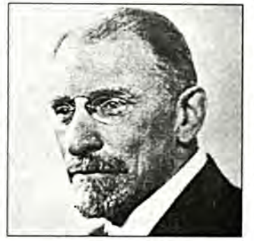
Ο Ερρίκος Μοργκεντάου

κάτω ορισμένα ενδιαφέροντα αποσπάσματα που αφορούν και αναφέρονται στην κρίσιμη εκείνη εποχή και που δείχνουν τα ακραιφνή φιλελληνικά αισθήματα και τον συναισθηματισμό του μεγάλου αυτού ανθρώπου και φιλέλληνα.