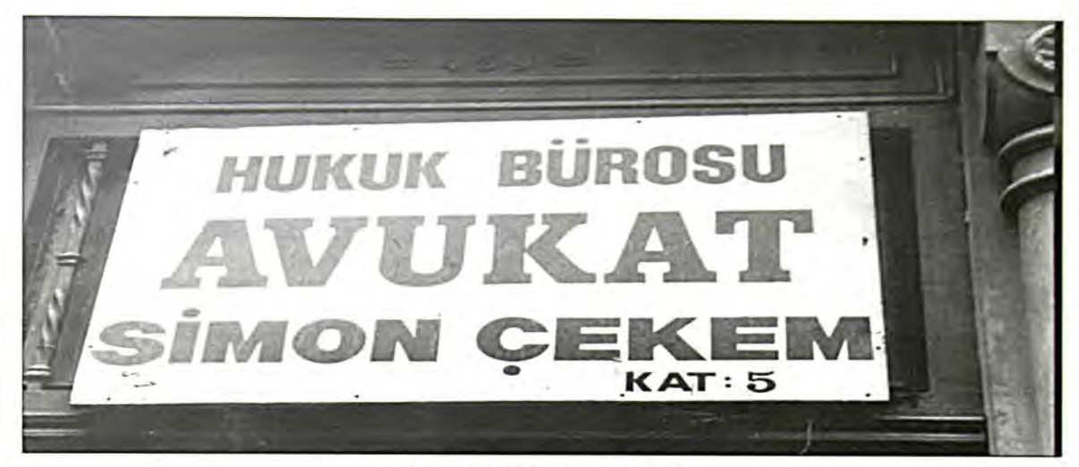
Γεραν: Εβραϊκό Δικηγορικό Γραφείο

(Αδοιανούπολη, Βέοοια, Διδυμότειχο, Καστοοιά, Καβάλα, Κομοτηνή, Ξάνθη, Μοναστήοι κ.ά.) όσο και στη Μικοά Ασία (Σμύονη, Προύσσα κ.ά.).