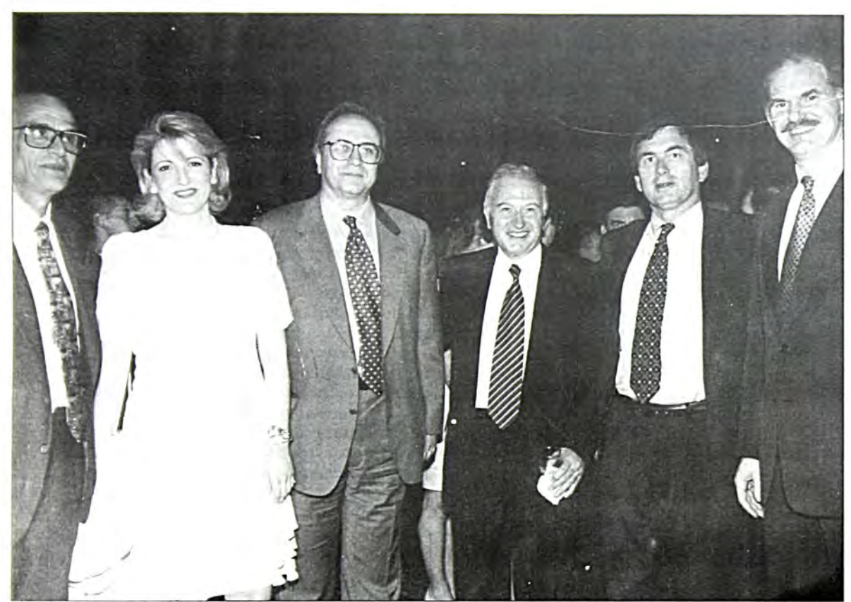
Απο αφιστερά ο γ. γραμματέας του ΚΙΣ κ. Μ. Κωνσταντίνης, ο πρόεδρος του «Συνασπισμού» με τη σύζυγό του, ο πρόεδρος του ΚΙΣ κ. Ν. Μάις, ο επιτετραμμένος της πρεσβείας των ΗΠΑ κ. Τ. Μίλερ και ο υπουργός Εθνικής Παιδείας κ. Γεώργιος Παπανδρέου.