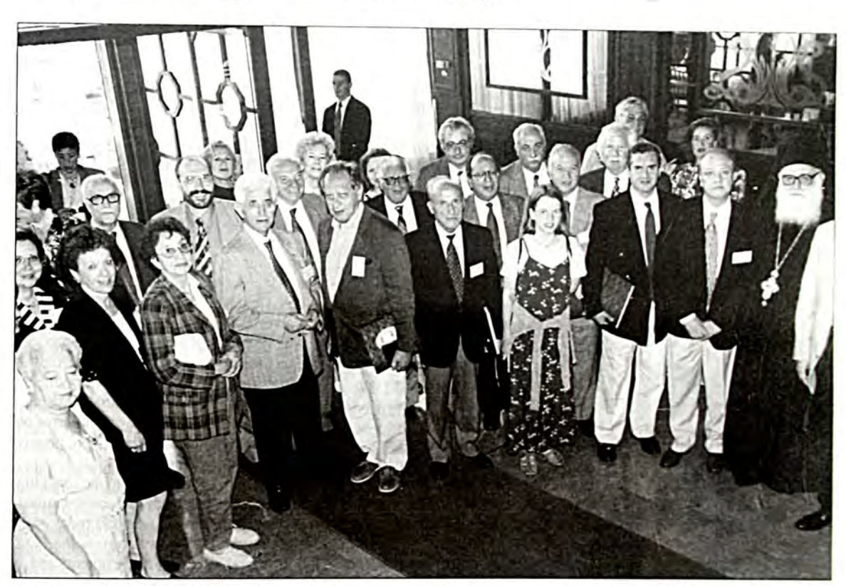
The representatives of international Jewish Organizations, photographed during their visit to Thessaloniki, with the representatives of the Greek Orthodox Church, the local authorities and the leadership of the Jewish Community of Thessaloniki.

Today the historical remembrance goes back to the past. We thank and we honour the Jewish Organisations abroad, we thank and we honour the Greek Church, the State and the political leadership, the public administration, the local Authorities and the officials of the Greek State, who assisted us at the hard times of the re-establishment out of the chaos of the disaster. Without them, the «relics» of the Greek Jewry would have been lost as well. If we managed to revive, we owe it to them. Ending my address, I would like to stress that the only way which leads to real «World Peace» must pass through the condemnation of prejudice, racism. intolerance and discrimination. And this is the Way of Education, in attendance to which stand the ideals of the civilizations of the ancient Mediterranean peoples.