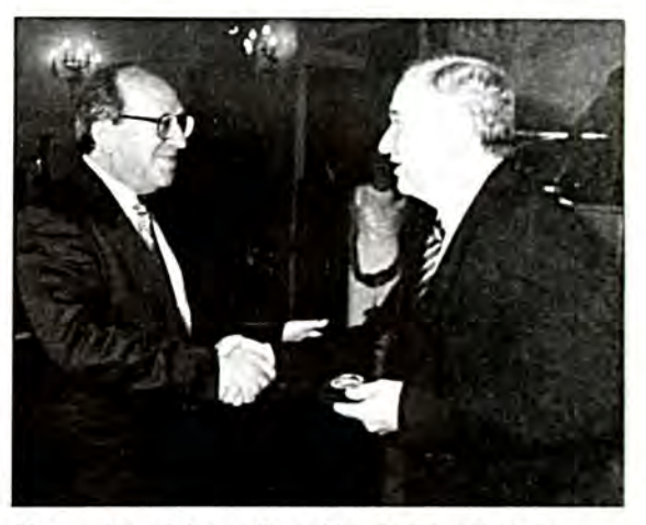
The medal awarded to the State of Israel was presented to the Israeli Ambassador in Greece Mr. David Sasson. Απονομή μεταλλίου στον εκπροσωπο του Κρατους του Ισραφί στην Ελλάδα πρέσβη κ. David Sasson.

Ο πρόεδρος του ΚΙΣ κ. Ν. Μαΐς απονέμει μετάλλιο στον εκπρόσωπο του Προέδρου της Δημοκρατίας πρέσβη κ. Γ. Κακλίκη.