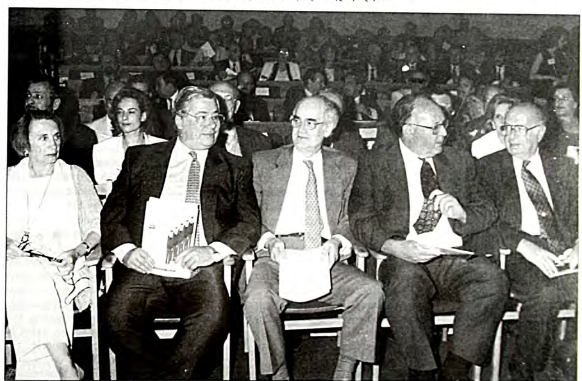
Από την τελετή στην Παλαιά Βουλή. Από αριστερά η εκπρόσωπος της UNESCO κα Clara James, ο αρχηγός της Αξιωματικής Αντιπολίτενσης κ. Μιλτιάδης Έβερτ, ο Πρόεδρος της Βουλής κ. Απόστολος Κακλαμάνης, ο υπουργός Εξωτερικών κ. Θεοδωρος Πάγκαλος και ο πρεσθης κ. Richard Sheifter, μέλος του Συμβουλίου Εθνικής Ασφαλείας των ΗΠΑ.

Ο μόνος δοόμος που οδηγεί στην ποαγματική «ειοήνη του σύμπαντος κόσμου» περνά μέσα από την καταδίκη της μισαλλοδοξίας, των ποοκαταλήψεων, του ρατσισμού και των διακρίσεων.