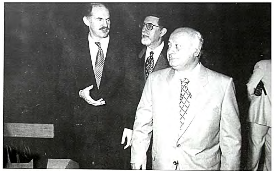
Ο υπουργός Εθνικής Παιδείας κ. Γεώργιος Παπανδρέου, ο πρύτανης του Πανεπιστημίου Πειραιώς κ. θ. Γκαμαλέτσος και ο αναπλ. υπουρ Εξωτερικών κ. Γεωρ. Ρωμαίος.

Θα ήθελα να σταθώ στην ιδιαίτερη συμβολή της Ελληνικής Εκκλησίας. Ο Αρχιεπίσκοπος Δαμασκηνός, με τη μοναδική σ' ολόκληρη την υφήλιο ιστορική Διακήρυξη, την οποία προσυπέγραψαν σύσσωμοι οι 29 εκπρόσωποι του πνευματικού, επιστημονικού, εμποροβιομηχανικού και καλλιτεχνικού κόσμου της χώρας, διακήρυξε προς τις Αρχές Κατοχής: