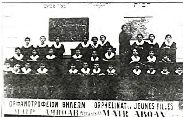
Το ορφανοτροφείο «Ματρώ Αμποάβ».

γες 5.761 άτομα, συνολικά ποσοστό 78,79% 31 . Έτσι συνολικά στη Γενική Διοίκηση της Θεσσαλονίκης 32 κατά το μέσον του 1923 μαρτυρούνται συνολικά 72.455 Εβραίοι επί συνολικού πληθυσμού 987.724 ατόμων, ποσοστό 7,34% με προέχουσα την πόλη της Θεσσαλονίκης. Συμπερασματικά η εβραϊκή κοινότητα της Θεσσαλονίκης, η οποία κατά το μέσον του 1923 αριθμούσε κατά την έκθεση του Γενικού Διοικητή της Θεσσαλονίκης. Α. Λάμπρου 70.000 Εβραίους την οποία έκθεση θεωρούμε και ακριβέστερη αφού έγινε «επί τη βάσει εξηκριβωμένης εθνολογικής στατιστικής» 33 , δεν παρουσιάζει σημαντικές αποκλίσεις αριθμητικού χαρακτήρα των μελών της από προηγούμενο αριθμό τους, κατά μεν το 1916 - 1917 όπου μαρτυρείται ότι αριθμούσε 61.400 άτομα επί συνολικού πληθυσμού 165.704 ατόμων και κατά το 1919 - 1920, όταν μαρτυρείται ότι αριθμούσε 74.000 άτομα 34 και κατ' άλλη μαρτυρία 70.000 35 κατέχοντας, πάντοτε, τη δεύτερη θέση στην πόλη από πληθυσμιακή άποψη μετά το ελληνικό στοιχείο.