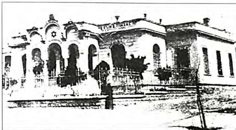
Το Θεραπευτήριο «Πίνκας».

κατά την πυρκαγιά που ξέσπασε στη Θεσσαλονίκη κατά τον Αύγουστο 1917 και κατά τα γεγονότα που ακολούθησαν το τέλος του πρώτου παγκόσμιου πολέμου και για τη χώρα μας τη μιζρασιατική εκστρατεία και καταστροφή. Κατά κύριους χρονολογικούς σταθμούς τα πληθυσμιακά μεγέθη της Εβραϊκής Κοινότητας της Θεσσαλονίκης κατά την περίοδο 1913 - 1923 και οι αυξομειώσεις τους είναι τα ακόλουθα: