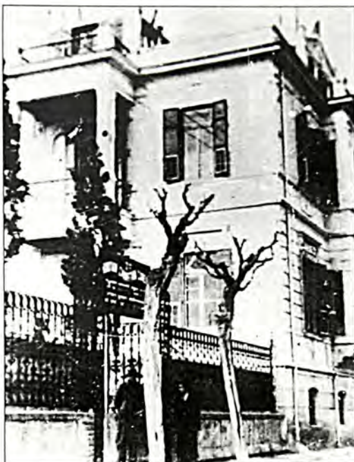
Η σχολή «Τισοφ Νισίμ» για την εκπαίδευση δασκάλων και ραββίνων.

5. Έτος 1923. Κατά το μέσο του 1923, σύμφωνα με επί-