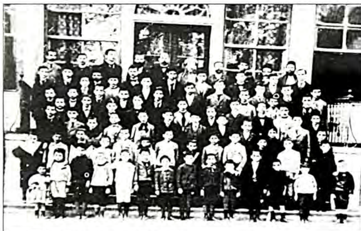
Οι μαθητές των σχολείων της Alliance.

Κατά τους στατιστικούς πίνακες και κατά την έκθεση Α. Λάμπρου: στην πόλη της Θεσσαλονίκης, κατά τα μέσα