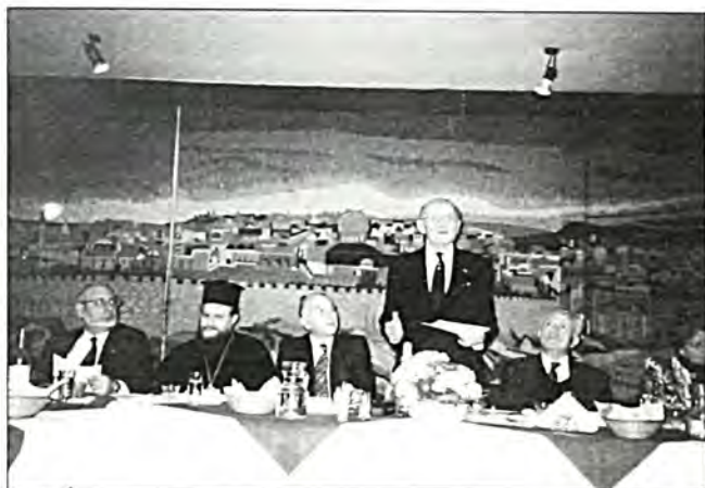
Από την πρόσφατη επίσκεψη του Sir S. Sternberg στην Ελλάδα, όπου συνεντεύχθηκε με το Κεντρικό Ισραηλινό Συμβούλιο Ελλάδος, το οποίο παρέχει γέφυρα σε προσωπικότητες του Χριστιανισμού και του Ιουδαϊσμού. Η φωτογραφία είναι από το γέφυρα.

Σ Ε ΕΠΙΣΗΜΗ ΤΕΛΕΤΗ που έγινε στο Ελληνικό Κέντρο του Λονδίνου, ο πρόεδρος της Ελλάδος στη Μεγάλη Βρετανία κ. Ηλίας Γούναρης επέδωσε εκ μέρους του Προέδρου της Ελληνικής Δημοκρατίας το παράσημο του Τάγματος της Τιμής στον Sir Sigmund Sternberg, πρόεδρο του Διεθνούς Συμβουλίου Χριστιανών και Εβραίων και ιδρυτή του Κέντρου Στέρνμπεργκ για τον Ιουδαϊσμό με έδρα το Λονδίνο. Ο κ. Στέρνμπεργκ, εξέχουσα προσωπικότητα της Εβραϊκής Κοινότητας του Λονδίνου, έλαβε την τιμητική διάκριση της Ελληνικής Πολιτείας σε αναγνώριση της πολυετούς προσφοράς του στην αλληλοκατανόηση και το διάλογο μεταξύ των διαφόρων θρησκειών σ' όλο τον κόσμο.