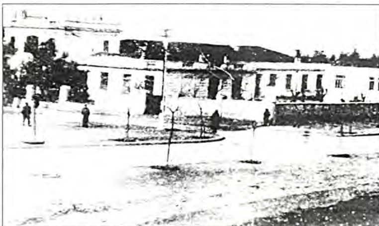
Το σχολείο «Καζές».

Όλες, επίσης, οι μαρτυρίες ελληνικές και ισραηλιτικές, συμπιπτουν στη διαπίστωση ότι ο μεγαλύτερος αριθμός αστέγων πυροπαθών αφορούσε, κατά κύριο λόγο, στους Εβραίους της Θεσσαλονίκης, οι οποίοι κατά κοινή ομολογία, επλήγησαν περισσότερο και σοβαρότερα από κάθε άλλο εθνικό στοιχείο της πόλης. Έτσι, κατά τις ίδιες μαρτυρίες από τις 70.000 - 75.000 αστέγους συνολικά πυροπαθείς της Θεσσαλονίκης, οι Εβραίοι άστεγοι πυροπαθείς της μακεδονικής πρωτεύουσας ανέρχονταν σε πάνω από 50.000 - 54.000 άτομα, ενώ όλοι οι υπόλοιποι ανέρχονταν σε 20.000 - 25.000 άτομα 18 . Αποτεφρώνοντας η πυρκαγιά το μεγαλύτερο μέρος του εμπορικού κέντρου της Θεσσαλονίκης «την καρδιάν της πόλεως, εξ ης απέρρεον όλαι αι αρτηρίαί πάσης ζωής αυτής» 19 , προκάλεσε ανυπολόγιστες απώλειες, καταστροφές και ζημιές μάλιστα στο εβραϊκό στοιχείο της πόλης, το οποίο από την εμποροοικονομική άποψη ήταν το κυρίαρχο του εμπορίου και της αγοράς της Θεσσαλονίκης αφού η πόλη, κατά μαρτυρία της επο-