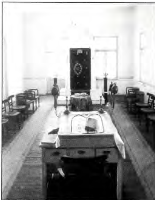
Εσωτερική άποψη της Συναγωγής Καβάλας.

Μετά λίγους μήνες καμιά σαρανταριά νέοι πιάστηκαν και στάλθηκαν στη Βουλγαρία σε στρατόπεδα εργασίας. Για την ιστορία, προτού πάρουν τους νέους στα έργα την 1η Σεπτεμβρίου 1941, ο