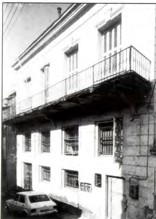
Εξωτερική άποψη της Συναγωγής Καβάλας.