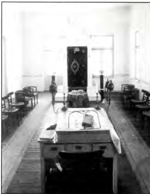
Εσωτερική άποψη της Συναγωγής Καβάλας.

Μετά λίγους μήνες καμιά σαρανταριά νέοι πιάστηκαν και στάλθηκαν στη Βουλγαρία σε στρατόπεδα εργασίας. Για την ιστορία, προτού πάρουν τους νέους στα έργα την 1η Σεπτεμβρίου 1941, ο