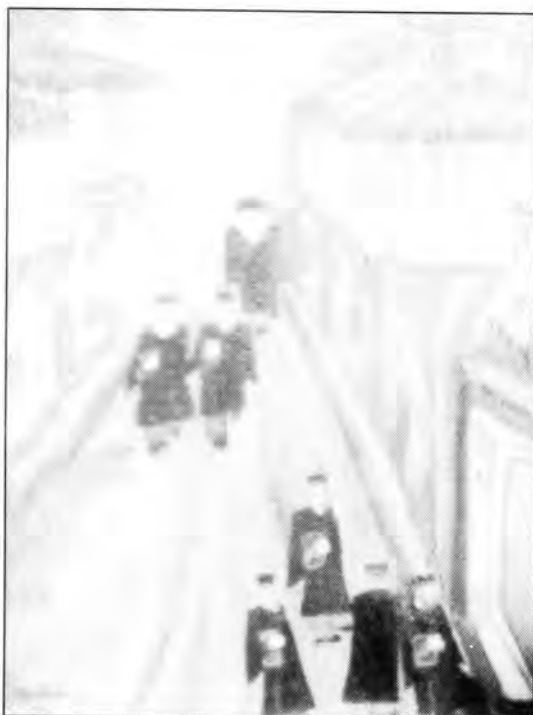
Πίνακας που απεικονίζει την οδό Σπάρτης της Θεσσαλονίκης, όπου βρισκόταν η Συναγωγή Καράσσο το 1930.