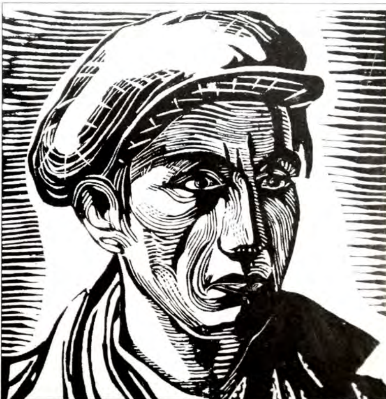
"Ανδρικό πορτρέτο". Ξυλογραφία Μωϋσή Ραφαήλ 1933.