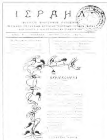
Το «Ισραήλ», ένα σιωνιστικό περιοδικό της Θεσσαλίας που έβγαινε επί πέντε χρόνια από τον Νοέμβριο του 1917. Εδώ το 7ο τεύχος (Μαΐου 1919)

Από το βιβλίο της κας Νίτσας Κολιού "Τυπο - φωτο - γραφικό πανόραμα του Βόλου", τόμος Α' (1991), παραλαμβάνουμε τα παρακάτω στοιχεία: