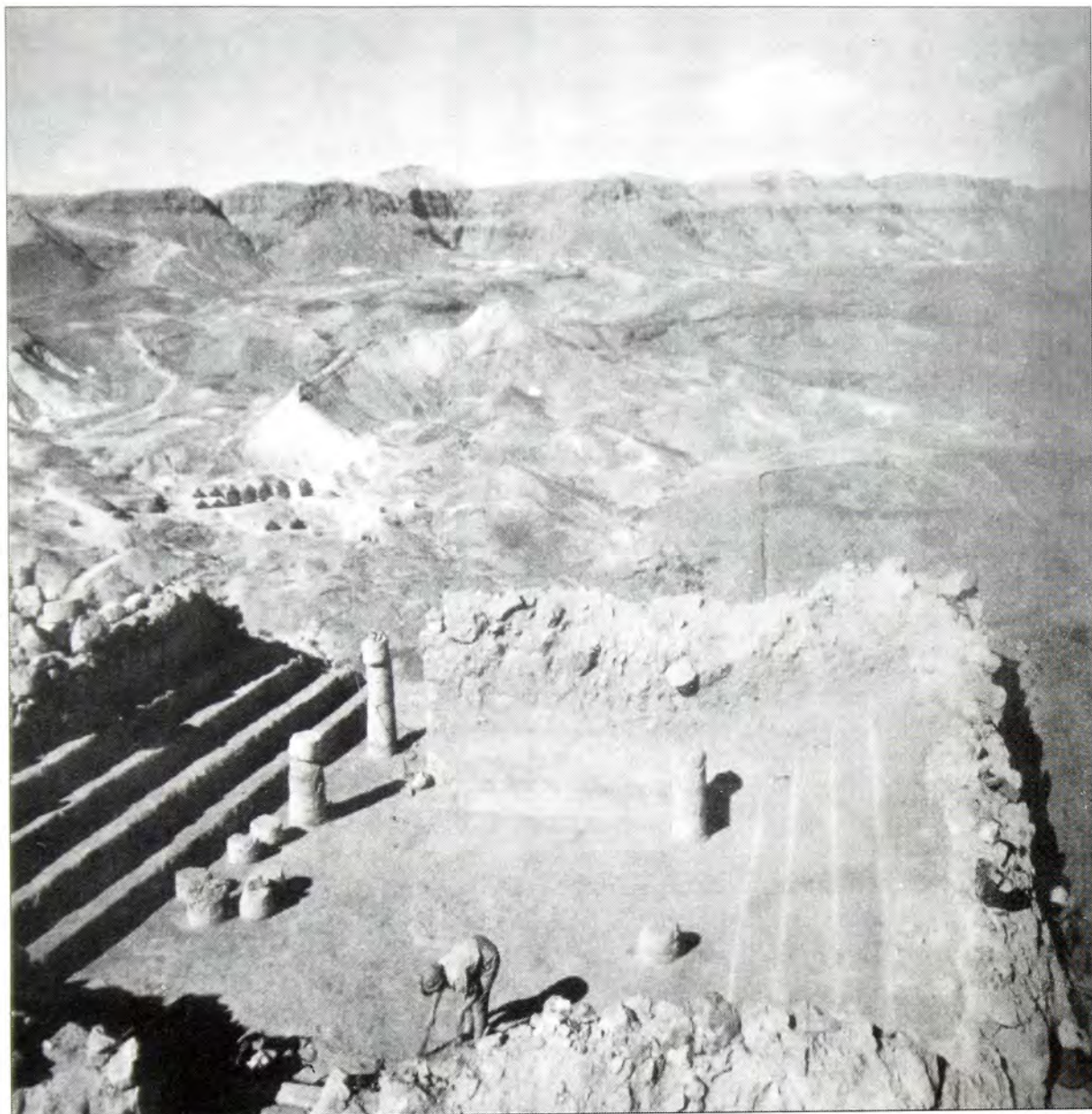
Συναγωγή που ληρέθηκε στη Μασσάντα ύστερα από ανασκαφές.