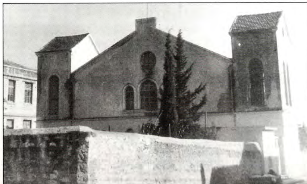
Εξωτερική άποψη της Συναγωγής Ξάνθης.

Έχει Αρμενικήν, Τουρκικήν και Ισραηλιτικήν κοινότητα, αξίαν λόγου βιομηχανοποίησιν σιγαρέττων και εργοστάσια κατεργασίας και επεξεργασίας καπνού, εννέα εν όλω ορθοδόξους εκκλησίας