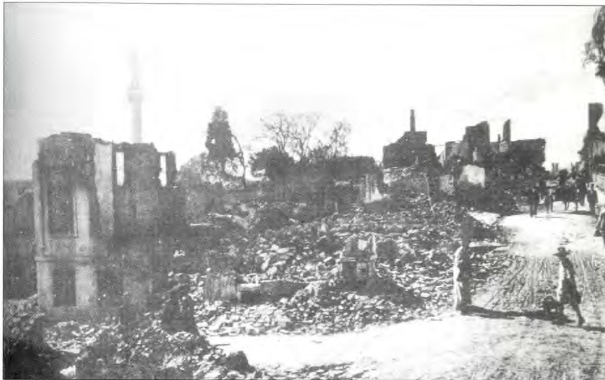
Εβραϊκή συνοικία μετά την πυρκαγιά του 1917

μαθητικά συσσίτια, η Τορά Ουμλαχά που υποστηρίζει οικονομικά τους άπορους σπουδαστές και μεριμνά για την επαγγελματική τους αποκατάσταση, τα ορφανοτροφεία Αλλατίνη και Αμποάβ, το άσυλο ψυχοπαθών Λιέτο Νοάχ, το νοσοκομείο Χιρς (το σημερινό Ιπποκράτειο), το υγειονομικό ίδρυμα Μπικούρ Χολίμ και αργότερα το γηροκομείο Σαούλ Μοδιάνο. Αναμορφώνεται ακόμα η εκπαίδευση με τον εκσυγχρονισμό των δεκάδων ενοριακών σχολείων και της παραδοσιακής σχολής Ταλμούδ Τορά και με την ίδρυση, το 1873 της σχολής της Alliance Israellite. Εβραϊόπουλα στοιχειοθετούν και την κύρια πελατεία των πολυαριθμών ξένων σχολείων. Η Κοινότητα θα δεχθεί το 1891 χιλιάδες πρόσφυγες θύματα των πογκρόμ στην τσαρική Ρωσία και θα τους στεγάσει μαζί με τα θύματα της πυρκαγιάς του 1890 (και αργότερα της πυρκαγιάς του 1917) στους νεοδημιουργημένους συνοικισμούς του βαρώνου Χιρς, της Καλαμαριάς, του 0151, του Ρεζή Βαρδάρ κ.λπ. Οι δύο πρώτοι συνοικισμοί αποτελούν και την πρώτη απόπειρα οργανωμένης δόμησης στη Θεσσαλονίκη. Εβραϊκή θα είναι και η "El Lunar" , η πρώτη εφημερίδα που θα κυκλοφορήσει στη Θεσσαλονίκη το 1865.