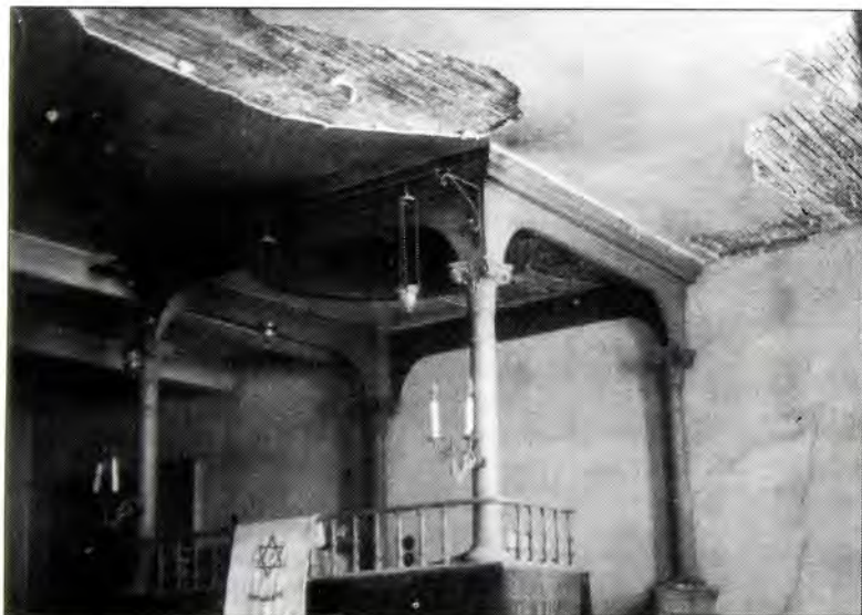
Η "τεβά" (χώρος της Συναγωγής απ' όπου αναγιγνώσκεται η Τορά) της Συναγωγής Πάτρας πριν από την κατεδάφιση.