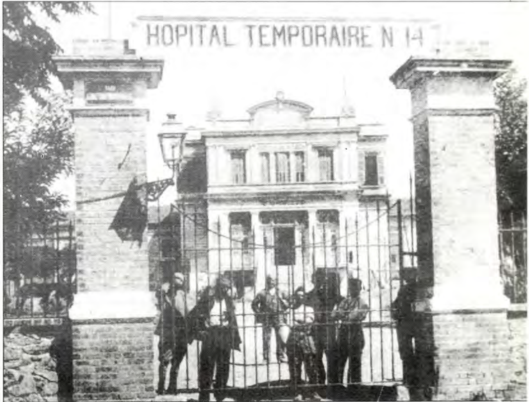
Νοσοκομείο του Αυστροεβραίου Βαρώου Χίρς και Μαιευτήριο Μπενουζίλιο (1907). Σήμερα στεγάζεται το Ιπποκράτειο νοσοκομείο.

Στις 6.2.43 φτάνει στη Θεσσαλονίκη μια επιτροπή των SD με επικεφαλής τους Ντύτερ Βισλιτσένι και Αλούς Μπρύνερ και βάζει σε κίνηση τον μηχανισμό για το οριστικό ξεκλήρισμα των Εβραίων, που υποχρεώνονται τώρα να φορούν το κίτρινο άστρο του Δαβίδ και να κατοικούν σε ορισμένες μόνο συνοικίες (γκέτο). Τους απαγορεύεται επίσης η χρήση τηλεφώνων και δημοσίων μεταφορικών