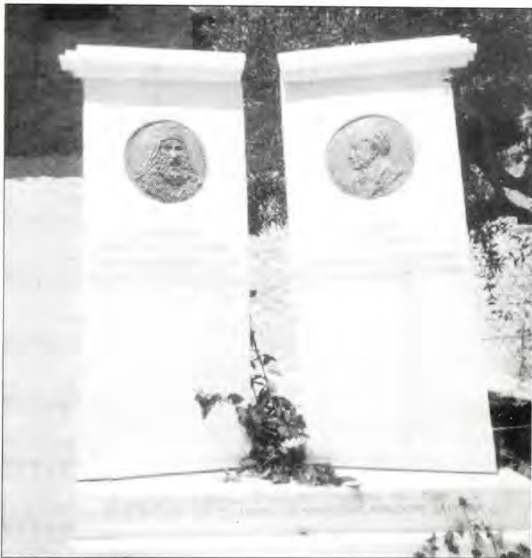
Άποψη του Μνημείου

Εμείς οι Εβραίοι οι καταγόμενοι από την Ζάκυνθο, όπου και αν ζούμε, θα θυμόμαστε την αγάπη και τη συμπαράσταση των Χριστιανών συμπατριωτών μας που μας έσωσαν από τη ναζιστική θηριωδία. Θα προσευχόμαστε όλοι οι λαοί και οι ηγέτες τους να ακολουθούν το φωτεινό τους παράδειγμα: ο άνθρωπος για τον άνθρωπο, ανεξάρτητα από φυλή και θρησκεία".