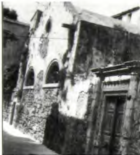
Η Συναγωγή των Χανίων σήμερα