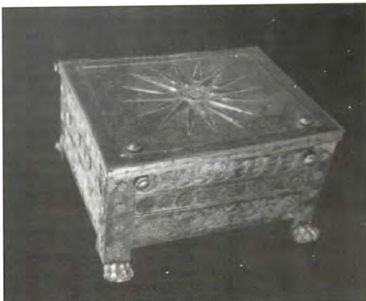
Χρυσή σαρκοφάγος. Βρέθηκε στον κεντρικό τάφο του Φιλίππου

Θα συγχωρήσωμεν βέβαια εις τον περιηγητήν ραββίνον μας την ιστορικήν του ανακρίβειαν ως προς τον αληθή ιδρυτήν της Θεσσαλονίκης και θα προσέξωμεν μόνον εις τα όσα σχετίζονται με το θέμα της ομιλίας μας. Διηγείται ούτος εν πρώτοις ότι από την Άρταν αρχίζει το βασίλειον του Μανουήλ, της χώρας των Ελλήνων. Αλλά κατά τον χρόνον τον οποίον ο Τουδέλας επέρασεν από την Άρταν και επεσκέφθη έπειτα την Θεσσαλονίκην, βασιλεύς του Βυζαντίου ήτο ο Μανουήλ ο Α' ο Κορμηνός, βασιλεύσας από το 1143 έως το 1180 μ.Χ. Εις το βασίλειον τούτο που είχε πρωτεύουσαν την Κωνσταντινούπολιν, υπήγето ως γνωστόν και ολόκληρος η Μα-