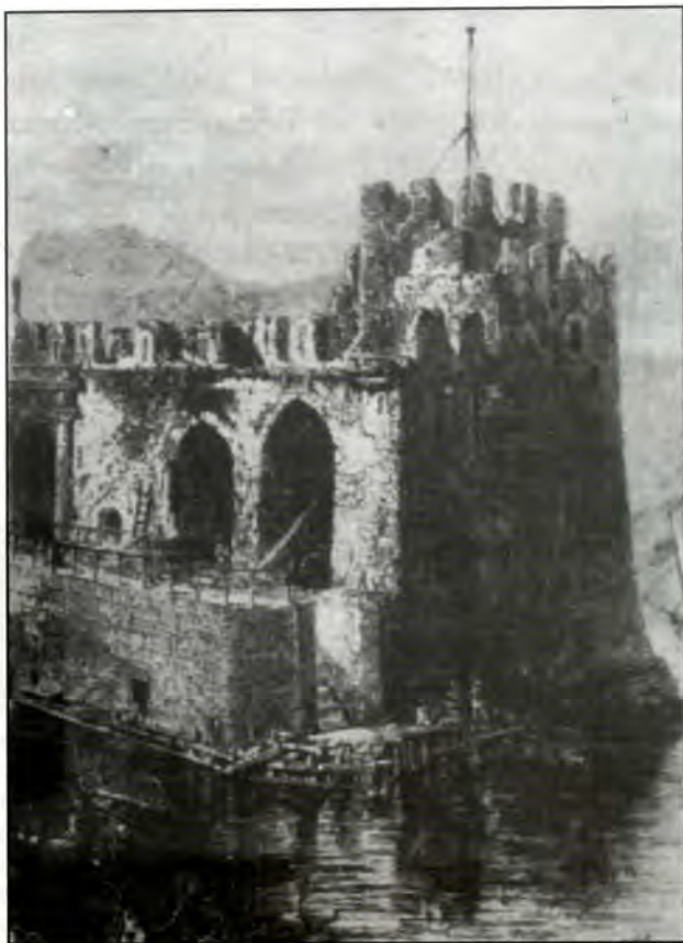
Βενετσάνικος Πύργος στη Χαλκίδα

Σε μια μεταγενέστερη φάση της, μια νέα εβραϊκή συνοικία δημιουργήθηκε (1355) μέσα στο Κάστρο (γκέττο), σε σπίτια που ανήκαν στη Δημοκρατία, την τοπική Εκκλησία ή σε ιδιώτες. Οι Εβραίοι κάτοικοι πλήρωναν στους δικαιοϋχους εκμισθωτές - ιδιοκτήτες ένα ετήσιο ενοίκιο από 600 συνολικά υπέρπυρα 2 , που σαν βυζαντινό νόμισμα διατηρούσε (όπως είδαμε και παραπάνω) την κυκλοφορία του στις καθημερινές συναλλαγές. Αλλά την ίδια χρονιά που ιδρύθηκε η νέα εβραϊκή συνοικία, καταστράφηκε από τα πυρά των Γενοβέζων και το όλο συγκρότημα χρειαζόταν ανακατασκευή. Υπήρχαν βέβαια και οι εβραϊκές συνοικίες της Καρύστου και των Ωρεών που οι Γενοβέζοι τις είχαν πυρπολήσει, για να εκδικηθούν μετά την καταστροφή που είχαν