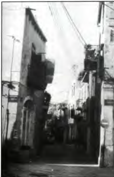
Η οδός Κονδυλάκη. Η κύρια αρτηρία που διασχίζει την "οβριακή", στα Χανιά.