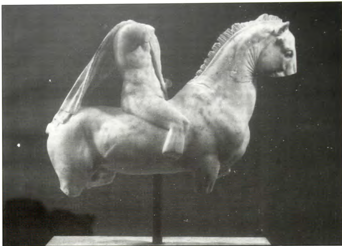
Αγαλμα νεαρού Μακεδόνα ιππέα.