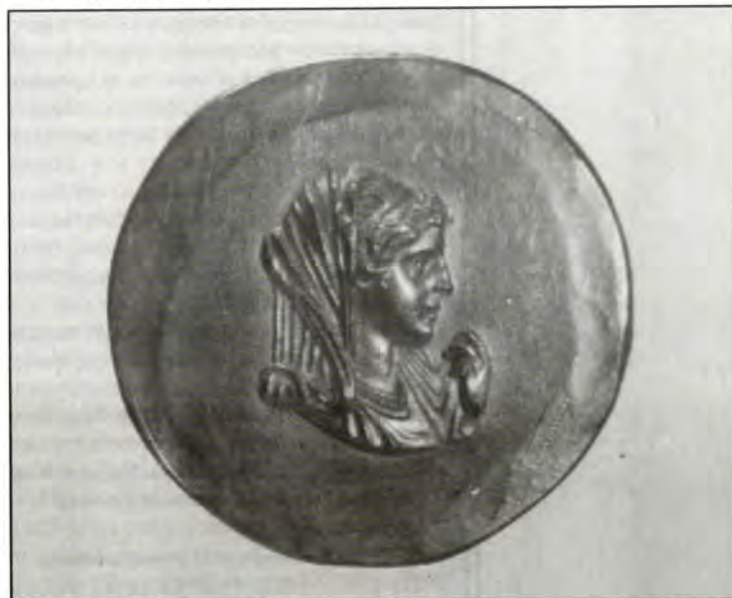
Παράσταση της Ολυμπιάδος, συζύγου του Φιλίππου του ΙΙ. Αρχ. Μουσείο Θεσσαλονίκης

κεδονία, την οποίαν συνεπώς ο Τουδέλας αναγνωρίζει ως ελληνικήν, αφού μας λέγει ότι από την Άρταν αρχίζει το βασίλειον του Μανουήλ, της χώρας των Ελλήνων. Την αναγνώρισιν αυτήν της Μακεδονίας ως χώρας ελληνικής επαναλαμβάνει ο ραββίνος Βενιαμίν, λέγων περαιτέρω, ότι την Θεσσαλονίκην ίδρυσεν ο Σέλευκος, εις των τεσσάρων βασιλέων της Ελλάδος οι οποίοι εβασίλευσαν μετά τον Αλέξανδρον, χαρακτηρίζων συνεπώς και αυτός τους Επιγόνους ως βασιλείς Έλληνας.