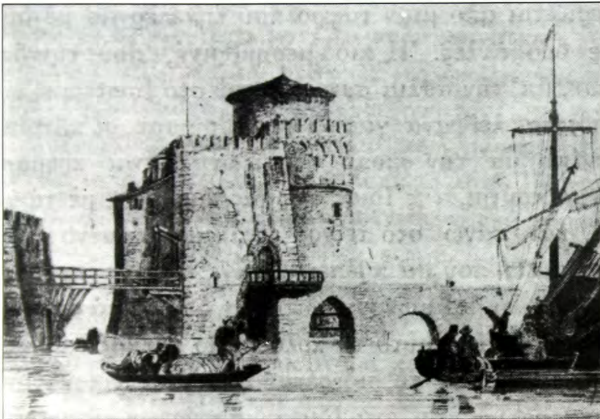
Η γέφυρα του Ευρίπου όπως την είδε ο Girard στα 1850 από το Βόρειο λιμάνι της Χαλκίδας. (Από παλιά χαλκογραφία της Τουρκοκρατίας)

σμου χωρίς απώτερες συνέπειες 7 . Συνεχίστηκε η φιλελεύθερη μεταχείριση των Εβραίων υπηκόων της Βενετίας εντός και εκτός του πατρίου εδάφους της και μάλιστα με την επικύρωση του Καρδινάλιου Βησσαρίωνα στα 1463, λίγο μετά την ανακηρυγή του ως τιτουλάριου Πατριάρχη Κωνσταντινουπόλεως. Ο Βησσαρίων ως απεσταλμένος του πάπα Πίου Β' στη Βενετία και εξέχων έλληνας ουμανιστής της εποχής του, δέχθηκε τότε τον Δόγη της Βενετίας Χριστόφορο Μάουρο, που του παρουσίασε μια "αίτηση" για το εβραϊκό ζήτημα. Ο Βησσαρίων αποτύπωσε την προσωπική του γνώμη (που δεν ήταν άλλο από μια επικύρωση της πολιτικής που ακολουθούσε ήδη η Βενετία επί διακόσια χρόνια) σ' ένα σημαντικό ντοκουμέντο γραμμένο στα λατινικά. Και ήταν αυτό μια διακήρυξη επαναστατική για την εποχή της, που άρχισε με αυτή τη φράση: "Judaeos inter Christianos habitare permittimus...", δηλαδή "Επιτρέπουμε στους Ιουδαίους να ζουν μεταξύ των Χριστιανών"... Ήδη 40 χρόνια πριν, όταν ο αυτοκράτορας της Κωνσταντινουπόλεως διέταξε να παραμείνουν εβραίοι Βενετοί πολίτες της Κωνσταντινουπόλεως υπό την εξουσία και δικαιοδοσία του, η βενετική Σύγκλητος διαμαρτυρήθηκε και διαφώνησε σ' αυτή τη διαταγή, διακηρύσσοντας ότι αυτοί οι Εβραίοι ήταν πολίτες δικοί της από το 1343 και αξιώνοντας να πάψει η κακμεταχείρισή τους από τα αυτοκρατορικά όργανα του Βυζαντίου 8 .