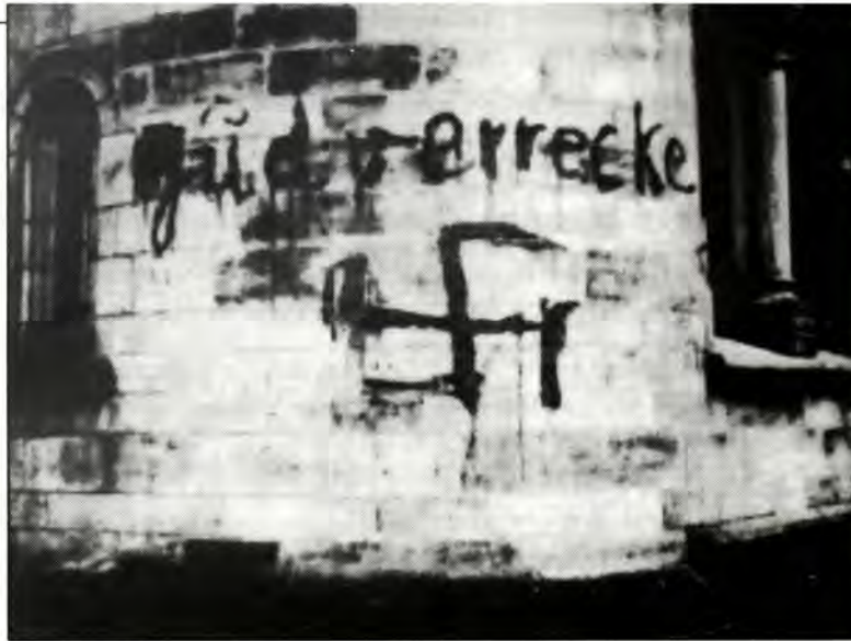
Αντισημικά συνθήματα και σβαστικά στον τοίχο της Συναγωγής στην πόλη Dusseldorf, το 1933