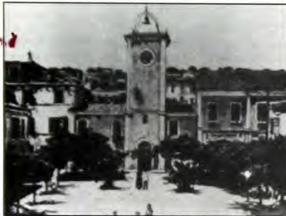
Ο Πύργος του Ρολογιού στο Αργοστόλι, όπως ήταν τον περασμένο αιώνα.

χηθής ότι υποφέρεις όσα έχεις δικαίωμα να μην υποφέρεις; αλλά δεν έχεις διόλου δικαίωμα να μην υποφέρεις να έχω οποιασδήποτε πεπειθήσεις περί θεότητας; Το καύχημα όθεν για την υποτιθεμένη ανεξιθρησκεία μας, μακράν από του να στέκει για καύχημα, δεν ήθελ' είναι παρά μια αξιογέλαστη ανοησία, και ήθελε δείχνει μόνον χονδροειδή ψυχρή και παχυλήν βαρβαρότητα.