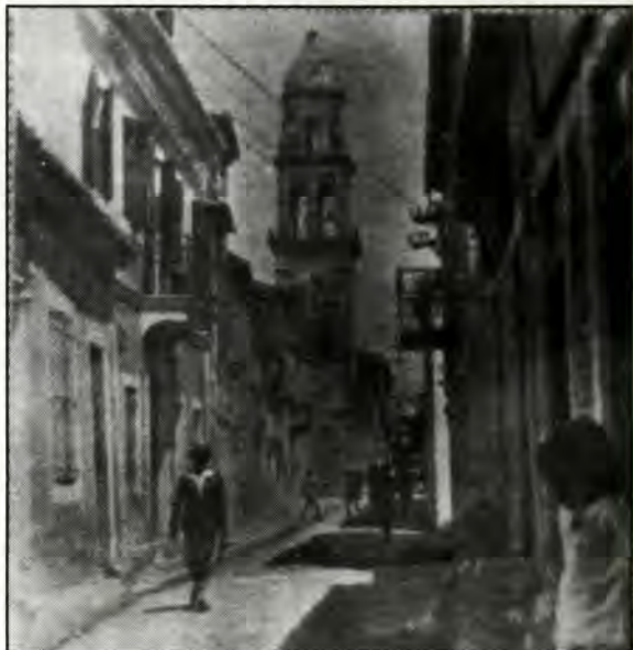
Αργστόλι: Το προσεισμικό λιθόστρωτο με το καμπαναριό του Αγίου Σπυρίδωνα. (Λαογραφικό Μουσείο Αργστολίου)

Πού το 'βρήκαμε, κύριε Λομπάρδε, το ανεξιθρησκον; Μήπως τόχετε σεις ευνού - πέρα τούτο το αραβικό Φοινικόπουλο; Αι, ήθελε το πιστέψω αν δεν ήθελε ζήσω στην Ζάκυθο, και δεν ήθελε ιδώ να πετάτε τους νεκρούς στα χωράφια μόνον γιατί εγεννήθηκαν Ισραηλίτες και στανικώς του να έγιναν· έπειτα χριστιανοί να ενωθήκανε σε νόμιμο γάμο με χριστιανούς κ' εζήσανε μίαν ολόκληρη χριστιανική ζωή, τιμιώτερη και θεαρεστότερη βέβαια από τη δική σου· ήθελε το πιστέψω, αν δεν ήθελε ιδώ το Μεγαλοβδόμαδο τους Ισραηλίτας να κλείονται στο Περίτειχμά τους, δια τον φόβον, όχι πλέον των Ιουδαίων