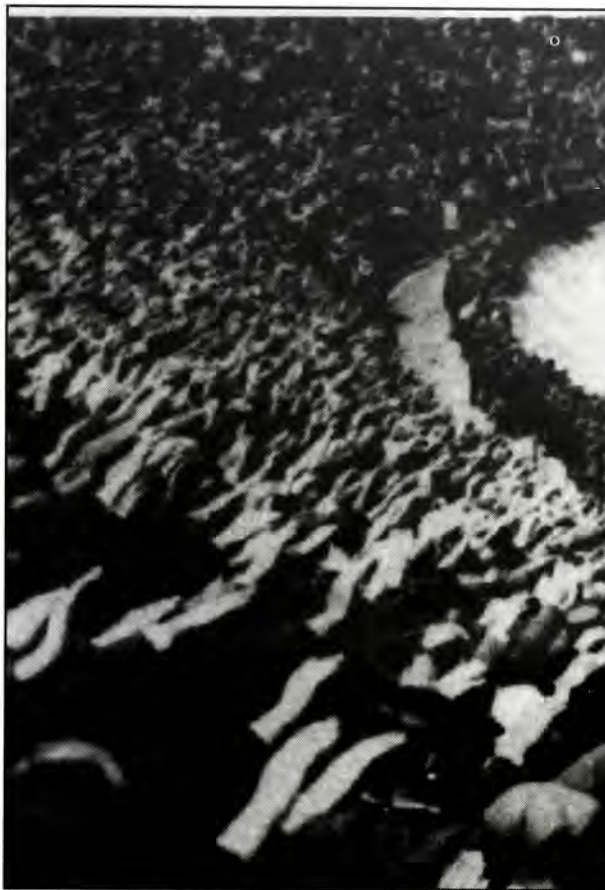
Συγκέντρωση Ναζί στο Στάδιο Grunewald του Βερολίνου το 1933

"Οι Εβραίοι", γράφει ο Nietzsche, "είναι ο πιο παράξενος λαός στην παγκόσμια ιστορία, γιατί μπροστά στο ερώτημα να ζουν ή να μη ζουν, αποφάσισαν να