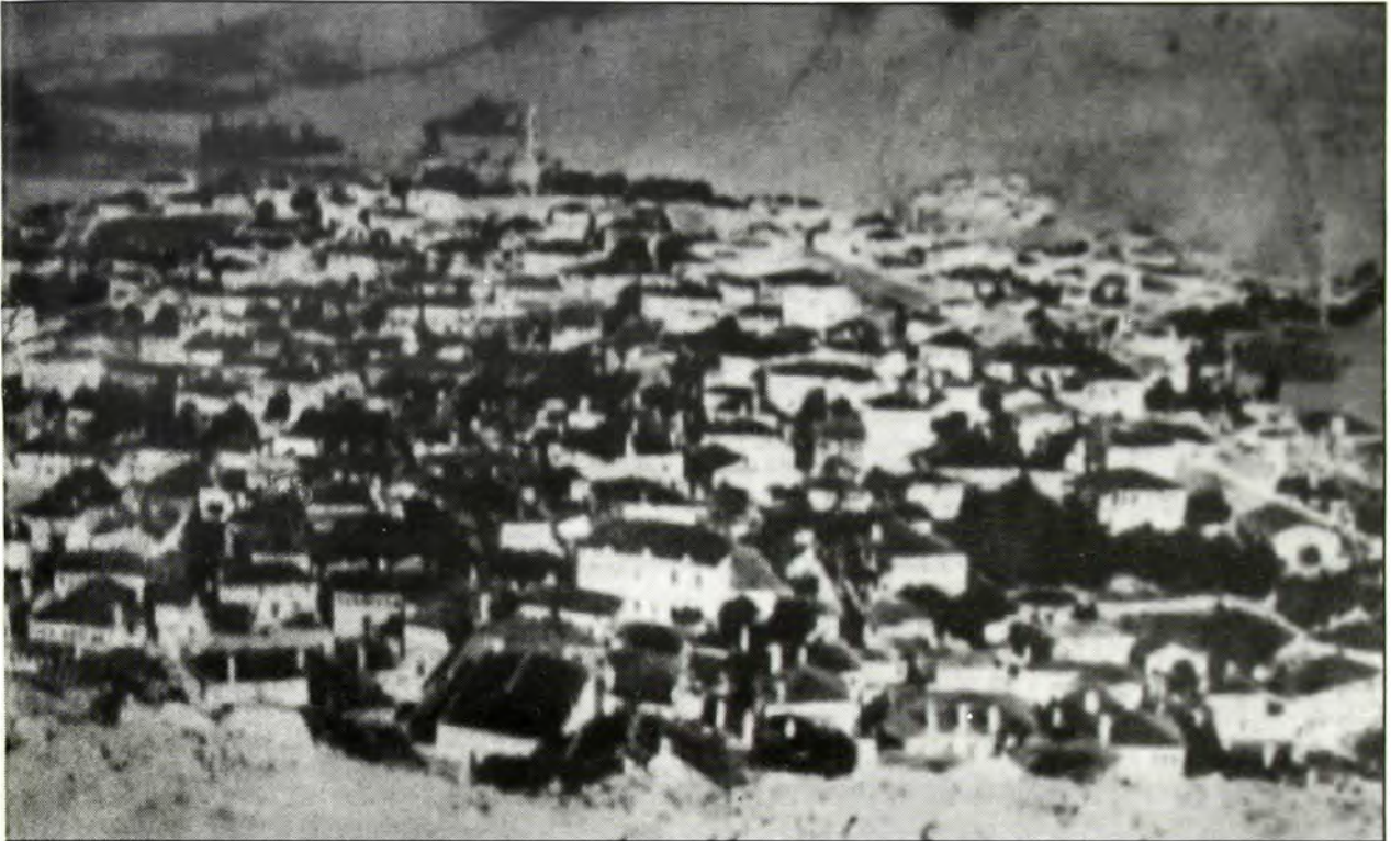
Καστοριά 1906: Αριστερά του κεντρικού Τζαμιού ο Εβραϊκός μαχαλές με τους 2000 κατοίκους