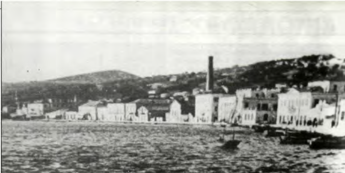
Η παραλία του Αργοστολίου, όταν κτίστηκε ο ηλεκτρικός σταθμός του οποίου διακρίνεται η καμινάδα