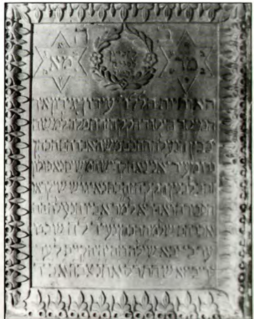
Αναμνηστική πλάκα από τη Συναγωγή Πρεβέζης. Μαζί με την πλάκα της εικόνας του εξωφύλλου φυλάσσεται στο Εβραϊκό Μουσείο Ελλάδας.

"Εξάλλου μέχρι και την απελευθέρωση (η Πρέβεζα) με τους ιδίους οικονομικούς πόρους και με επιπλέον αυτούς που προήλθαν από την ανάπτυξη του λιμανιού δεν ξεπέρασε ποτέ τις 6.000 (το έτος 1900, Χριστιανοί 3.700, 1.300 Τούρκοι και 300 Εβραίοι και Ιταλοί, σύνολο 5.700)".