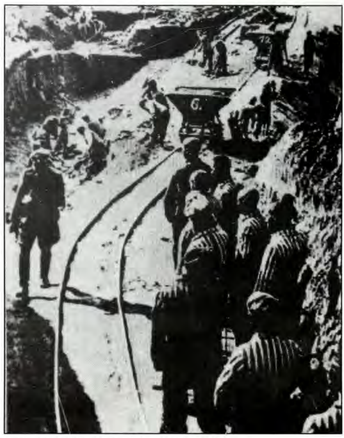
Καταναγκαστικά έργα σε ναζιστικό στρατόπεδο

Θάλαμοι αερίων και κρεματόρια, ιδού το κύριο στοιχείον των τρομακτικών αυτών εργοστασίων του θανάτου, όπου ο Γερμανός εξόντωνε τον εβραϊκό λαό. Σε θαλάμους αερίων και στα κρεματόρια του Μπιρκενάου