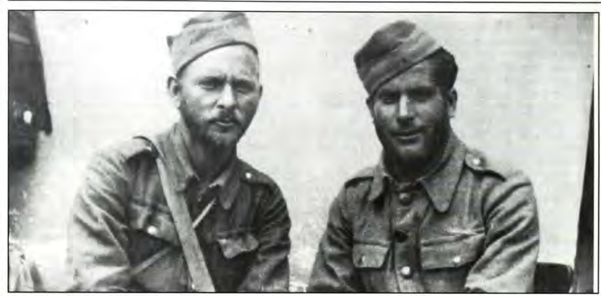
8.4.41: ...αφιχθείς εξ Αλβανίας εις Θεσσαλονίκην

νάδελφος του 'Αντολφ 'Αιχμαν, για συνομιλίες με τον Μπέλεφ. Στις 22 Φεβρουαρίου συνήψαν συμφωνία "για την εκτόπιση των πρώτων 20.000 Εβραίων από τα νέα βουλγαρικά εδάφη της Θράκης και Μακεδονίας στις ανατολικές περιοχές της Γερμανίας". 'Ολα έδειχναν ότι οι Εβραίοι της Μακεδονίας και της Θράκης έπρεπε να θυσιασθούν χάρη των Εβραίων της Βουλγαρίας.