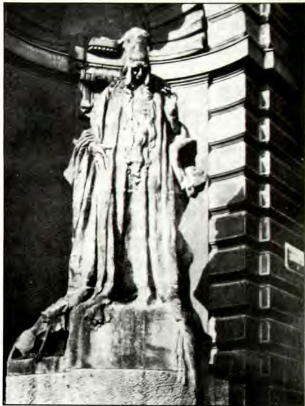
Ἀνδριάντας τοῦ Ραββίνου Γεουντά Λόουκ, γνωστού μέ τήν ἁκρωνυμία «Μασράλη», (π. 1525 - 1609), περίφημου ταλμουδιστή καί μαθηματικού. Τό μνημεῖο, ἔργο τοῦ Λαντισλάβ Σαλουν, 1917, βρίσκεται στήν εἴσοδο τοῦ Δημαρχείου τῆς Πράγας.

Ἡ περί Θεοῦ ἀντίληψη τῶν Ραββίνων εἶναι μονοθεϊστική ὑπό τήν αὐστηρότερη σημασία τοῦ ὅρου. «Αὐτός ἐδημιούργησε στήν ἀρχή ἕναν μόνον ἄνθρωπο, ὥστε οἱ αἰρετικοί νά μήν ἰσχυρισθοῦν πῶς ὑπάρχουν πολλές δυνάμεις στόν οὐρανό 14 . Διότι ἂν στήν ἀρχή ἐδημιουργοῦντο περισσότερα ἀνθρώπινα ὄντα, θά ἦταν δυνατό νά ὑποστηριχθεῖ ὅτι ὁρισμένοι ἐποιήθησαν ὑπό τοῦ Θεοῦ, οἱ δέ ἄλλοι ἀπό ἄλλες θεότητες» 15 . Αὐτή ἡ σκέψη ἀπηχεῖ καί τό ἐδάφιο τῆς Βίβλου: «Ἐγώ εἰμαι ὁ Κύριος ὁ