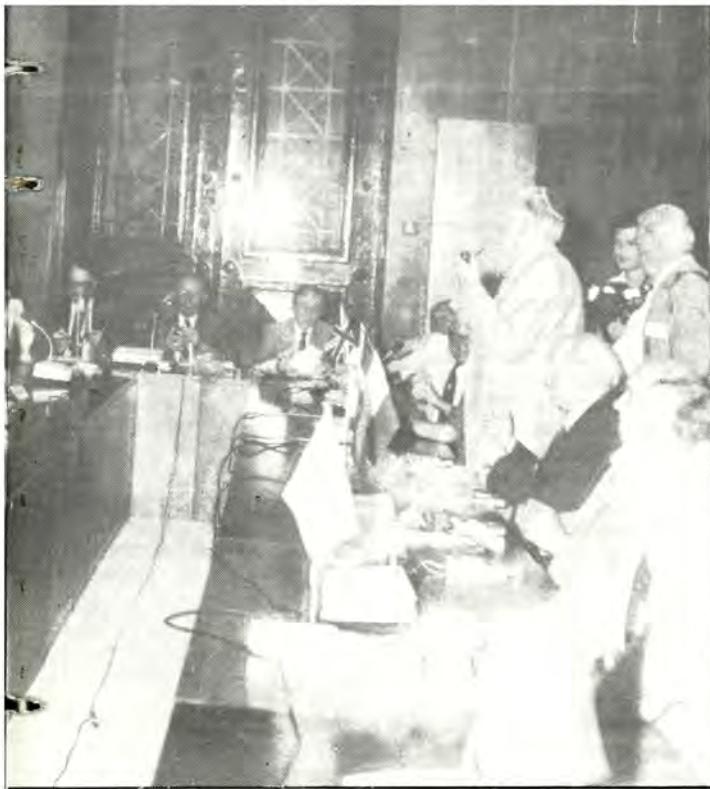
Υπουργός Δικαιοσύνης κ. Έλευθ. Βερυβάκης.