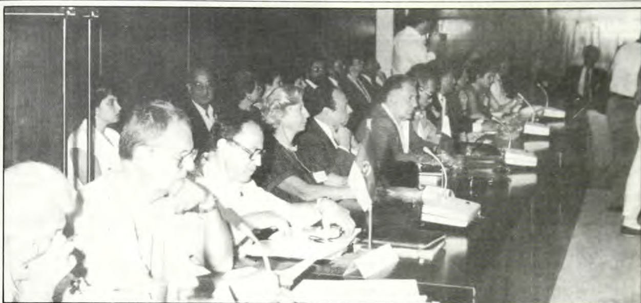
ΑΠΟΨΗ ΤΟΥ ΣΥΝΕΔΡΙΟΥ