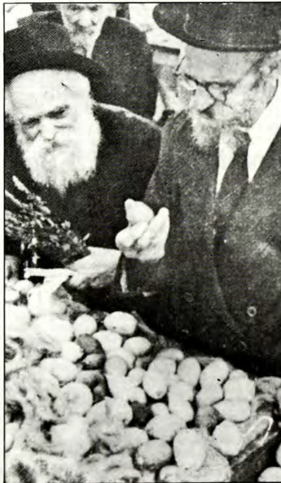
Χαρακτηριστική εἰκόνα τῆς Ἰσραηλινῆς ἀγοράς, παραμονή τοῦ Σουκότ.