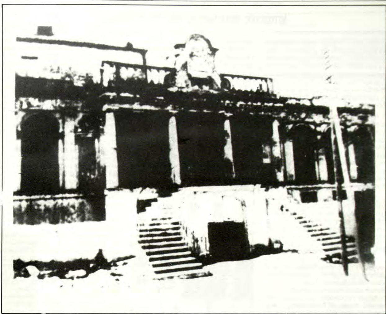
Τό οίκημα του Βενετσιάνου Βαίλου, όπως σώζονταν στις αρχές του αιώνα μας. Έδω συνεδρίαζε τὸ Προσωρινό Δημαρχεῖο τῆς Κέρκυρας. Τό κτίριο κατεδαφίστηκε πρὶν 60 περίπου χρόνια καί στή θέση του ὑψώθηκε τὸ συγκρότημα τοῦ Β' καί τοῦ Γ' Δημοτικού Σχολείου.