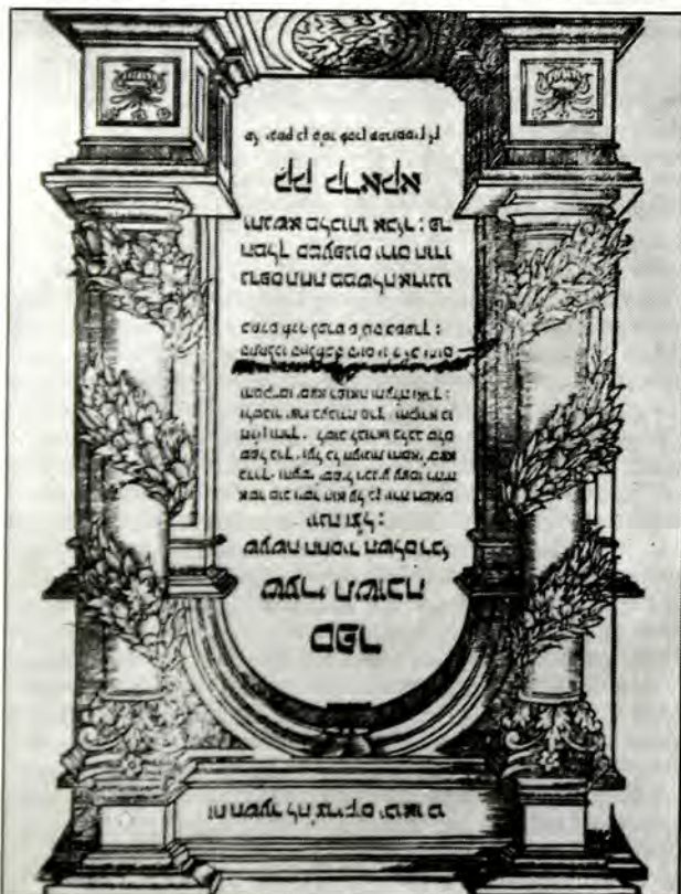
Ἐξώφυλλο τῆς ἠθικολογικῆς πραγματείας «Σααρέ Τεσονβά», τοῦ Ραββίνου Γιονά Τζερόντι (π. 1200 - 1263). Κρακοβία, 1595.

Ἀνεξάρτητα ἀπό τήν ὁποιαδήποτε ἐρμηνεία τῶν παραπάνω κειμένων, εἶναι ἀδύνατο νά δεχθούμε ὅτι οἱ συντάκτες τους πίστευαν εἰς ἓνα ἐνσώματο Θεό, ὁ ὁποῖος ὄντως ἐξετέλεσε τίς πράξεις πού ἀποδίδονται εἰς Αὐτόν.