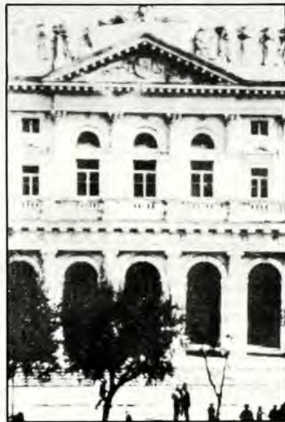
Τό Δημοτικό Θέατρο τής Κέρκυρας.

Ο λόγιος Άρντ αναφέρει στον στρατηγό Βοναπάρτη ότι είχε βρει κλεισμένους στο Φρούριο τους Εβραίους, που ήταν μέλη του Δημαρχείου. Γαντζώθηκαν επάνω του και τόν άκολούθησαν «περισσότερο πε-