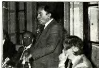
Ὁ Ἐπιτροπὸς τῆς ΕΟΚ κ. Cl. Cheysson κατὰ τὴν ὁμιλία του.

νεύρει τὸν πρότερο χαρακτήρα τῆς, ὡς χώρος συναντήσεως, ἀλληλογνωριμίας καὶ ἀλληλοκατανοήσεως μεταξύ ὅλων τῶν λαῶν καὶ ὅλων τῶν πολιτιστικῶν παραδόσεων.