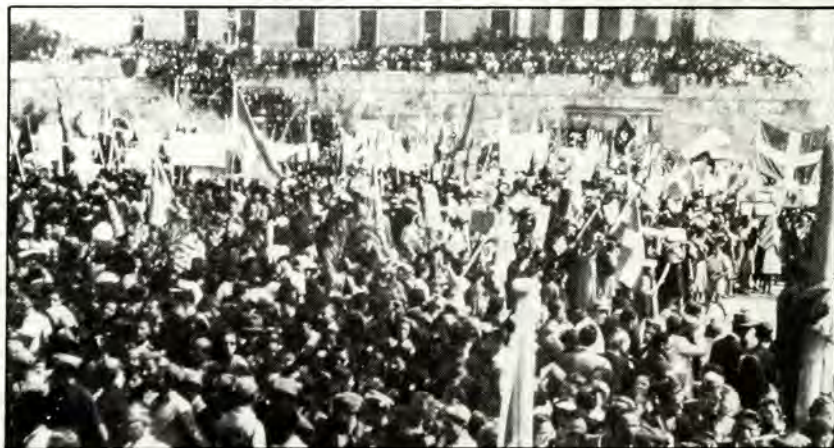
Άπό τήν άπελευθέρωση της 'Αθήνας 18.10.1944