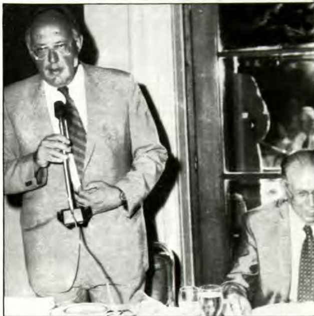
Ο Υπουργός - αναπληρωτής Έξωτερικών κ. Θ. Πάγκαλος ἀπευθύνει χαιρετισμό στο γεύμα προς τιμήν του κ. Cheysson.

Τό Συνέδριο, στό τέλος τών έργασιών του, εξέδωσε τήν παρακάτω διακήρυξη: