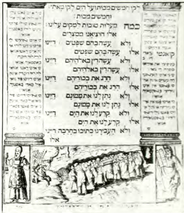
Σελίδα ἀπὸ τὴν Ἀγκαδα Βενετίας (1609), ὅπου ἀπεικονίζονται οἱ ἐξερχόμενοι ἀπὸ τὴν Αἴγυπτο Ἰσραηλίτες, μεταφέροντες καὶ τὰ ὅσια τοῦ Ἰωσηφ.

«Κάποιος αἰρετικὸς εἶπε στὸν Ραββὴν Γκαμιέλ: Σεῖς οἱ Ραββῖνοι διακηρύσσετε ὅτι ὅπου συνέρχονται δέκα 47 άτομα γιὰ νά προσευχηθοῦν, ἐκεῖ ἐνυπάρχει ἡ Σεχινά · τότε, ὅμως, πόσες Σεχινὸς ὑπάρχουν; Ὁ Ραββῖνος φώναξε τὸν ὑπηρέτη τοῦ αἰρετικοῦ καὶ τὸν κτύπησε μέ μιὰ κουτάλα. «Γιατί τὸν κτύπησες», ρώτησε ὁ τελευταῖος καὶ ὁ Ραββῖνος ἀπάντησε: «Ἐπειδὴ ὁ ἥλιος ὑπάρχει στὴν οἰκία ἐνός ἀπίστου». «Ὅμως ὁ ἥλιος λάμπει σ' ὅλο τὸν κόσμο», ἀντίτεινε ὁ αἰρετικὸς καὶ ὁ ραββῖνος ἀνταπάντη-