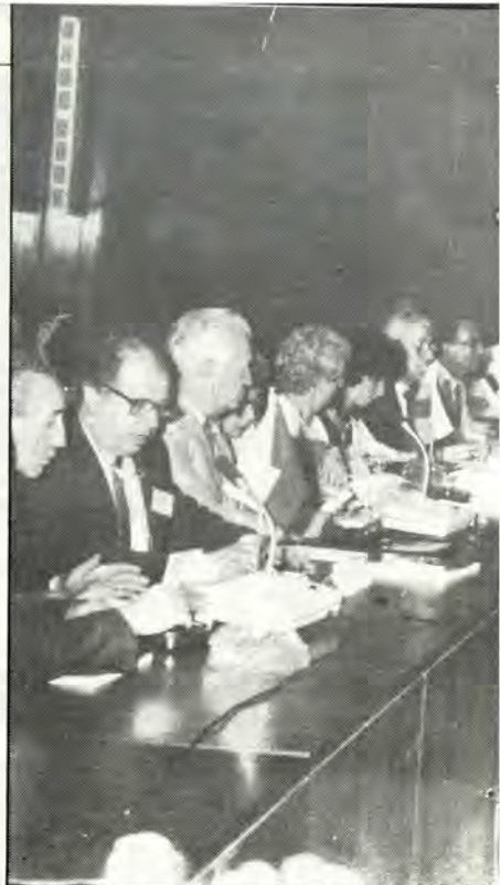
Ἀπὸ τίς ἐργασίες τῆς Συνόδου. Διακρίνεται ὁ τότε

Οἱ εἰσηγητὲς ἐπεσήμαναν ἐπίσης, ὅτι παρατηροῦνται ἐντονες ἀλληλεπιδράσεις καὶ προσμίξεις ἰδεῶν μεταξύ αὐτῶν τῶν πολιτιστικῶν ρευμάτων. Σήμερα, δυστυχῶς, ἡ Μεσόγειος ἀντὶ νὰ ἐνώνει, ἀποτελεῖ χωρὸ πού διαιρεῖ καὶ διαφοροποιεῖ τοὺς λαούς, ἐξαιτίας ἐντόνων διαμαχῶν. Γι' αὐτὸ ἡ Μεσόγειος πρέπει νὰ ἐπα-