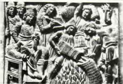
Γλυπτό σχεδιαγράμα που απεικονίζει την παρουσίαση του Βενιαμίν ενώπιον του Ἰωσήφ.