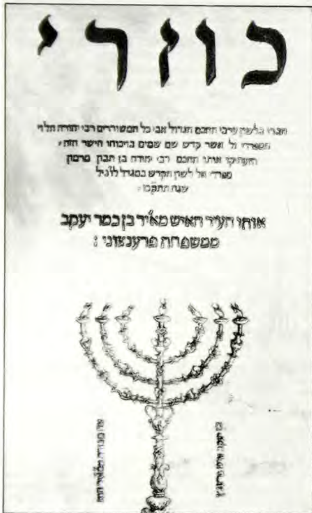
Ἐξώφυλλο τοῦ βιβλίου «Κουζαρί», ἔργο τοῦ περιφημοῦ φιλόσοφου καὶ ποιητῆ Ραββί Γεουντὰ Ἀλεβή, 12ος αἰώνας. Ἡ Μενορά ἀποτελεῖ τὸ ἐκδοτικὸ σύμβολο τοῦ Μειρ Παρένζο, Βενετία 1547.

ναὶ ὁ θεὸς μου, «ἔφυγε ἀπ' ἔμπροσθεν αὐτοῦ»! 51 . Ὁ Ραββίνος ἀπάντησε: «ὅταν ὁ Θεὸς μας ἀποκαλύφθηκε στὸν Μωυσῆ μέσα ἀπὸ τὴ βάτο, δὲν ὑπῆρχε τόπος ὅπου θὰ μπορούσε νὰ διαφύγει ἀφοῦ Αὐτός βρίσκεται παντοῦ. Σέ ὅ,τι ἀφορᾷ, ὅμως, τὸ φίδι πού εἶναι θεὸς σου, δὲν χρειάζεται παρὰ ἓνας νὰ ὀπισθοχωρήσει δύο ἢ τρία βήματα γιὰ νὰ ξεφύγει „ἰι“ αὐτό!» 52 .