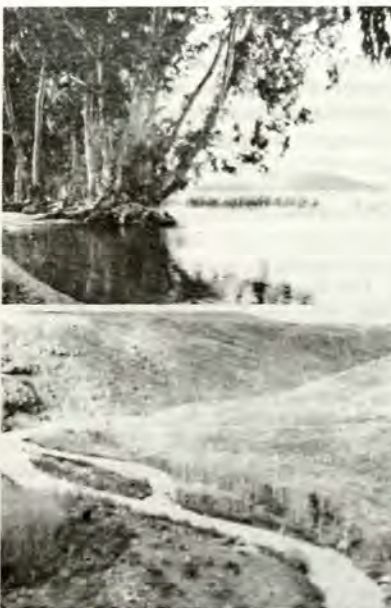
— Φυτὰ ἀπὸ τό Σινᾶ

το ἐξιστορεῖ, ὅτι οὗτοι λόγῳ τῶν κατὰ τὴν περιπλάνησίν των στερήσεων ἐγόγγυζον κατὰ τοῦ Μωϋσέως καί τοῦ Ἀαρών, «ἐκλαίων... καί εἶπαν· τίς ἡμᾶς ψωμίει κρέα; ἐμνήσθημεν τοὺς ἰχθύας, οὓς ἡσθίομεν ἐν Αἰγύπτῳ δουρεάν, καί τοὺς σικύους καί τοὺς πέπονας καί τὰ πράσα καί τὰ κρόμμυα καί τὰ σκόρδα» (ΙΑ' 4, 5). Θεωροῦμεν σκόπιμον ν' ἀναφέρωμεν ἐνταῦθα καί τό ὄξος, τό προϊόν τοῦτο τοῦ γεννήματος τῆς ἀμπέλου, καίτοι δέν πα-