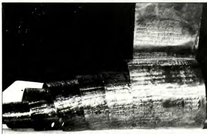
Κυλινδρος από λεπτό φύλλο χαλκού με χαραγμένα όλα τα ονόματα των 235 Λαρισαίων Έβραίων θυμάτων του ναζισμού που έναποτέθηκε εντός κρύπτης στη βάση του μνημείου ΕΒΡΑΙΩΝ ΜΑΡΤΥΡΩΝ ΚΑΤΟΧΗΣ στη Λάρισα κατά την τελετή των αποκαλυπτηρίων του Μνημείου την 5.4.87.

Σ έ ατμόσφαιρα βαθύτατης συγκίνησης και μεγάλου έκφρασμού ανθρωπιάς πραγματοποιήθηκαν την Κυριακή 5 ‘Απριλίου σέ σεμνή τελετή — μέ τήν παρουσία πλήθους Λαρισαίων — τά αποκαλυπτήρια του μνημείου των ‘Εβραίων θυμάτων των ναζί, στήν ομώνυμη πλατεία πού δημιουργήθηκε πρόσφατα, στή Λάρισα στή συμβολή των οδών Κύπρου - ‘Ανθίμου Γαζή και Κενταύρων.