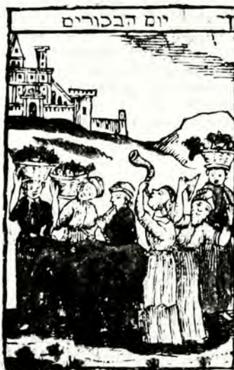
Προσφορὰ πρωτογεννημάτων στό Ναό. Ξυλογραφία ἀπὸ τό χειρόγραφο Sefirat ha Omer. (Γερμανία 1800).

Τό βιβλίον Παραλειπομένων Α', τό ὁποῖον συνεγράφη κατὰ πολλοὺς μὲν περὶ τό 450 π.Χ., κατὰ τινὰς δὲ περὶ τό 300 π.Χ. ἀναφέρει, ὅτι τινὲς ἐκ τῶν Λευϊτῶν εἶχον ἀναλάβει τὴν ἐπιβλεψὴν ἐντὸς τοῦ ναοῦ καὶ «τοῦ λίβανωτοῦ καὶ τῶν ἀρωμάτων. Καὶ ἀπὸ τῶν υἱῶν τῶν ἱερέων ἦσαν μυρεψοὶ τοῦ μύρου καὶ εἰς τὰ ἀρώματα» (Θ' 29, 30).