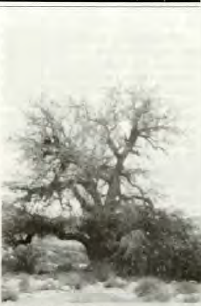
— Φυτὰ ἀπὸ τῆ Χαναάν

κυπρίζουσιν» (Β', 13), ἐνῶ τὸ ἱερόν κείμενον χρησιμοποιεῖ τὸ ρῆμα κυπρίζω ὑπὸ τὴν ἔννοιαν τοῦ ρήματος ἀνθῶ. Τὸ ρῆμα τοῦτο παράγεται ἐκ τῆς λέξεως κύπρος, προφανῶς λόγῳ τῆς ἀφθονοῦς ἀνθήσεως τοῦ ὑπὸ τὴν ὀνομασίαν ταύτην δένδρου. Νάρδος εἶναι τὸ ἄλλως Valeriana καλούμενον ποώδες φυτόν. Ἡ ὀνομασία σμύρνα ἀλῶθ ὑποδηλοῖ προφανῶς τὴν ρητίνην εἰδῶν τινῶν τοῦ πολυετοῦς φυτοῦ τῶν θερμῶν χωρῶν, ὅπερ καλεῖται ἀλόη. Ὡς γνωστόν, ὁ μανδραγόρας εἶναι ποώδες φυτόν τῆς οἰκογε-