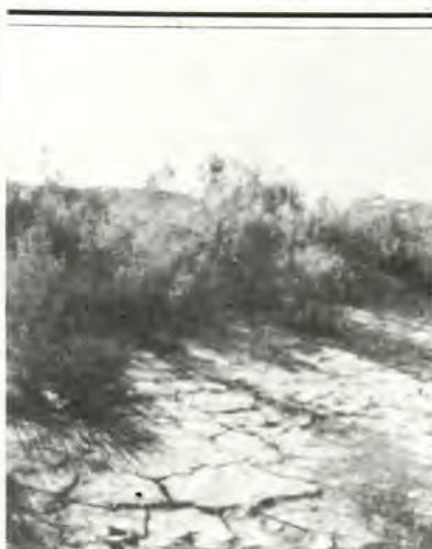
— Φυτὰ ἀπὸ τῆ Γῆ τῆς Βίβλου

Ἐμνηνεύεται τινες τὰς λέξεις κύπρον καὶ κυπρισμόν ἐρμηνεύουσιν ὡς ἀνθος τῆς ἀμπέλου προφανῶς παρασυρόμενοι ἐκ τῆς φράσεως: «αἱ ἀμπελοι