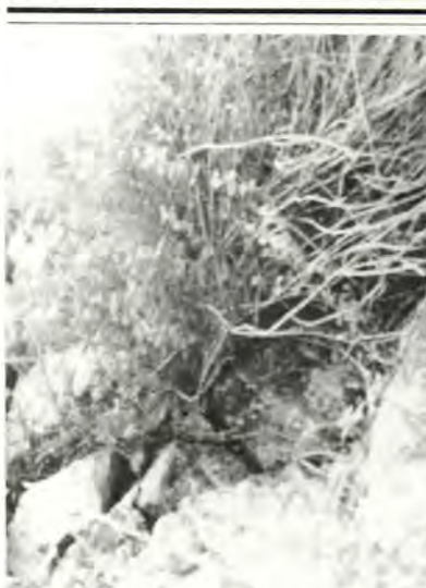
— Φυτὰ ἀπὸ τό Σινᾶ

Ἐν Γερμανίᾳ καί Ὀλλανδίᾳ τό φυτόν τοῦτο χρησιμοποιεῖται εἰς τὴν ἀρτοποιίαν καί πρὸς ἀρωμάτισιν τοῦ τυροῦ καί ἐν Ἀνατολῇ πρὸς ἀρτυσιν ἐδεσμάτων τινῶν. Ἐπὶ πλέον οἱ ἀρχαίοι Ἰσραηλίται ἠρέσκοντο καὶ εἰς τὰ πράσα, τὰ κρόμμυα καί τὰ σκόρδα 5 , ὡς προκύπτει ἐκ τοῦ τετάρτου βιβλίου τῆς Πεντατεύχου «Ἀριθμοί». Συγκεκριμένως τό βιβλίον τοῦ