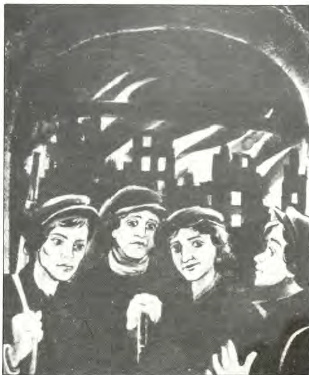
«Κορίτσια του Γκέττο της Βαρσοβίας», πίνακας του Mark Zhitniski.

Ε δω νομίζω ότι πρέπει νά διευκρινίσουμε κάτι, τουλάχιστον σέ ότι άφορά ειδικά τήν Εύρώπη, και αυτό είναι ότι δεν θεωρούμε τίς έπικρίσεις εναντίον του ‘Ισραήλ σάν αντισημιτισμό. ‘Όσο νόμιμο είναι νά εναντιώνεται κανείς σέ όρισμένες πολιτικές πράξεις, άποφάσεις, ενέργειες και τάσεις στό ‘Ισραήλ, τόσο είναι νά κάνει κανείς τό ίδιο γιά άλλα έθνη του κόσμου. ‘Εγώ, προσωπικά, είμαι εναντίον τής πολιτικής των μαζικών οικισμών στό Δυτική ‘Οχθη, όπως έκατοντάδες ‘Ισραηλινοί. ‘Ενοχλήθηκα πολύ μέ τόν τρόπο πού ή κυβέρνηση Μπέγκιν - Σαρόν διεξήγαγε τόν πόλεμο στόν Λίβανο. Οί περισσότεροι άπό τούς φίλους μου σ’ αυτή τή χώρα άνήκουν στό δημοκρατική αντιπολίτευση. ‘Όμως υπάρχει ένα όριο. ‘Όριο πέραν του οποίου, οί άντι - ισραηλινές δηλώσεις ένθαρρύνουν τόν αντισημιτισμό. Στίς ΗΠΑ π.χ. ό λαός μιλά εναντίον του προέδρου, αλλά δεν άμφισβητεί ποτέ τό δικαίωμα των ΗΠΑ νά υπάρχουν ή νά άμύνονται. Κάποτε στό Σουηδία, είχα αναλάβει μία έκστρατεία μέ τό κόμμα μου εναντίον τής τότε σοσιευδικής κυβερνήσεως. Οί εκλογές πού άκολούθησαν οδήγησαν σέ άλλαγή εξουσίας. Ούτε πρós στιγμήν δεν σκέφθηκα νά άμφισβητήσω τό δικαίωμα υπάρξεως τής Σουηδίας. ‘Αλλά οί άντι - Σιωνιστές, όχι μόνο αντιτίθενται σέ άποφάσεις μιάς συγκεκριμένης ισραηλινής κυβερνήσεως, αλλά έρμηνεύουν άμέσως αυτές τίς άποφάσεις σάν μία άπόδειξη ότι τό