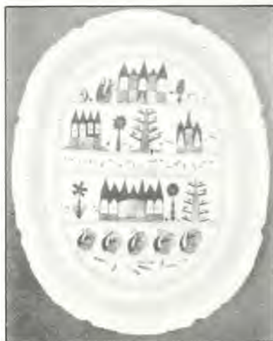
«Εἰρηνικὸ χωριό», (Κεραμεικὸ, τοῦ Scottie Wilson, 1963).

Καί, ἐντούτοις, κατὰ τὴν λιτανεία τῆς κάρας τοῦ ἀργότερα στὰ Γιάννενα, ποὺ ὁργάνωσε ἐπισημότατα ὁ Ἀλῆ πασὰς μὲ τὴν κυρὰ Βασιλική του, Χριστιανοί, Μουσουλμάνοι καὶ Ἑβραῖοι, προσεύχονται, ὅλοι στὸ πέρασμα τῆς κάρας, χριστιανικά, «καθὼς προσευχόταν ὁ καλόγερος Κοσμὰς» (Κ. Σαρδελῆς). Καὶ ἔτσι «τὸ κόκκαλο τῆς κάρας ἐνός Χριστιανοῦ διδόχου ἐνώνει γιὰ πρώτη φορὰ στοὺς αἰῶνες τῶν αἰώνων, κάτωθι τοῦ ὀλάκερο τὸν κόσμο, Χριστιανούς, Ἑβραίους καὶ Μουσουλμάνους» (Κ. Σαρδελῆς). Ἀεῖζει, νομιζῶ, νὰ ἀναφέρουμε τὴν παρακάτω προφητεία τοῦ πατροκοσμὰ (βλέπετε ἔχουνε οἱ Ἑβραῖοι τοὺς προφήτες τους, ποὺ δὲν ἦταν τίποτ' ἄλλο παρὰ ἡγέτες πνευματικοῦ κινήματος, ἔχομε καὶ μεις τοὺς δικούς μας, ὅπως Αἰσχύλος, ὁ Πίνδαρος, ἰσως καὶ ἄλλοι, ποὺ ἀγνοῶ, καὶ τὸν Κοσμὰ τὸν Αἰτωλό): «Θὰ δεῖτε νὰ πετάνε ἀνθρώποι στὸν οὐρανὸν σὰν μαυροπούλια καὶ θὰ ρίχνουν φωτὶ στὸν κόσμον. Ὅσοι θὰ ζοῦν θὰ τρέξουν στὰ μνήματα καὶ θὰ φωνάζουν: ἐβγάτε σεις οἱ πεθαμένοι, νὰ μپοῦμε μεις οἱ ζωντανοί» (Κ. Σαρδελῆς). Ἀλλὰ γιὰ νὰ μὴ μείνε-