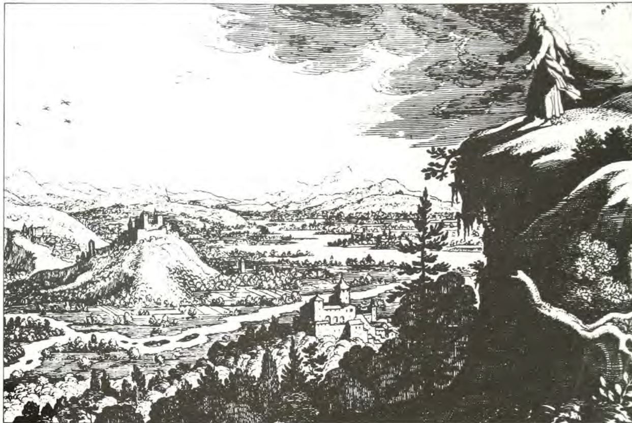
Ο Μωυσής στην Γη της Επαγγελίας.