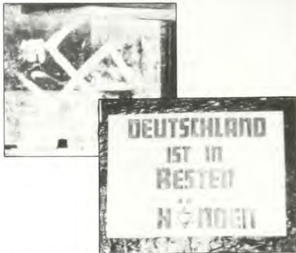
Τοιχογραφίες με συνθήματα άντιεβραϊκά και χιτλερικά

Στήν απόφασή του αυτή βοηθήθηκε από τις έμπειρίες του παρελθόντος, από τις άλησμόνητες εικόνες που είχαν χαραχτεί στα κύτταρα της «συλλογικής» μνήμης, τότε που ή ανθρώπινη ζωή έκτυλισσόταν μέσα στη ζούγκλα και όπου ή ζούγκλα είχε διεισδύσει και κατακυριαρχήσει σε όλες τις πτυχές της ζωής. Τότε πράγματι, ο άλλος, ο διαφορετικός, ο άγνωστος, πιά έπειτα εκείνος που έμενε έξω από τον κύκλο του φυλετικού τοτέμ, ήταν κατ' άναγκή αντίπαλος. Τό ότι όμως, άργότερα, σε ιστορικά χρόνια και μάλιστα σε εξέλιγμένες, «φωτεινές» περιόδους, ο άλλος εξακολούθησε να παραμένει ξένος και