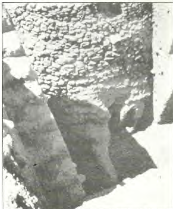
Τμήμα τείχους τῆς νεολιθικῆς ἐποχῆς 8.000 — 6.000 χρόνια π.χ. στήν ‘Ιεριχώ.

“Ο Θαλῆς ὁ Μιλήσιος, πού τό περίφημο «...Σήμερον κρεμάται ἐπὶ ξύλου ὁ ἐν ὕδασι τὴν γῆν κρεμάσας» ἀποτελεῖ ἴσως ἀπόχρον τῆς θεωρίας, ὅτι τὰ πάντα γίνονται ἀπὸ τό ὕδωρ, εὐχαριστοῦσε τόν Θεό γιά δύο πράγματα: “Οτι τὸν ἔκανα “Ελληνα καί ὄχι βάρβαρο καί ὅτι τὸν ἔκανε ἀνδρα καί ὄχι γυναίκα!! Καί γιά παραλληλισμό ἄς ἀναφέρουμε ὅτι μιά προσευχὴ τῶν ‘Εβραίων