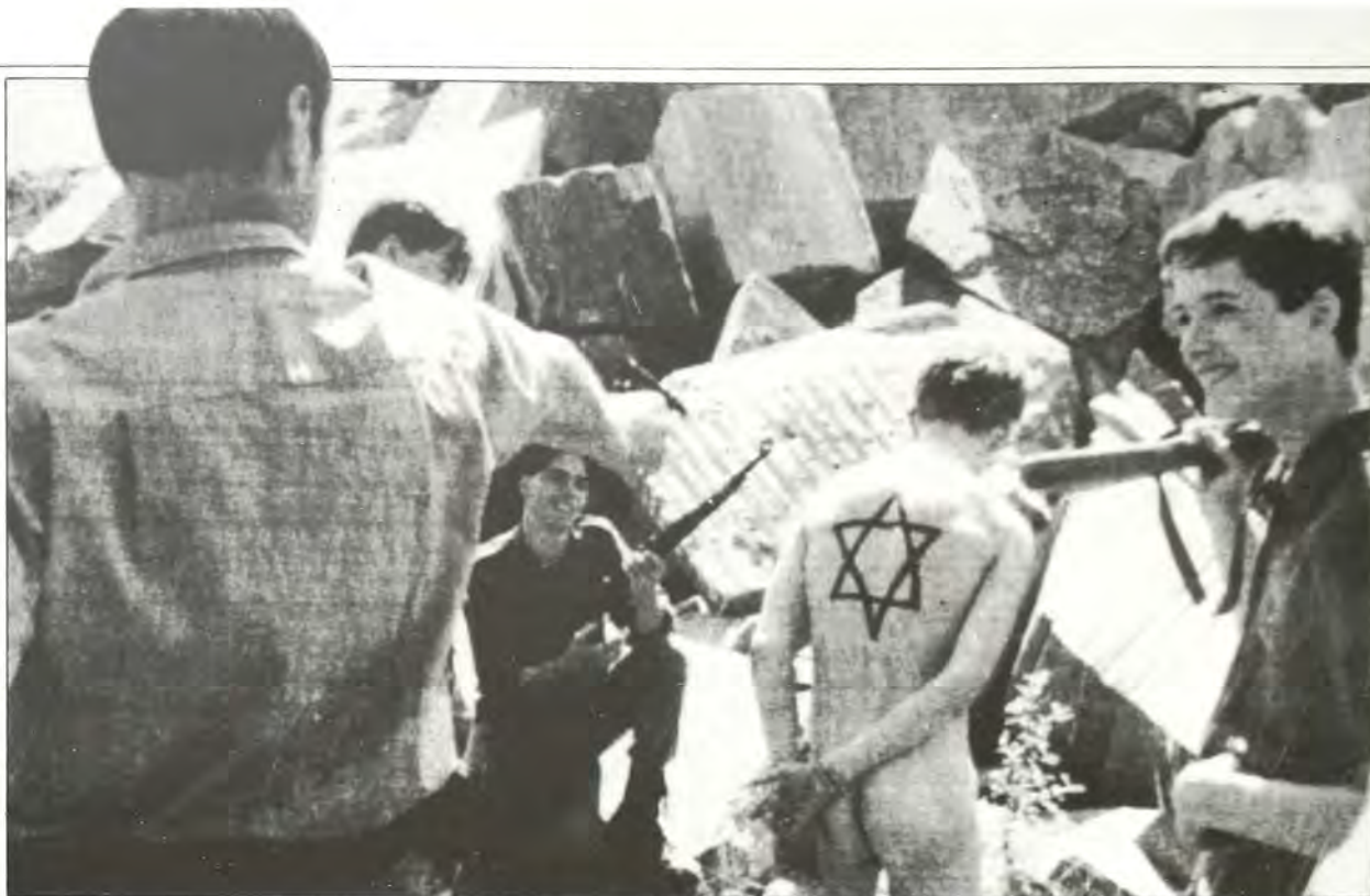
Σκηνή από νεοναζιστικό φιλμ: «Η εκτέλεση»

του κατά τόν Β' Παγκόσμιο Πόλεμο, με τη διαφορά ότι αυτή τη φορά τό 'Ισραήλ είναι ο θύτης. Αυτό, δέν αποτελεί μόνο τή χειρότερη διαστρέβλωση γεγονότων. Μπορείτε νά φαντασθείτε τίποτα πιά παράλογο από τό νά συγκρίνει κανείς τή μόνη δημοκρατία στή Μέση 'Ανατολή μέ τό πιά βάρβαρο καθεστώς πού εχει ποτέ εμφανισθεί στήν ιστορία; Είναι έξ άλλου ή χειρότερη προσβολή γιά τούς 'Εβραίους καί τούς 'Ισραηλινούς, πού θά μπορούσε κανείς νά φαντασθεί: Νά τούς συγκρίνει κανείς μέ τούς πρώην δολοφόνους τους. Είναι ακόμα — καί αυτό είναι τόσο επικίνδυνο όσο τά προηγούμενα — τό γεγονός ότι καθιστά κανείς εύτελη τή σημασία του 'Ολοκαυτώματος, συγκρίνοντάς το μέ οποιοδήποτε άλλο γεγονός στήν 'Ιστορία, γιατί όταν συγκρίνει κανείς τό πιά μοναδικό έγκλημα στήν ιστορία τής ανθρωπότητας μέ ό,τιδήποτε άλλο, τί θά σκεφτεί ή νέα γενιά ότι συνέβη στά χρόνια του Χίτλερ; Ποτέ δέν θά μπορέσει νά καταλάβει τή μοναδικότητα αυτού του έγκλήματος.