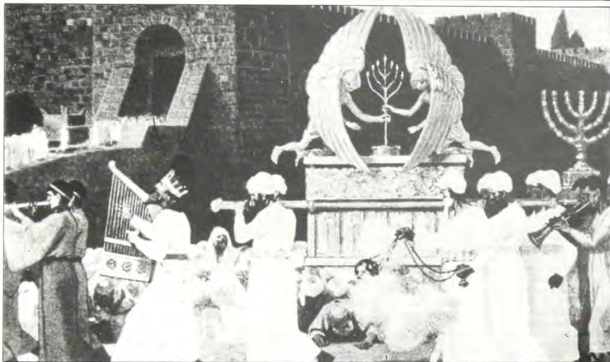
‘Ο Βασιλεὺς Δαβὶδ μετὰ τὴν ἀκολουθία του στὴν Ἱερουσαλὴμ.