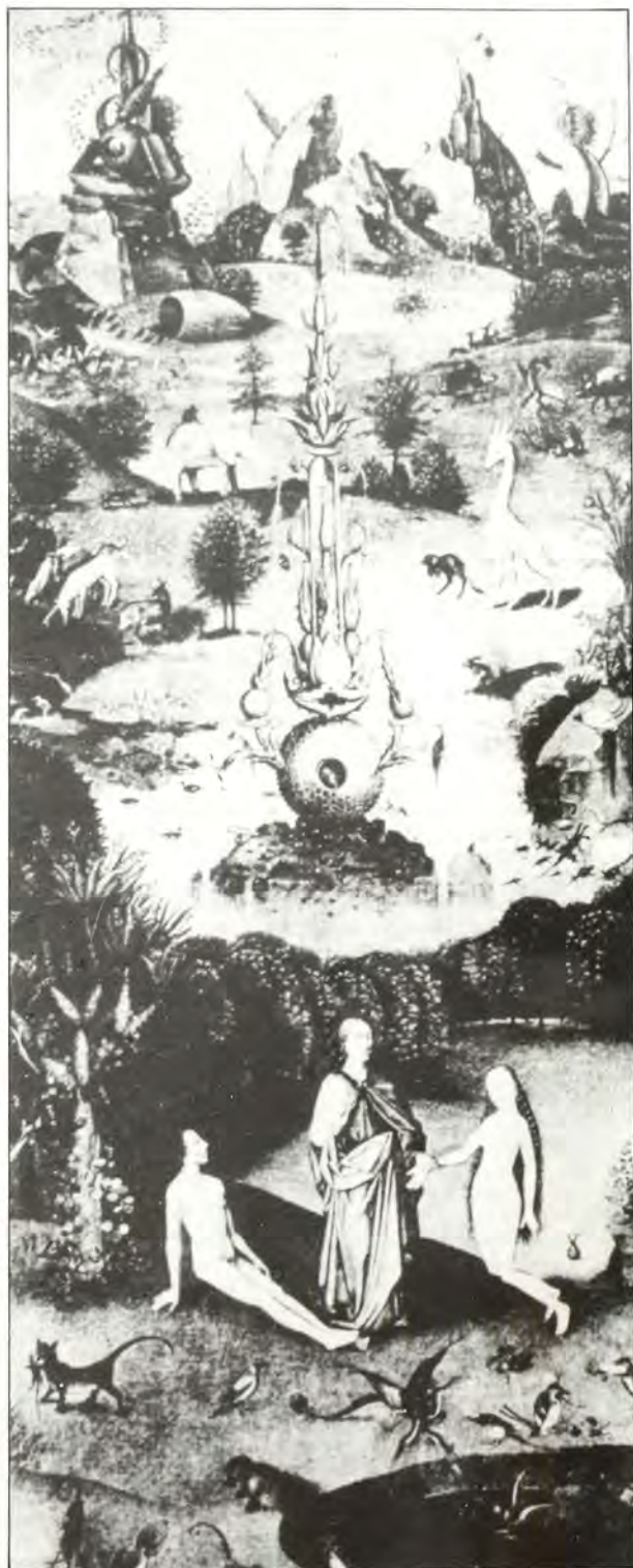
Ὁ Παράδεισος τῆς Βίβλου. Ὁ κήπος τῆς Ἑδέμ ἦταν ὁ- ση στὴν ἔρημο;

Η συνεργασία, γενικῶς, τῶν Ἑβραίων καί τῶν Ἑλλήνων διὰ μέσου τῶν αἰώνων ὑπῆρξε στενὴ μέχρι ἀδελφικῆς σάν ἰσοτίμων μελῶν τῆς αὐτῆς πολιτείας, ἀπὸ τῆς ἐποχῆς τοῦ Μεγάλου Ἀλεξάνδρου καί τῶν διαδόχων του, μέχρι τῆς ἐποχῆς πού οἱ Ρωμαῖοι τὸν Α’ αἰῶνα μετὰ Χριστὸν κατέλαβαν Αἴγυπτο, Παλαιστίνη, Μικρὰν Ἀσίαν κ.λπ. Αὐτοὶ μέ τὸ σατανικὸ τους δόγμα «διαίρει καί βασίλευε» (divide et impera), πού πολλοὺς μιμητὲς εἶχε καί ἔχει στὰ μεταγενέστερα χρόνια, κατόρθωσαν νά ἐνοπείρουν τὴ διχόνοια μεταξὺ τῶν πιὸ ἐπικινδύνων γι’ αὐτοὺς κατακτηθέντων ἐθνότητων, ὅπως τῶν Ἑβραίων καί τῶν Ἑλλήνων. Ἐτσι ἄρχισε νά δημιουργεῖται ἓνα εἶδος ἀντισημιτισμοῦ, πού οἱ Ρωμαῖοι τὸν μετέφεραν σὺν τῷ χρόνῳ σ’ ὅλες τίς χώρες πού διακυβέρνησαν. Γι’ αὐτὸ δὲν εἶναι ἀδικοαλόγητο τὸ γεγονὸς ὅτι ὁ ἀναφερόμενος σέ ἱερὰ ἑβραϊκὰ βιβλία «Σατανάς», ἔχει ταυτιστεῖ μέ τοὺς Ρω-