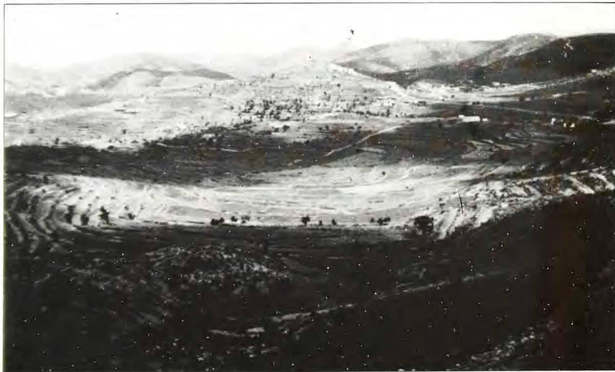
Ἡ Γῆ τῆς Ἐπαγγελίας, ὅπου, κατὰ τὴν παράδοση, ρέει τὸ γάλα καί τὸ μέλι.

Οἱ Ἕλληνες εἶναι ἀρίας φυλῆς, μὴ ἔχοντες ἄλλον συγγενὴ λαὸ πλὴν τῶν Ἰλλυριῶν (σημερινῶν Ἀλβανῶν). Οἱ Ἑβραῖοι εἶναι σημιτικῆς φυλῆς, δέν ἔχουν καί αὐτοὶ ἄλλους συγγενεῖς λαούς, τὸ δὲ ὄνομά τους σημαίνει «περιπλανώμενοι» καί πηγάζει ἀπὸ τίς περιπλανήσεις τους μεταξύ Μεσοποταμίας - Ἀραβίας - Αἰγύπτου καί Παλαιστίνης. Εἶναι ἀμφότεροι λαοὶ πού γιὰ ποικίλους λόγους, ἀναπτύχθηκαν ταχέως, καίτοι κάπως διαφορετικὰ καί οἱ ὅποιοι μέ τὴ σκέψη τους, τὴ θρησκευτικὴ τους πίστη πού «ὄρη μεθιστάνει» καί εἶναι «ἀγκυρα ἐλπίδας», τὴ φιλοσοφία τους γιὰ τὴ ζωὴ καί τὸ θάνατο, τὴν ἀποψὲς τους γιὰ τόν «Ἀνθρώπο» καί γιὰ τὸ Θεό, τὴν ἐπιχειρηματικὴ τους ἰκανότητα