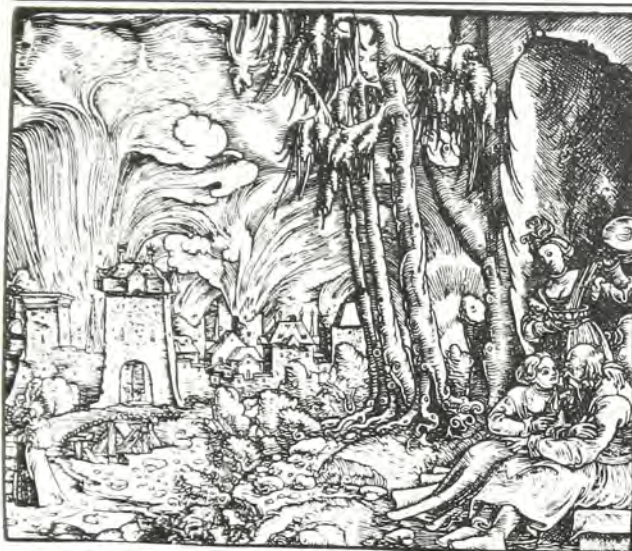
Σόδομα και Γόμορρα: Οι πόλεις της άπωλειας.

λαιπωρίες του, μέχρι τίς μέρες μας, όπου ο φιλοξενούμενος ξένος υποχρεώνεται να απαντήσει σ' έναν καταϊγισμό από αδιάκριτες συχνά έρωτήσεις, ή περιέργεια εμφανίζεται σαν τό βασικό κίνητρο της ελληνικής φιλοξενίας. Τό γεγονός δέν είναι παράξενο.