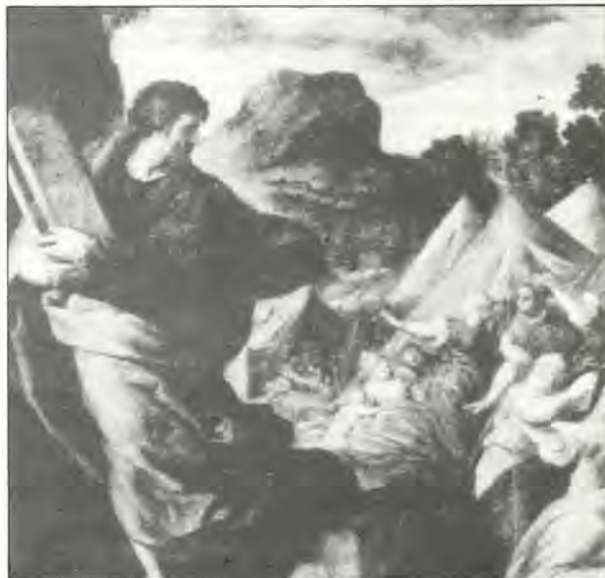
Ζωγραφικὴ παράσταση τοῦ Μωυσὲ μετὰ τὰς Δώδεκα Ἐντολὰς.

Η προσέγγισις Ἑλλήνων καί Ἑβραίων γίνεται τελεσίδικη καί πολὺ καρποφόρα τὴν ἐποχὴ τοῦ Μεγ. Ἀλεξάνδρου καί τῶν διαδόχων του, ἰδίως δὲ τῶν Πτολεμαίων. Ἡ περίοδος αὐτὴ τῶν πέντε αἰώνων, ἀποτελεῖ τὴν «χρυσήν περίοδο» τῶν ἐλληνοεβραϊκῶν σχέσεων. Οἱ δύο λαοί, στό κοινωνικό, τό πολιτικό, τό πνευματικό,