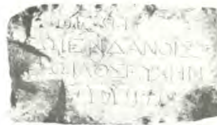
Ἐπάνω: Ἀνακατασκευασμένο μνημεῖο τοῦ 1ου π.Χ. αἰῶνος (Ἀρχαιολογικὸ Ἰνστιτοῦτο Πανεπιστημίου Τετ. Ἀβίβ). Κάτω: Ἑλλήνο - αραμαϊκὴ ἐπιγραφή τοῦ 2ου αἰῶνος π.Χ.

γῆς» καὶ ἀνθρώπους τῶν συναντᾶς παντοῦ. Σήμερα, στὴ «διασπορά» εὐρίσκονται περὶ τὰ 9 ἑκατομμύρια Ἑβραῖοι καὶ περὶ τὰ 3,5 - 4 ἑκατ. Ἕλληνες, πού ἐργάζονται καὶ προσδεύονται σὲ ὁλοὺς τοὺς τομεῖς τῆς ἀνθρωπίνης ἐκφανσης. Ριζώνουν ἐκεῖ, ἀλλὰ τὴν ἰδιαίτερη πατρίδα τους οὐδέποτε λησμονοῦν: «νὰ μαρμαρεῖ τὸ χέρι μου Ἱερουσαλὴμ, ἐὰν σὲ λησμονήσω». Καὶ τὸ ἑλληνικὸ «ὁ ξένος εἰς τὴν ξενιτιά πρέπει νὰ βάζει μαῦρα γιὰ νὰ ταϊριάζει ἡ φορεσιά μὲ τῆς καρδιάς τῆς λαύρα», τὸ νόστιμον ἡμᾶρ τοῦ νόστου ὑπονοοῦν.