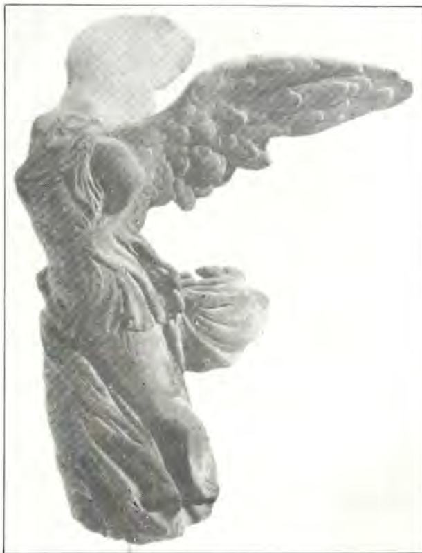
Ἡ «Νίκη τῆς Σαμοθράκης» ὅπως τὴν ἀπέδωσε ὁ Yves Klein.

Αὐτές τίς μεγάλες ἰδέες Ἑλλήνων καί Ἑβραίων οἱ ἐκάστοτε «Μεγάλοι», οἱ «ὑπερδυνάμεις» κατέβαλαν προσπάθειες, τὸν κατάλληλο γι’ αὐτές καιρὸ, νά τίς ἐκμεταλλευθοῦν καί πρὸς ὀφελὸς τους. Ἐτσι, ἡ Ἀγγλία, μιά πρώτη δύναμη τοῦ Α’ Παγκοσμίου Πολέμου, φιλοδοξοῦσε νά δημιουργήσει, χάριν τῶν συμφερόντων της, στήν ἐγγὺς καί Μέση Ἀνατολή, μιά «Μικρὴ Ἀγγλία», στό πρόσωπο τῆς Ἑλλάδας. Ἀλλά καθ’ ὃν χρόνον ἐμεῖς «ἐκόβαμε τὰ χαρτονομίσματά μας κατὰ 25% ὡς ἐσωτερικὸ δάνειο ἡ Ἀγγλία μέσω τῆς Ἐθνικῆς Τράπεζας Ἑλλάδας, πού μετοχικῶς ἤλεγχε ἐδάνειζε τὴ Γιουγκοσλαβία μέ 2 ἑκατομμύρια χρυσές δραχμές! Καί ἀνταγωνιζόταν πρὸς τὴν Ἀμερικὴ πού