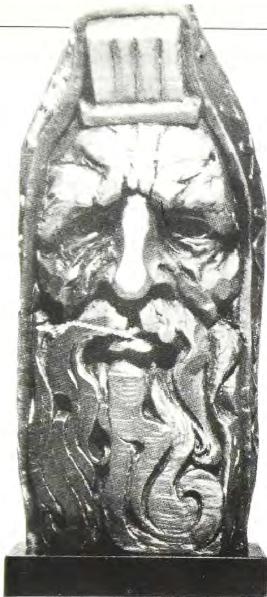
«Κεφαλή του Μωυσή», ἀπὸ τῆ συλλογῆ ἀσημένιων Ἰουδαϊκῶν θεμάτων, τοῦ Βρετανοῦ γλύπτου George Weil.