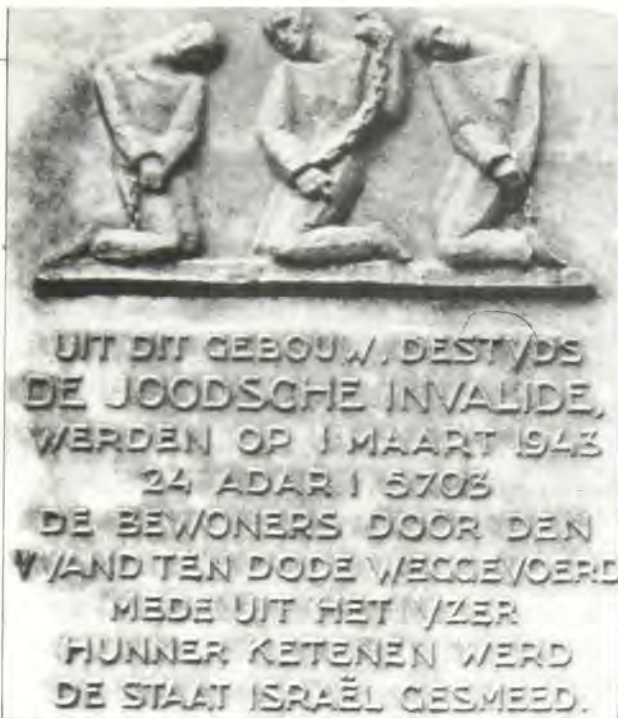
Μπρούτζινη πλάκα στο "Αμστερνταμ, με παράσταση τριών αλυσοδεμένων αλχημάτων στη μνήμη των Έβραϊων αλχημάτων των τών στρατοπέδων συγκεντρώσεως τών Ναζι.

μνάζοντα ύδατα τών παρηκμασμένων πολιτισμών. Διότι από της προϊστορικής έκκινήσεώς της, μέχρι της πρώτης πατριαρχικής αυτής εξόδου από της Βαβυλώνας, της Σεμιράμιδος, και πολύ πέραν της άλλης εξόδου αυτής από της Αιγύπτου, της συντελεσθείσης υπό την κολοσσιαίαν μωσαϊκὴν ἐπιταγὴν, ἡ φυλὴ αὕτη ἀναπτύσσει ἀσφαλῶς, παραλλήλως πρὸς τὴν τεράστιαν οικονομικὴν ἐμπειρίαν, ἡ ὁποία εἶναι καὶ τὸ κύριον γνῶρισμά της — καὶ χάρις εἰς τὴν ὁποίαν δύναται νὰ ἐγκαθίσταται ὅπου-δήποτε τῆς γῆς μετ' ἀσυζητήτου κύρους — μίαν ἀκαταμάχητον ἐνέργειαν πρὸς συγχώνευσιν τῶν πολιτικῶν διαιρέσεων καὶ οὐσιαστικότεραν ἔνωσιν τῶν πνευματικῶν καὶ ὑλικῶν συμφερόντων τῶν λαῶν μεταξύ τῶν ὁποίων παροικεῖ. Τὴν μεγαλύτην ἀπόδειξιν τῆς ἐνεργείας ταύτης, δὲν θὰ μᾶς δώσει βεβαίως τόσον ἡ ἐξιστορησις τῆς ἐθνικῆς ζωῆς τῆς φυλῆς ταύτης, ὅσον ἡ τραγικὴ ἱστορία αὐτῆς, ἀπὸ τῆς στιγμῆς κατὰ τὴν ὁποίαν, ἐστερημένη οἰασθῆποτε πολιτικῆς ζωῆς καὶ οἰουδῆποτε ἐθνικοῦ ἐδάφους, ἀναλαμβάνει, θὰ ἔλεγε τις, ἀντ' αὐτῶν, ὁλόκληρον τὴν ὀργανικὴν παράδοσιν τῆς ἀνθρωπότητος, ἐπανευρίσκει πτέρυγας πολὺ μεταλύτερας ἀπὸ τὰς ἐθνικὰς πτέρυγας τῆς καὶ κατορθώνει νὰ ὑψωθεί καὶ νὰ ἐπιζῇ ὡς φυλὴ καὶ ὡς ἔννοια ὀργανικὴ καὶ ἀκεραία, ὑπεράνω ὅλων τῶν κατ' αὐτῆς ἀκατονομάστων διώξεων καὶ ὅλων τῶν ἱστορικῶν τῆς ἀνθρωπότητος θυελλῶν.