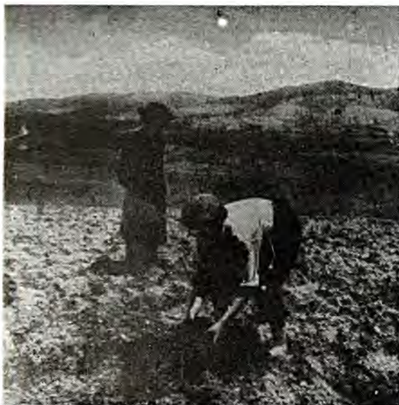
Ραββίνος επιβλέπει την σπορά πατάτας στα Καρπάθια έλεγχοντας τό χώμα.