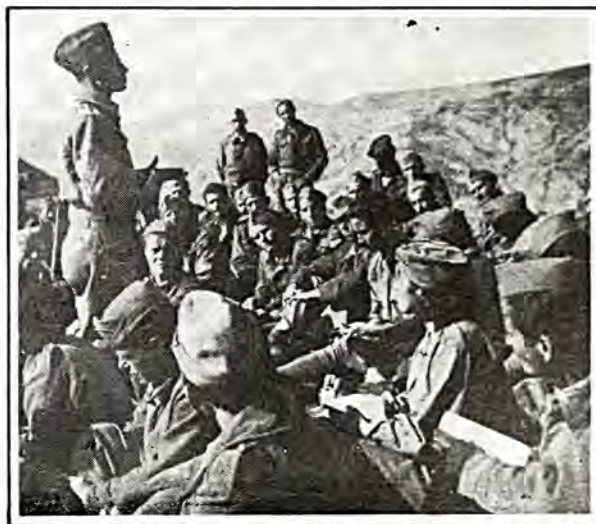
Μάθημα στρατιωτικής τακτικής στό βουνό.

Οι άμερικανικές καί οι βρετανικές άρχές, πού δεν κούνησαν ένα έξω δαχτυλάκι γιά νά σώσουν έναν 'Εβραίο, θορυβήθηκαν άναρωτούμενες άν ό άρχираββίνος ήταν κομμουνιστής! Στα βρετανικά άρχεία ύπάρχει τό ύπ' αριθμ. 2907/3/44 μνημόνιο, πού έστάλη από τή βρετανική πρεσβεία στην Ουάσινγκτον προς τό Σταί-