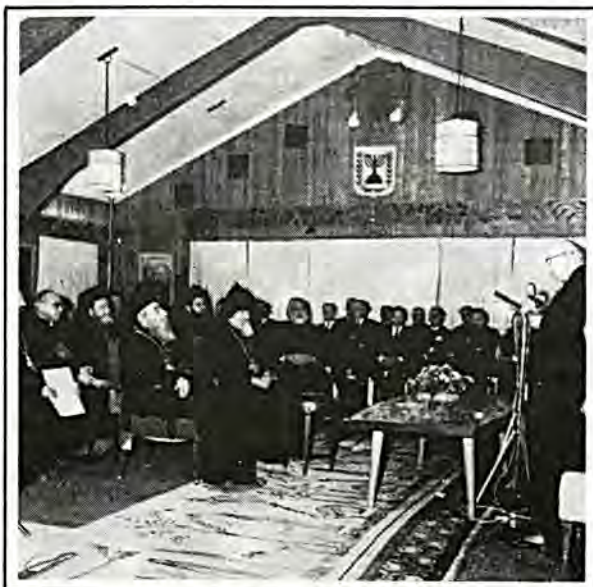
Ὁ τότε Πρόεδρος τοῦ Κράτους τοῦ Ἰσραὴλ κ. Σαζάρ συνομιλεῖ μέ ἐκπροσώπους τῶν θρησκειῶν πού ἐκπροσωποῦνται στήν Ἱερουσαλήμ.

Α ς γυρίσουμε τώρα στόν Ἀπόστολο Ἀγ. Παῦλο. Ἡ δική του ἀντίληψη εἶναι τελείως πιό σοφιστική. Κατ' αὐτόν, τόσο ὁ Ἑβραῖος ὅσο καί ὁ Ἑθνικός ὑπόκεινται, ἐξίσου, στήν κρίση τοῦ Θεοῦ. «Διότι προσεξηλέξαμεν Ἰουδαίους τε καί Ἑθνικούς ὅτι εἶναι πάντες ὑπό ἁμαρτίαν». Παρόλα αὐτά οἱ Ἑβραῖοι ὑπόκεινται μᾶλλον σέ περισσότερες κατηγορίες, διότι ἐχαιραν εὐεργετημάτων πού δέν ἴσχυαν γιά τοὺς Ἑθνικούς. «Πρός τί ὑπερτερεῖ ὁ Ἰουδαῖος; ἡ ποία ἡ ὠφέλεια ἐκ τῆς περιτομῆς; Πολλάκις διότι εἰς αὐτοὺς παρεδόθησαν αἱ προφητεῖαι τοῦ Θεοῦ». Σέ ἄλλο σημεῖο μιλάει περί τῶν Ἑβραίων «τῶν ὁποίων εἶναι ἡ υἱοθεσία, καί ἡ δόξα, καί αἱ διαθήκαι, καί ἡ νομοθεσία, καί ἡ λατρεία