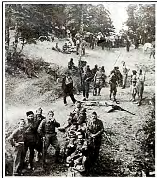
Σύντομη άνάπαυση στό μεγάλη πορεία.

«'Ο άνώτερος Βρετανός αξιωματικός - σύνδεσμος στό άρχηγείο του ΕΛΑΣ, ό οποίος πήρε συνέντευξη από τόν άρχираββίνο, διαμόρφωσε τή γνώμη ότι ό τελευταίος στερείται κάθε πολιτικού ενδιαφέροντος».