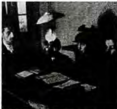
Δεξιά: Τρεις μαθητές του «Ταλμούδ Τορά» στο χωριό Άπσα στα Καρπάθια παρακολουθούν μάθημα στην Τορά. Κάτω: Παιδιά τής πρώτης τάξεως δίδασκονται τήν εβραϊκή αλφάβητο και τά φωνήεντα.