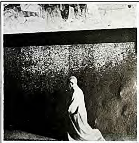
Χριστιανὸς μοναχὸς σέ ὥρα προσευχῆς σέ ἐκκλησία τῆς Ἱερουσαλὴμ.

πιό ἐντονο ὅφος ἀπό τίς ἀντίστοιχες παραγράφους στόν Μάρκο καί τόν Λουκά. Τά λόγια πού ἐκφράζονται γιά τοὺς Φαρισαίους εἶναι τελείως ὁδὶκα γιά τήν τάξη τῶν Φαρισαίων σάν σύνολο, οἱ ὁποῖοι ὑπῆρξαν ἀπό τά πλέον εὐαίσθητα, ἀπό θρησκευτική ἀποψη, άτομα τῶν ἡμερῶν τους. Ἀναμφίβολα ὁ Ἰησοῦς, μέ τήν ἀλάνθαστη καί διεισδυτική ἀνάλυση τῆς καρδιάς τῶν ἀνθρώπων, εἶπε μερικά συνταραχτικά ἐναντίον ὁρισμένων Φαρισαίων. Δέν ὑπάρχει, ἐπίσης, ἀμφιβολία ὅτι ὁ Ἀγ. Ματθαῖος διηύρυνε τοὺς λόγους αὐτοῦς, συμπεριλαμβάνοντας, συλλογικά, ὅλους τοὺς Φαρισαίους. Δέν προκαλεῖ, ὅμως, ἐντύπωση πού ἡ Ἐκκλησία διαβάζει αὐτοὺς τοὺς λόγους σάν μία ὠμή καταδίκη τῆς Ἰουδαϊκῆς διδασκαλίας; Γιά παράδειγμα τά λόγια: