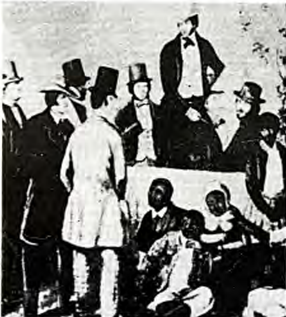
Σκλαβοπάζαρο του 1852 στην 'Αμερική

Τά λιμάνια όπου κατέληγαν αυτά τά έμπορικά πλοία είχαν άμεση σχέση μέ τά προϊόντα πού αυτά μετέφεραν. Τούτο σήμαινε ότι οι μετανάστες δέν επέλεγαν τόν τόπο τής άφιξης των, αλλά κατέβαιναν στόν τόπο προορισμού τού πλοίου. Π.χ. οι 'Ιρλανδοί ήρθαν στην 'Αμερική μέ πλοία, πού μετέφεραν στην Εύρωπη ξυλεία άπό τήν βορειοανατολική 'Αμερική. Έτσι όμως οι