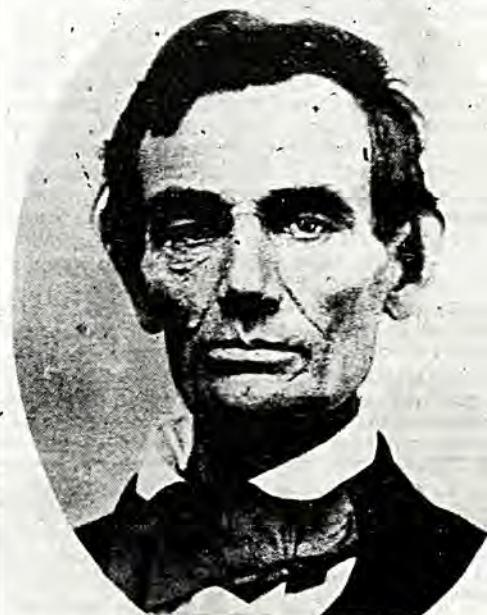
Ὁ Πρόεδρος τῶν Η.Π.Α. Ἀβραάμ Λίνκολν

Τ Ο ΕΙΣΟΔΗΜΑ, ό επαγγελματικός προσανατολισμός και τό ύψος της άνεργίας διαφέρουν ούσιαστικά στις διάφορες έθνικές ομάδες της άμερικανικής κοινωνίας — όπως βέβαια ή έγκληματικότητα, ή γονιμότητα και ή επιχειρηματική δραστηριότητα. 'Η εξήγηση των παραπάνω διαφορών είναι περίπλοκη, αλλά συχνά εμφανίζεται. Καμμία από τίς