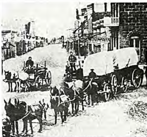
Καραβάνι όποιων κατευθύνεται δυτικά της Χέλβνα (Μοντάνα). Τέλη της δεκαετίας του 1860.

Κάθε εθνική ομάδα έχει αλλάξει από τότε που έγκα-