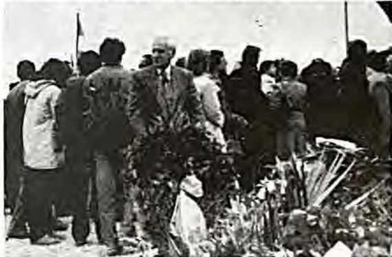
Τό Κεντρικό Ισραηλιτικό Συμβούλιο Έλλάδος κατέθεσε δι' αντιπροσωπείας του στεφάνι στο Γοργοπόταμο προς τιμή της Έθνικής Αντιστάσεως.