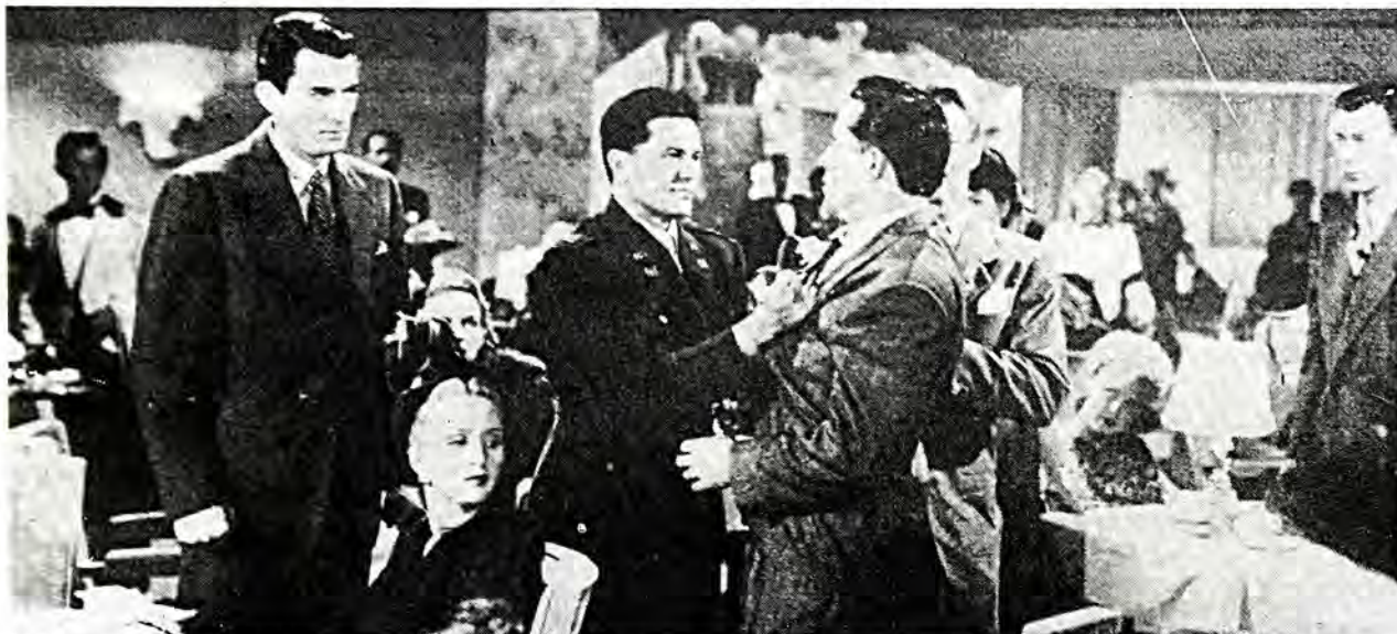
Μιά σκηνή από το φιλμ του 'Ηλ. Καζάν «Συμφωνία κυρίων», που αναφέρεται στον αντισημιτισμό στις Η.Π.Α.

κανοί παρουσιάζουν χαμηλότερο κατά κεφαλήν εισόδημα από τους μαύρους, παρ' ότι οι τελευταίοι κερδίζουν λιγώτερα χρήματα με την εργασία τους, επειδή οι πρώτοι φτιάχνουν μεγαλύτερες οικογένειες. Τουτό εσφέρει στο γεγονός ότι οι Μεξικανοί - Αμερικανοί διαθέτουν χειρότερη στέγη και παρουσιάζουν φτωχότερη μόρφωση από τους μαύρους — και βέβαια σε πολύ χαμηλότερο επίπεδο από τον μέσο όρο ολόκληρης της Αμερικής. Η ύψηλη γονιμότητα διασυνδέεται επίσης με την χαμηλότερη βαθμολογία στα τέστ νοημοσύνης παιδιών, που λόγω του πολυάριθμου της οικογένειάς των γίνονται το αντικείμενο λιγώτερης φροντίδας από μερικούς των γονέων των. Τουλάχιστον οι μισοί μαύροι από όσους αποτυχαίνουν στα τέστ νοημοσύνης του στρατού, προέρχονται από οικογένειες με έξη ή παραπάνω παιδιά. Παρ' ότι τα παραπάνω τέστ είναι λευκής πολιτιστικής εμπνεύσεως και συνεπώς αδικούν ίσως τα μέλη άλλων φυλετικών ομάδων, ή παραπάνω αδικία θά ίσχυε το ίδιο για όσους μαύρους προέρχονται από μικρές οικογένειες. Έτσι όμως οι διαφορές στην βαθμολογία των τέστ νοημοσύνης αποκτούν ιδιαίτερη σημασία.