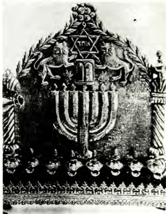
Ἀσημένια λυχνία Χανουκά Ἀλεξάνδρεια, Αἴγυπτος 18ος αἰ.

Πῶς ὁμως θὰ διακρίνῃ ὁ καθένας μας τὴν ὀρθή ὁδὸ; Πῶς θὰ μπορέσῃ νὰ πορευθεῖ στὴν κατεύθυνση πρὸς τὸν ἀληθι-