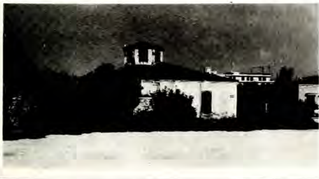
Συναγωγὴ τῆς Κομοτηνῆς