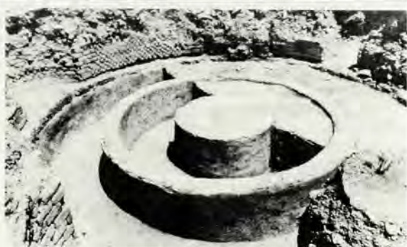
Ιερουσαλήμ: Τό χειμερινό παλάτι του Έρωδη. Τμήμα του ύδραγωγείου

Όταν η διεθνής αρχαιολογική ομάδα του Γικάλ Σιλόχ πήρε το 1978 την άδεια για να άρχισι τις έρευνές της είχαν ήδη προηγηθεί ένδε σημαντικές αρχαιολογικές άποστολές που είχαν προσπαθήσει να ανακαλύψουν τα μυστικά της προέλευσης και της εξέλιξης της Ιερουσαλήμ. Οι αρχαιολόγοι ήξεραν ότι η πόλη είχε κατοικηθεί από το 3000 π.Χ. και ότι είχε χτιστεί με την βοήθεια ειδικών τεχνιτών και ύδραυλικών. Μετά όμως από ένα αιώνα ανασκαφών ο λόφος του Όφελ εξακολουθούσε να δημιουργεί περισσότερα έρωτηματικά παρά ά να δίνει άπάντησεις. Πώς ήταν δομημένη η πόλη του Δαυίδ; Μέ ποιό τρόπο ήταν οχυρωμένη; Πού βρισκόταν τα έπίσημα κτίρια, οι έπιγραφές και τα μνημεία; Πού βρισκόταν οι τάφοι του Δαυίδ και του Σολομώντα και των άλλων βασιλιάδων που σύμφωνα με την Βίβλο εί-