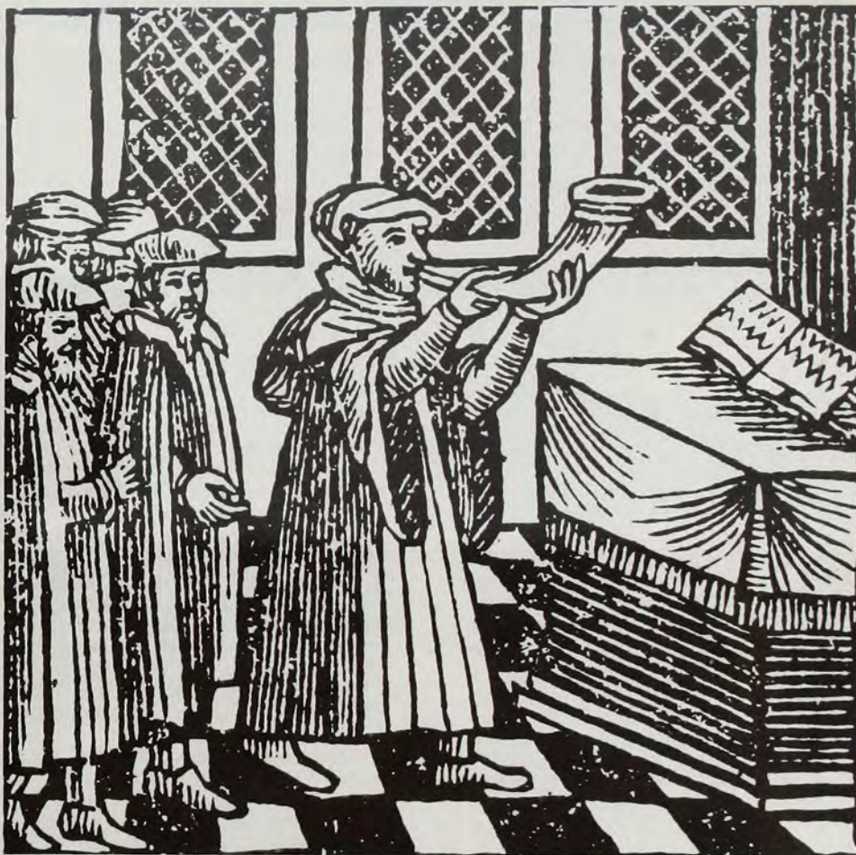
Τό σάλπισμα, ξυλόγλυπτο "Αμστερνταμ, 1707

ΕΤΟΣ Ζ' • ΤΕΥΧΟΣ 61 • ΣΕΠΤΕΜΒΡΙΟΣ 1983 • ΤΙΣΡΙ 5744