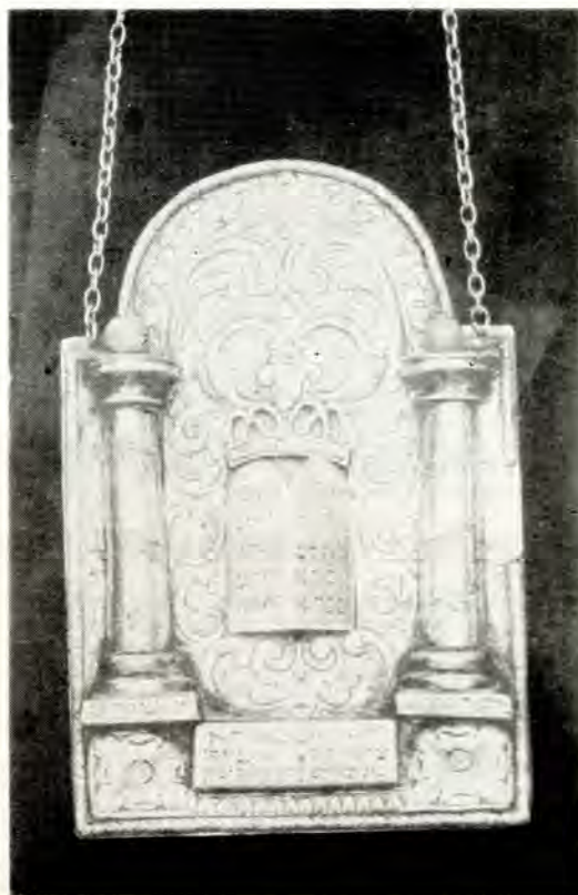
Άσημένιο διακοσμητικό του Σέφερ — Τορά (Ιερουσαλήμ 19ος αϊ.)

Τό «φθινοπωρινό» έτος, πού άρχίζει μέ τό μήνα Τισρί πού ξεκινάει από τή συγκομιδή τών σπαρτών καί τών αγαθών καί ολοκληρώνεται πάλι μέ τή συγκομιδή, αντιστοιχεί μέ τό έτος τής δημιουργίας τής γής. Μέσω αυτού του έτους μετράμε τά έτη του κόσμου, τά χρόνια τής ζωής μās, τών επιτευγμάτων μās, καί τής άπασχολήσεώς μās μέ τά γήινα. Τό έτος τής «άνοιξης» από τήν άλλη μεριά, πού άρχίζει μέ τό μήνα Νισάν καί λήγει τόν ίδιο μήνα, είναι τό έτος του 'Ιουδαϊσμού, τό έτος τής απολύτρωσης, του 'Ισραήλ καί τής άνθρωπότητας. Μέσω αυτού του έτους μετράμε τήν έβραϊκή μās ζωή, υπολογίζουμε τούς μήνες καί τίς γιορτές μās.