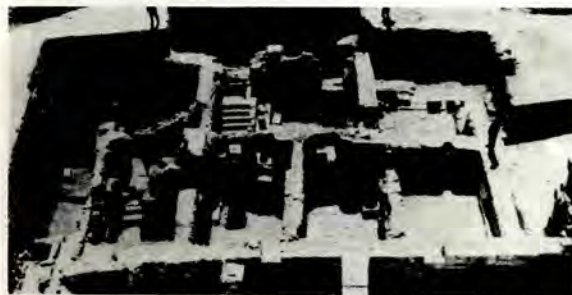
Βυζαντινὸ κτίσμα στὴν Ἱερουσαλὴμ κοντὰ στὸ ἱερό Μοῦντ