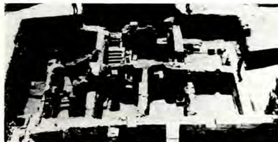
Βυζαντινὸ κτίσμα στὴν Ἱερουσαλὴμ κοντὰ στὸ ἱερὸ Μοῦντ

Ε να ἀπὸ τὰ σημαντικὰ δοκίμια τοῦ δευτέρου μισοῦ τοῦ 19ου αἰῶνα εἶναι τοῦ Μάθιου Ἀρνολτ «Ἑβραϊσμός καὶ Ἑλληνισμός» (1869), ὅπου ὁ Ἀγγλὸς βικτωριανὸς ποιητὴς ὑποστηρίζει ὅτι ὁ εὐρωπαϊκὸς κόσμος κινεῖται κατ' οὐσίαν ἀνάμεσα σὲ δύο σφαῖρες ἐπιρροῆς: τὸν ἑλληνισμό καὶ τὸν ἐβραϊσμό. Ὁ πρῶτος ἐπιδίδκει νὰ βλέπει τὰ πράγματα τῆς ζωῆς ὅπως πραγματικὰ εἶναι, κι ὁ δεύτερος νὰ χειραγωγῇ τὴν ἀνθρώπινη συμπεριφορὰ, μὲ ἀπώτερο κοινὸ σκοπὸ τὴν τελείωση ἢ σωτηρίαν τοῦ ἀνθρώπου. Σημερινοὶ μελετητὲς ἐμπεριδεύουν μὲ τὸ δίλημμα, κηρύσσοντας τὴν ταυτότητα τῶν δύο αὐτῶν ἀντίπαλων τάσεων στὴν εὐρωπαϊκὴ σκέψη. Ὅτι δηλ. ἡ ἐβραϊκὴ γλώσσα δὲν εἶναι τίποτα παραπάνω ἀπὸ ἐλληνικὰ κάπως καμουφλισμένα. Αὐτὸ ὑποστηρίζει ἕνας ἐβραῖος γλωσσολόγος τῆς ἐβραϊκῆς ἀραμαϊκῆς, ἀραβικῆς καὶ ἐλληνικῆς πού ταυτόχρονα εἶναι καὶ δικηγόρος στὸ Λονδίνο. Ὁ Ἰωσήφ Γιαχούντα, πού γεννήθηκε πρὶν ἀπὸ 82 χρόνια στὸ Κάιρο, ὑποστηρίζει ὁ κ. Γιαχούντα, τὰ ἐλληνικὰ φύλα κατέβαιναν πρὸς τὸ νότο καὶ στὴν καθόδὸ τους χωρίστηκαν σὲ δύο κύριες ομάδες, τοὺς ἀσιατικούς ἢ ἡπειρωτικούς Ἑλλήνες καὶ τοὺς εὐρωπαϊκοὺς ἢ θαλασσινοὺς Ἑλλήνες. Ἡ πρώτη ομάδα, στὴν ὁποία περιλαμβάνονται οἱ Ἑβραῖοι καὶ οἱ Τρῶες, κινήθηκε μὲσω τῆς Μ. Ἀνατολῆς πρὸς τὴν Ἀσία καὶ τὴν Ἰνδία. Ἡ δεύτερη, καταστάλαξε στὴ σημερινὴ Ἑλλάδα καὶ ἐποίκησε καὶ τὰ γύρω νησιά. Κα-