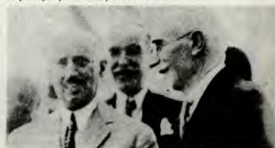
Αλ. Παπαναστασίου — Ελ. Βενιζέλος

Τ ῆς ἑδρας αὐτῆς ἑκτακτός ἐπικουρικός καθηγητῆς μέ τριετή θητεία ἐξελέγη ὁ Λάζαρος Βελέλης . Ὁ διορισμός του ἐγίνε τό Δεκέμβριο 1928 καί ὁ ἴδιος ἀνέλαβε τά καθήκοντά του τήν 8.1.1929. Ταυτόχρονα ὁμως σχεδόν μέ τήν ὀρκωμοσίαν του, ἀνέκυψε ζήτημα καταλήψεώς του ἀπό τό ὄριο ἡλικίας, πού ἦταν τότε τό ἐβδομηκοστό ἔτος. Ὁ Βελέλης φερόταν γεννημένος στό 1859, ἐνῶ ὅπως ὁ ἴδιος δήλωσε σέ ἐγγραφοῦ του (27.3.1929) εἶχε γεννηθεῖ στό 1863. Ἡ τελευταία χρονολογία ἄλλωστε ἀναγράφεται στό διδακτορικό του δίπλωμα καί στήν Jewish Encyclopedia. Τό Πανεπιστήμιο ἀποδέχθηκε τή δήλωσή του καί ἔτσι συνέχισε τή διδασκαλία του ἕως ὅτου ἔληξε ἡ τριετής θητεία του στό τέλος τοῦ 1931. Ἡ ἑδρα προκηρύχθηκε πάλι καί μοναδικός ὑποψήφιος ἦταν ὁ Βελέλης, πού ἐπανεξελέγη παμπσηφεί ἑκτακτός ἐπικουρικός καθηγητῆς γιά μία τριετία. Ἡ Φιλοσοφική Σχολή δίστασε νά τόν ἐκλέξει τακτικό ἐξαιτίας τοῦ γεγονότος ὅτι κατά τή διάρκεια τῆς καθηγητικῆς του θητείας καμιά νέα μελέτη δέν εἶχε δημοσιεύσει. Εἶναι χαρακτηριστικά πάντως τοῦ ἐπιστημονικοῦ του κύρους τά ὅσα το-νίζονται στήν ἐκθεση τῶν εἰσηγητῶν καθηγητῶν Ι. Βογιατζίδη καί Γ. Γρατσιαίου: