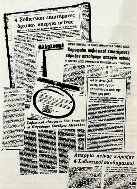
Οι ελληνικές έφημερίδες γιά τήν απαγόρευση έξόδου των Χατσατουριάν από τήν Σ. Ένωσή

Μεγάλη μερίδα του άθηναϊκού Τύπου έδωσε ιδιαί- τερη σημασία και δημοσιότητα στό γεγονός που άπα- σχόλησε τό καλοκαίρι τήν κοινή γνώμη.