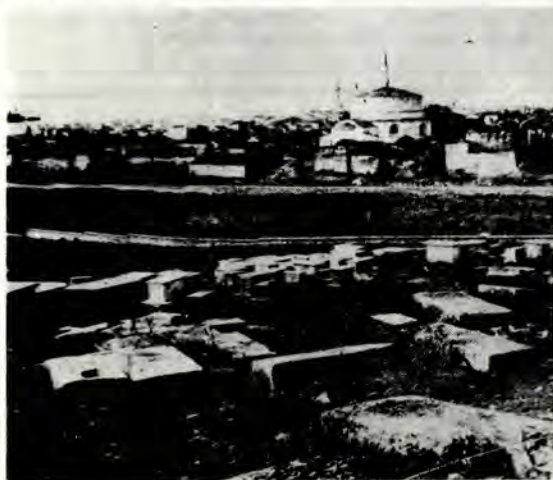
Ἀποψὶς τῆς Θεσσαλονίκης τοῦ 1900