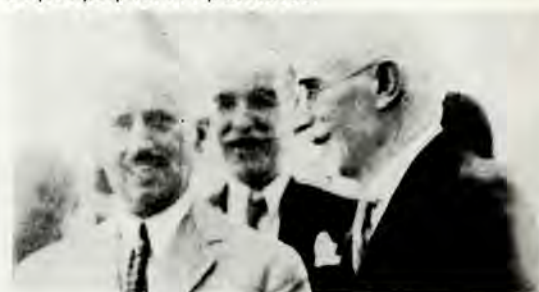
Α.Α. Παπαναστασίου — Ε.Α. Βενιζέλος

Τ ῆς ἑδρας αὐτῆς ἑκτακτος ἐπικουρικός καθηγητῆς μέ τριετὴ θητεία ἐξελέγη ὁ Λάζαρος Βελέλης . Ὁ διορισμός του ἐγίνε τό Δεκέμβριο 1928 καί ὁ ἴδιος ἀνέλαβε τὰ καθήκοντά του τὴν 8.1.1929. Ταυτόχρονα ὁμως σχεδὸν μέ τήν ὀρκωμοσίαν του, ἀνέκυψε ζήτημα καταλήψεώς του ἀπὸ τό ὄριο ἡλικίας, πού ἦταν τότε τό ἐβδομηκοστό ἔτος. Ὁ Βελέλης φερόταν γεννημένος στά 1859, ἐνῶ ὅπως ὁ ἴδιος δήλωσε σέ ἐγγραφὸ του (27.3.1929) εἶχε γεννηθεῖ στά 1863. Ἡ τελευταία χρονολογία ἄλλωστε ἀναγράφεται στό διδακτορικό του δίπλωμα καί στήν Jewish Encyclopedia. Τό Πανεπιστήμιο ἀποδέχθηκε τὴ δήλωσή του καί ἔτσι συνέχισε τὴ διδασκαλία του ἕως ὅτου ἔληξε ἡ τριετής θητεία του στά τέλη τοῦ 1931. Ἡ ἑδρα προκηρύχθηκε πάλι καί μοναδικὸς ὑποψήφιος ἦταν ὁ Βελέλης, πού ἐπανεξελέγη παμπψηφεί ἑκτακτος ἐπικουρικός καθηγητῆς γιά μία τριετία. Ἡ Φιλοσοφικὴ Σχολὴ δίστασε νά τὸν ἐκλέξει τακτικὸ ἐξαιτίας τοῦ γεγονότος ὅτι κατὰ τὴ διάρκεια τῆς καθηγητικῆς του θητείας καμιά νέα μελέτη δέν εἶχε δημοσιεύσει. Εἶναι χαρακτηριστικά πάντως τοῦ ἐπιστημονικοῦ του κύρους τὰ ὅσα τὸνίζονται στήν ἐκθεση τῶν εἰσηγητῶν καθηγητῶν Ι. Βογιατζίδη καί Γ. Γρατσιατοῦ: