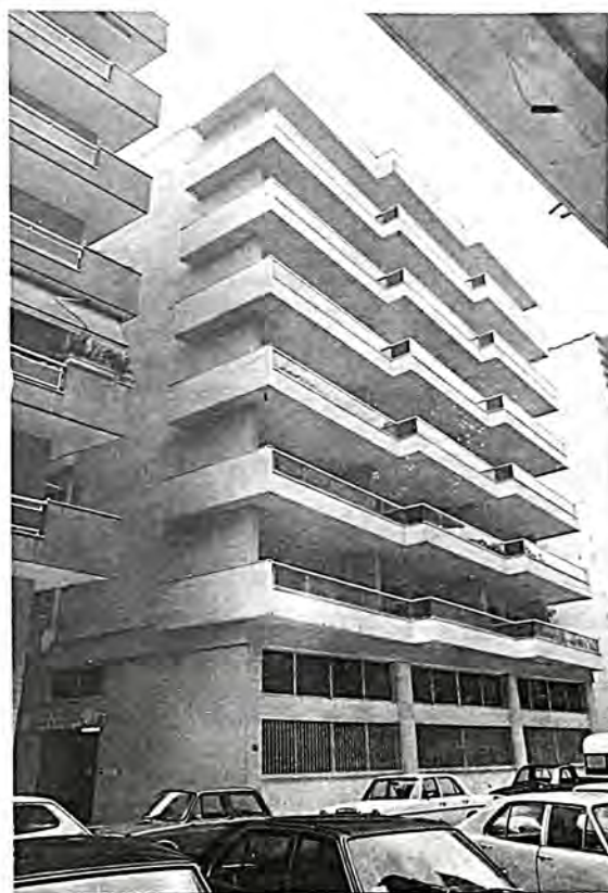
Ἐξωτερική ἀποψη τοῦ ἱηροκομείου.

στούς ἰδρυτες τῆς περίφημης συναγωγῆς «Ἰτάλια».