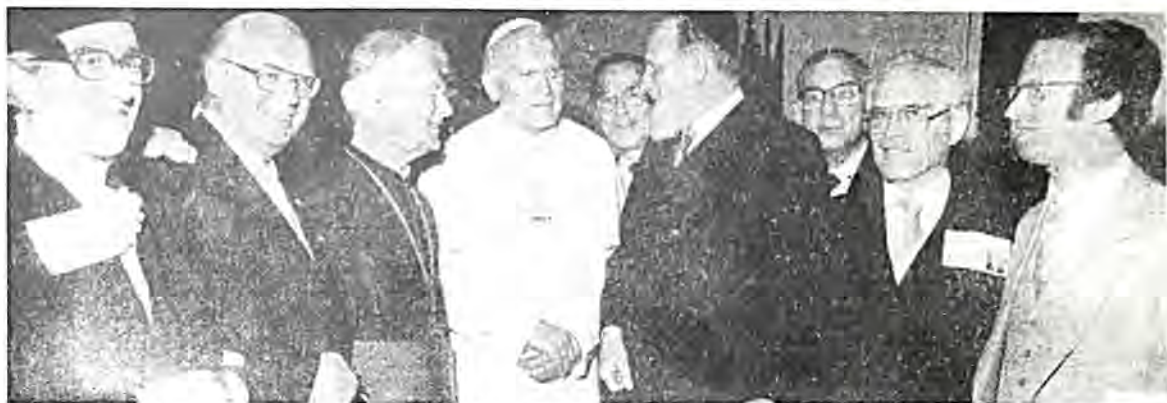
‘Ο Πάπας Παύλος — Ιωάννης Β΄, κατά την πρόσφατη επίσκεψή του στην Άγγλία, συζητεί με εκπροσώπους χριστιανικών Έκκλησιών και τόν Άρχιρραβίνο της Μ. Βρετανίας σέρ. Imm. Jakobovits.