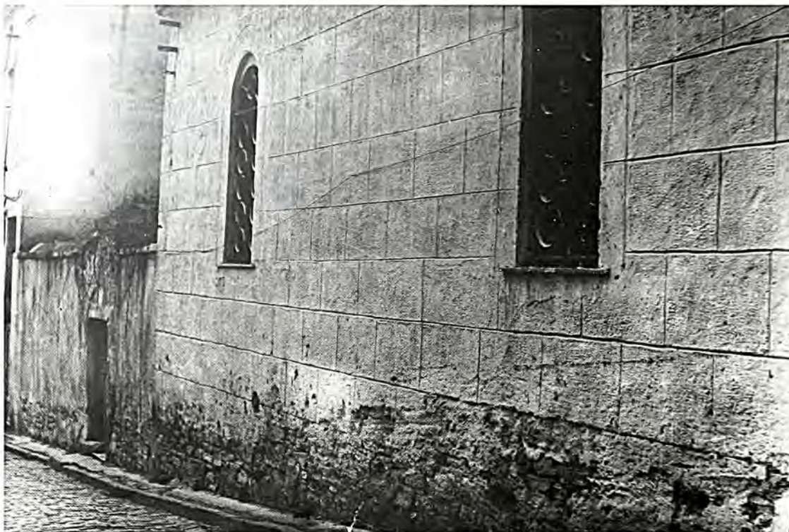
Καβάλα: Έξωτερικό της παλιᾶς Συναγωγῆς πού καταστράφηκε ἀπὸ τοὺς Βουλγάρους. (Τώρα στὴ θέση της ἔχει ἀνεγερθεῖ πολυκατοικία).

ας, ἤτοι κατὰ σειρὰν Ἄνω Τζουμαγιά - Ντούπιτσα - Σόα - Λόμ.