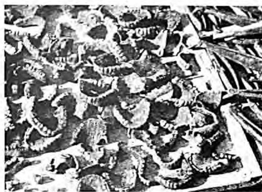
Άφαιρεθείσες μασέλες δολοφονηθέντων.

"Όμως κάτι τό άσυνήθιστο συνέβη. Οι SS, πού κανονικά θάπρεπε νά βρίσκονταν στήν τραπεζαρία, δέν είχαν φύγει.