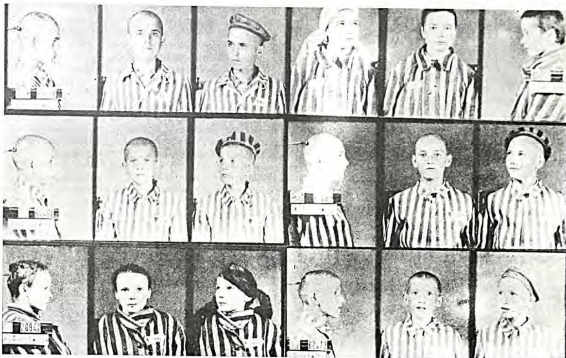
Στρατόπεδο "Αουσβιτς: 'Υπήρξαν 405.000 απ' αυτούς που έλαβαν αριθμό και καταδικάστηκαν να εργασθούν μέχρι θανάτου στο στρατόπεδο. Φωτογραφίες, σε τρεις στάσεις, παίρνονταν μετά τον εγκλεισμό των φυλακισμένων στο στρατόπεδο.

άλλη. Κάθε τρίτη μέρα ή κάθε εβδομάδα, μαθαίναμε πώς έφθανε και μία νέα αποστολή, πώς τόσοι είχαν καλή και τόσοι νέοι μπήκαν στο στρατόπεδο.