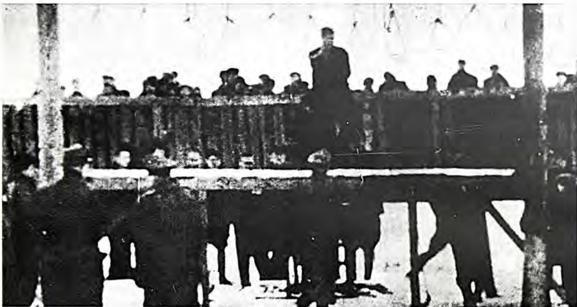
Στρατόπεδο Άουσβιτς: Ή άρχή του τέλους... Κάθε παράβαση τιμωρείται μέ αυστηρότατες ποινές. Όμαδική κρεμάλα καί έκτέλεση έγκλειστων γιά παραδειγματισμό.

τίς πρώτες μέρες μετά τήν άπελευθέρωσή μου, τό 1945. Οι σύμμαχοι πού μās άπελευθέρωσαν, οι Άμερικανοί, μέ έβαλαν μαζί μέ άλλους στό νοσοκομείο γιά νά συνέλθω. Έμεινα εκεί λίγες έβδομάδες καί έχοντας μία άτζέντα, πού είχα βρεί τήν ίδια εποχή πεταμένη στό στρατόπεδο, θεώρησα καλό νά καταγράψω κυρίως τίς ήμερομηνίες καί μερικά σημαντικά γεγονότα, πού θά μπορούσαν νά μου θυμίσουν καί οι άλλοι συγκρατούμενοι. Έτσι μέ τήν άνταλλαγή άναμνήσεων καί πληροφοριών κατώρθωσα νά καταγράψω πολλά γεγονότα, έστω καί περιληπτικά.