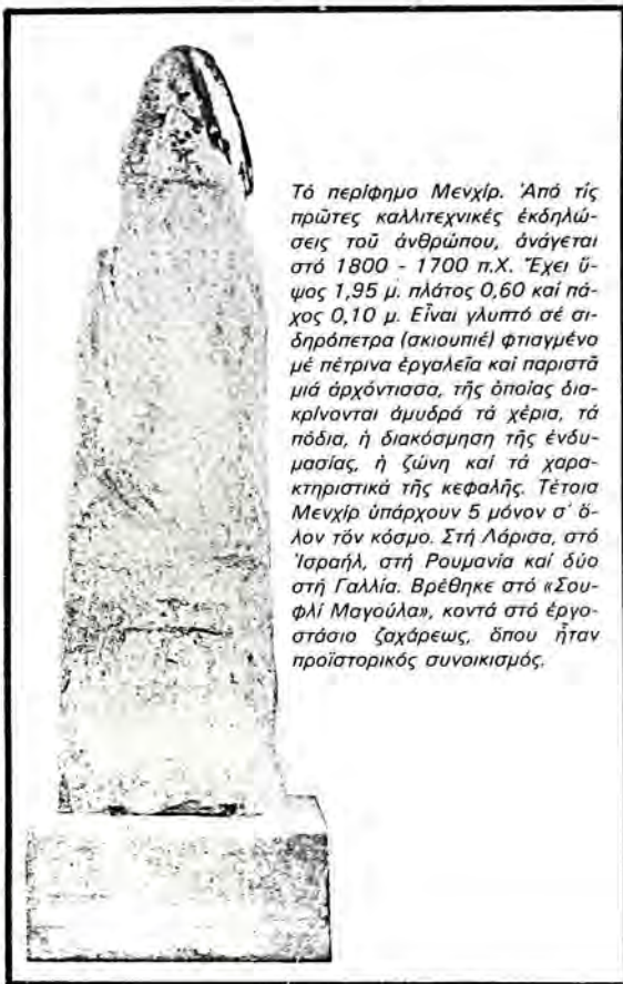
Τὸ περίφημο Μενχίρ. Ἀπὸ τίς πρῶτες καλλιτεχνικῆς ἐκδηλώσεις τοῦ ἀνθρώπου, ἀνάγεται στὸ 1800 - 1700 π.Χ. ἔχει ὕψος 1,95 μ. πλάτος 0,60 καί πάχος 0,10 μ. Εἶναι γλυπτὸ ἀέσι-δρόπετρα (σκιουπιέ) φτιαγμένο μέ πέτρινα ἐργαλεῖα καί παριστᾷ μιά ἀρχόντισσα, τῆς ὁποίας διακρίνονται ἀμυδρά τὰ χέρια, τὰ πόδια, ἡ διακόσμηση τῆς ἐνδυμασίας, ἡ ζώνη καί τὰ χαρακτηριστικὰ τῆς κεφαλῆς. Τέτοια Μενχίρ ὑπάρχουν 5 μόνον σ' ὅλον τὸν κόσμον. Στὴ Λάρισα, στὸ Ἰσραήλ, στὴ Ρουμανία καί δύο στὴ Γαλλία. Βρέθηκε στὸ «Σουφλί Μαγούλα», κοντὰ στὸ ἐργοστάσιο ζαχαρέως, ὅπου ἦταν προϊστορικός συνοικισμός.

Ὅλα τὰ ἄνω παραγγέλματα νά τηροῦνται δυνάμει τοῦ Ἁγίου Νόμου εἴτε διὰ τοὺς δίδοντας εἴτε διὰ τοὺς λαμβάνοντας.