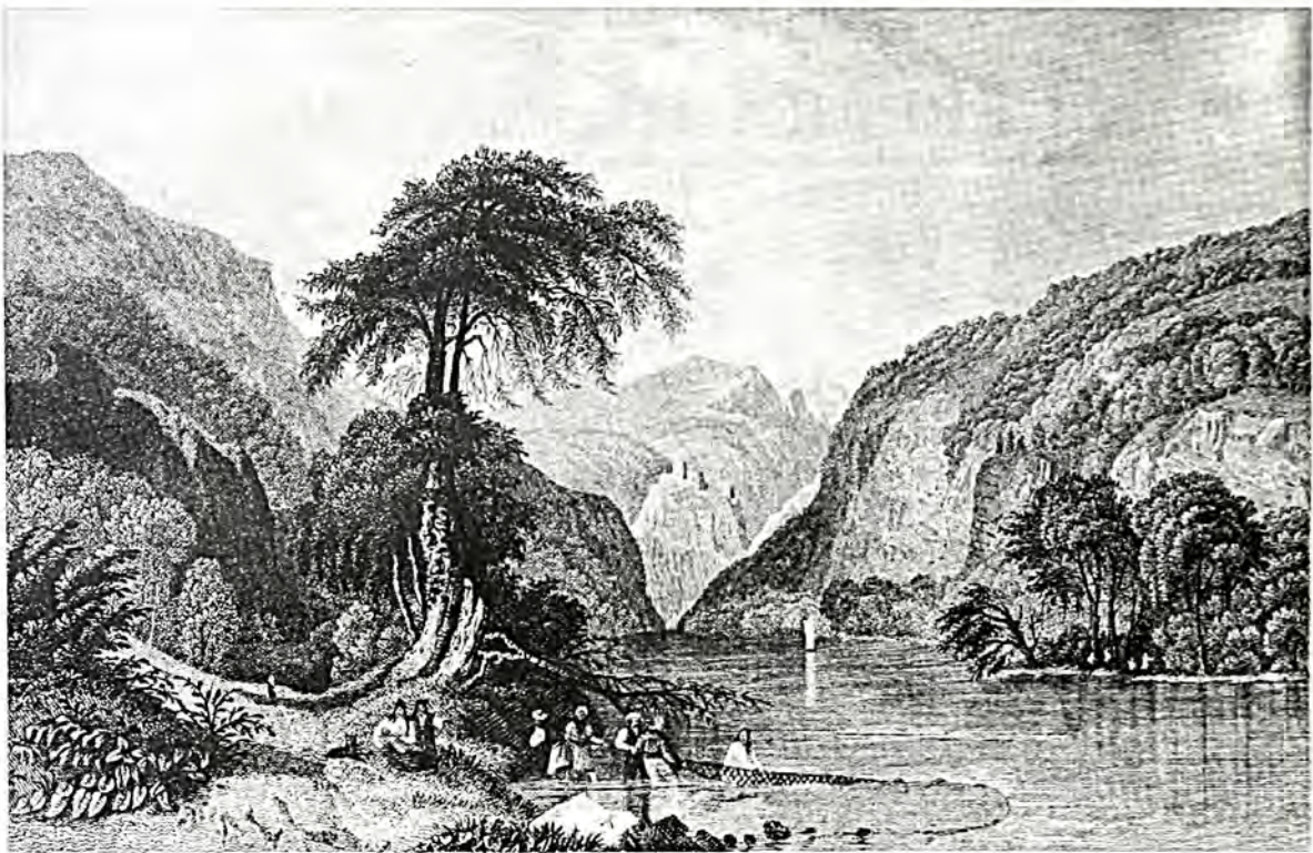
Τά Τέρπη. Γερμανική χαλκογραφία.

σματα καί κοσμήματα καί σέ πολύτιμους λίθους, γιά νά μπορούν ὁ καθένας ν' ἀρπάξει τὸ μικρό ἢ μεγάλο θησαυρό του, νά τὸν βάζει κάτω ἀπ' τή μασχάλη του σέ σακούλες καί, παρατώντας τὸ σπίτι του, νά σώσει, τρέχοντας, τὸ κεφάλι του καί τήν περιουσία του. Ἀκριβῶς τήν ἴδια τακτική τηροῦσαν καί οἱ Χριστιανοί, πού κατοικοῦσαν στὸν Τρανὸ Μαχαλά, γύρω ἀπὸ τήν ἀνατολική πλευρά τοῦ Φρουρίου καί ὄχι πολὺ μακριὰ ἀπὸ τὸν Πηνεῖο. Εἶχαν τίς ἴδιες πικρές ἐμπειρίες μὲ τοὺς Ἰσραηλίτες καί παρίσταναν τοὺς κακομοῖρηδες. Παρ' ὅλα αὐτά, ὅμως, δέν γλύτωναν ἀπὸ τίς ληστρικές ἐπιχειρήσεις τῶν κατακτητῶν. Γι' αὐτὸ ὄχι λίγες φορές βρέθηκε ἡ Λάρισα νά κατοικεῖται μόνο ἀπὸ Τούρκους.