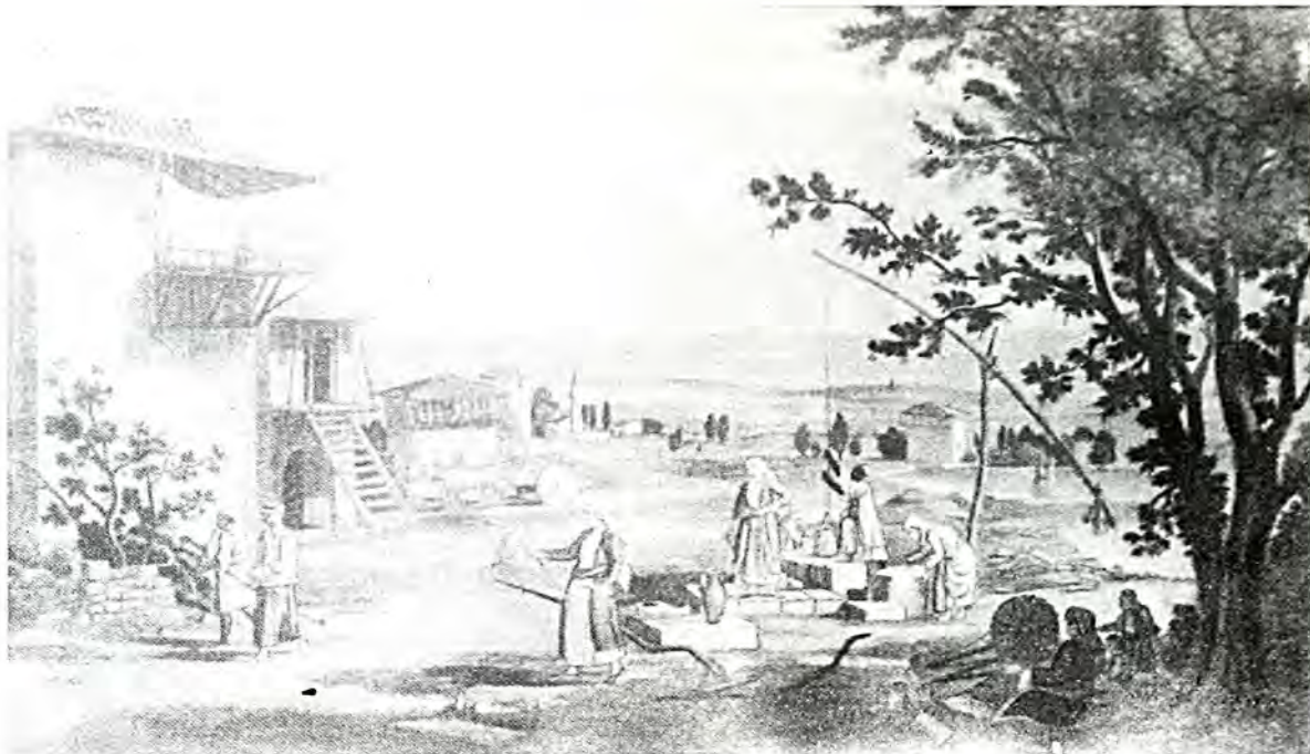
‘Η Λαρίσα τό 1815, τοῦ Dodwell. Ἀπό τήν Πινακοθήκη Δ. Κακλαμάνου.