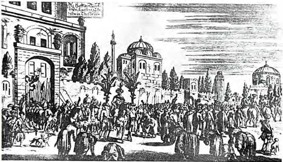
Πομπώδης έξοδος του Σουλτάνου εκ Λαρίσης, κατά τό έτος 1669.