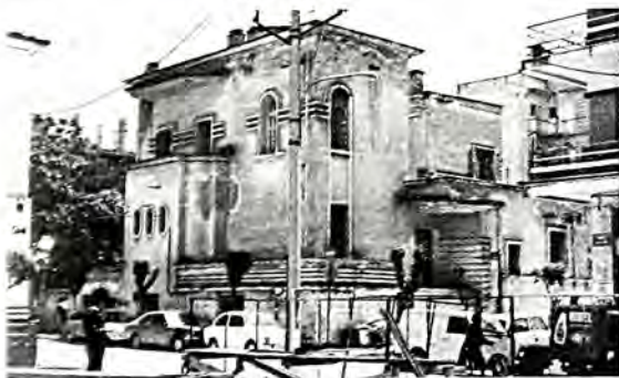
Λάρισα: Ἀρχοντικό. Σαλβατὼρ Ἀβραάμ. Σῴζεται μέχρι σήμερα.