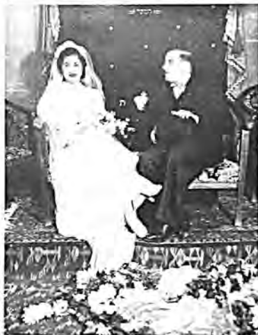
Ζεύγος Άλμοσνίνο, άπωλεσθείς στό 'Όλοκαύτωμα. Κάτοικος Θεσ/νίκης (όδός Σπάρτης άριθμ. 31. Συνοικία 'Αγίας Τριάδος).