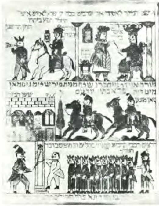
Κεντητό, όπου απεικονίζονται διάφορα έπεισόδια της ιστορίας του Πουρίμ.

« Εάν θέλετε να γνωρίσετε τό μέλλον, κοιτάzte και μελετήστε τό ιστορικό σας παρελθόν». Μέ βάση αυτών τόν κανόνα, που δέν αποτελεί παρά μία έλεύθερη παράφραση του έβραϊκού γνωμικού: « Μασσέ αβότ, σιμάν λεμπανίμ », θά ανατρέξουμε γιά λίγο στό παρελθόν και, μέ βάση αυτό, θά προσπαθήσουμε να έρμηνεύσουμε τό χρονικό του Πουρίμ. Τά συμπεράσματα και τά διδάγματα, στα όποια θά