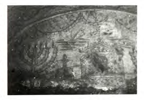
ΟΙ δύο πρόσφατα άνευρεθέντες τιτφοι, προφανῶς εὐπόρων οἰκογενειῶν. Ὁ διάκοσμος τῶν τάφων μέ σύμβολα ἀπό τό Ναό, ὑπογραμμίζει τό δικαίωμα τῶν Ἱαραηλιτῶν νά ἀκολουθοῦν ἐλεύθερα τή θρησκεία τους.