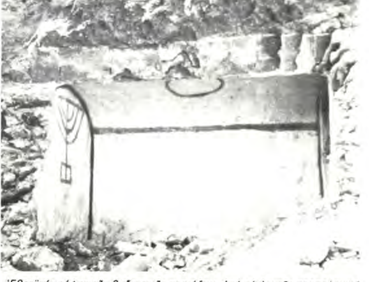
Έβραϊκός τάφος τῆς βυζαντινῆς περιόδου, ἀπό τό ἀρχαῖο προπολεμικό Ισραηλιτικό νεκροταφεῖο τῆς Θεσ/νίκης. 'Ανακαλύφθηκε κατά τίς οΙκοδομικές ἐργασίες στό χῶρο τοῦ Πανεπιστημίου Θεσ/νίκης. («Zikhron Saloniki», σελ. 4)

Ήρωτήθη ἄν, καμμία άπό αὐτάς εἶχε γίνει Χριστιανή.