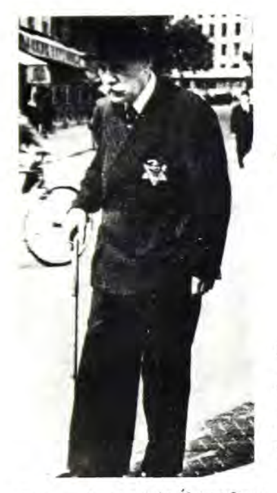
Τό κίτρινο ἄστρο τοῦ Δαυῗό Φοροῦσαν ὑποχρεωτικά οΙ Ἐβραῖοι τῆς Γαλλίας, ὅπως καί σέ ὅλη τήν κατεχόμενη Εὐρώπη.