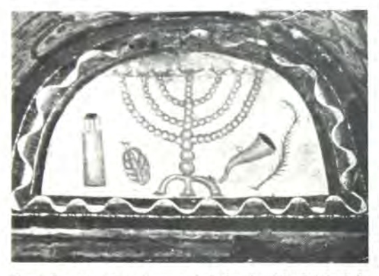
Έπιτύμβια πλάκα άπό τήν περιοχή τῆς Apulia: τά Ιουδαϊκά σύμβο λα τοῦ διάκοσμου εἶναι ἐνδεικτικά καΙ τονίζουν τόν πόθο γιά τή Σιών.