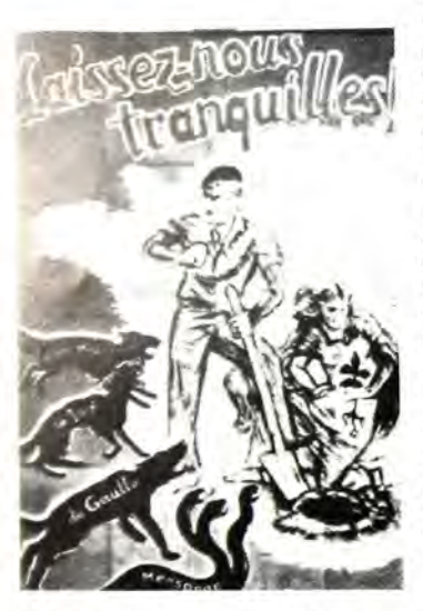
Μιά άπό τίς προπαγανδιστικές άφισες πού κυκλοφοροῦσε ἡ Κυβέρνηση τοῦ Βισύ. "Έγραφε: « Ἀφῆστε μας ἡσύχους. (Ἐχθροί τῆς νέας Γαλλίας εἶναι): ΟΙ Ἐβραῖοι, οἱ μασόνοι, ὁ Ντέ Γκώλ καί τά ψεὐδη τους».