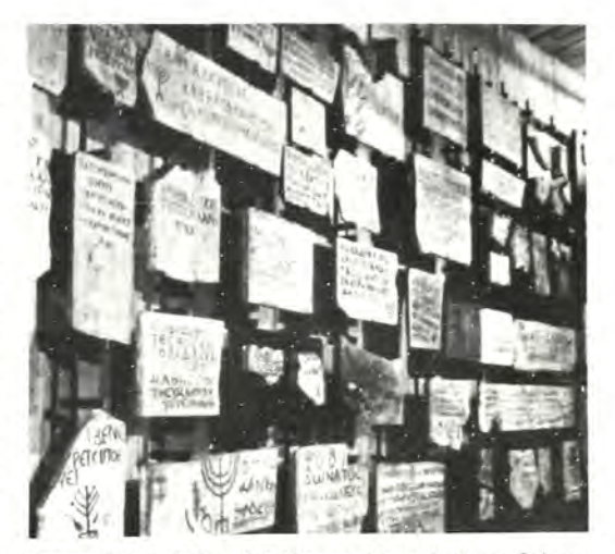
Μερικές άπό τίς 200 Ιουδαϊκές ἐπιγραφές, ποὺ σήμερα βρίσκονται ατό Μουσεῖο τοῦ Βατικανοῦ. Ὅλες στήν ἐλληνική γλώσσα.

'Η ἐπίσκεψη τῶν κατακομβῶν γιά τούς ἐπιστήμονες καί τό κοινό εἶναι δύσκολη, Ιδίως τά τελευταΐα πενήντα χρόνια. Τό Κον-