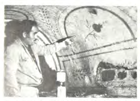
Το ποιχώματα τῶν κατακομβῶν, ἐπί τῶν ὁποίων ἀπεικονίζονται φυτά ἀπό τή χώρα τῆς Βίβλου.