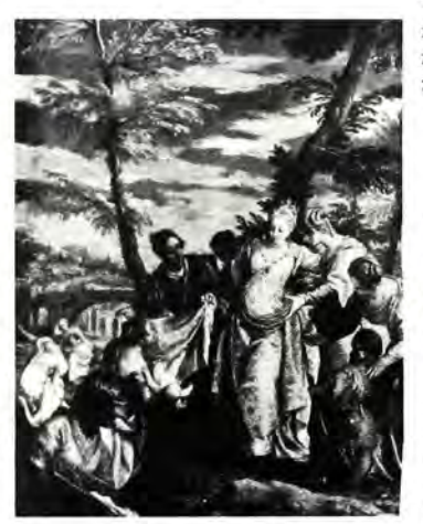
«Ή Άνεύρεση τοῦ Μωϋσῆ», ελαιογραφία τοῦ Paolo Veronese (Περ. 1570), στήν Ἐθνική Πινακοθήκη τῆς Οὐάσιγκτων.

Καί παρακάτω (σελ. 190 κ.ἐ.) διηγείται: «Όλη αὐτή ἡ ἀγρια γοητεία τῆς Σιναϊτικῆς ἐρήμου θά ἦταν βέβαια γνωστή στόν Μωϋσῆ πολύ πρίν ἀναλάβει τή μεγάλη του ἀποστολή νά ὀδηγήσει τό Ίσραήλ στή Γῆ τῆς Ἐπαγγελίας. Γιατί δέν πρέπει νά ξεχνᾶμε ὅτι νέος ἀκόμη καί κατατρεγμένος ἀπό τό βασιλιά τῆς Αίγúπτου «ἀνεχώρησεν ἀ Μωϋσῆς ἀπό προσώπου Φαραώ καί ὥκησε ἐν γῆ Μαδιάμ, ἐλθών δέ εἰς γῆν Μαδιάμ ἐκάθισεν ἐπί τοῦ Φρέατος...». Δίπλα στό πηγάδι αὐτό, ποὑ σήμερα βρίσκεται μέσα στόν περίβολο τῆς Μονῆς Σινὰ, συνάντησε