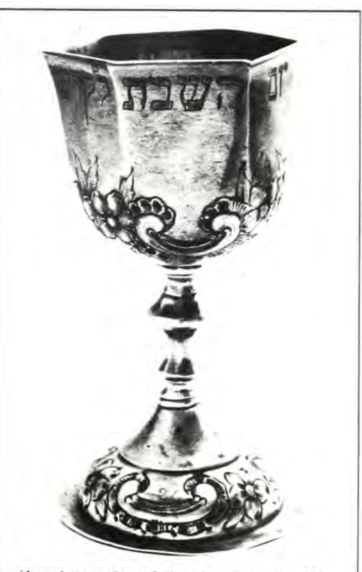
— Άσημένιο ποτήρι τοῦ Κιντούς - Γερμανία 1761.—

Ήδη ἀπό τήν ἐποχή τοῦ ἀλλέλ ὁ Θεσμός τῆς κατ οἶκον ἀπαγγελίας τοῦ Κιντούς ἔχει καθιερωθεῖ καί, ὅ-