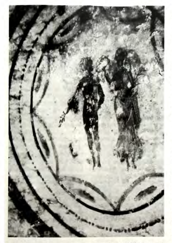
Ή θεά Τύχη, πού στεφανώνει ἕναν γυμνό νέο, εὖγλωττη μαρτυ ρία εἰδωλολατρικῆς ἐπιδράσεως.

Οἱ ὄμορφοι και καλοδιαρρυθμισμένοι κῆποι τῆς Villa Torlonia τῆς Ρώμης, ἄλλοτε κατοικία τοῦ Ἱταλοῦ δικτάτορα Μπενίτο Μουσσολίνι, ἀποτελοῦν ἕνα ἀγαπητό καταφύγιο γιά τούς σημερινούς Ρωμαίους, ἀπό τήν πολυάσχολη ζωή τῆς πόλεως. Πολύ λίγοι ἀπό τούς πολυπληθεῖς ἐπισκέπτες γνωρίζουν πώς μόλις μερικά μέτρα κάτω ἀπό τά πόδια τους βρίσκεται ἕνας ἀπό τούς μεγαλύτερους ἀρχαιολογικούς θησαυρούς τῆς πόλεως, μιὰ ἀπό τίς δύο ὑπάρχουσες ἰουδαϊκές κατακόμβες, πού ἀνοίχθηκαν μέσα στή γῆ ἐδῶ καί εἴκοσι αἰῶνες. Ἡ δεύτερη βρίσκεται στά νότια τῆς πόλεως, κατά μῆκος τῆς Αρρία Όδοῦ.