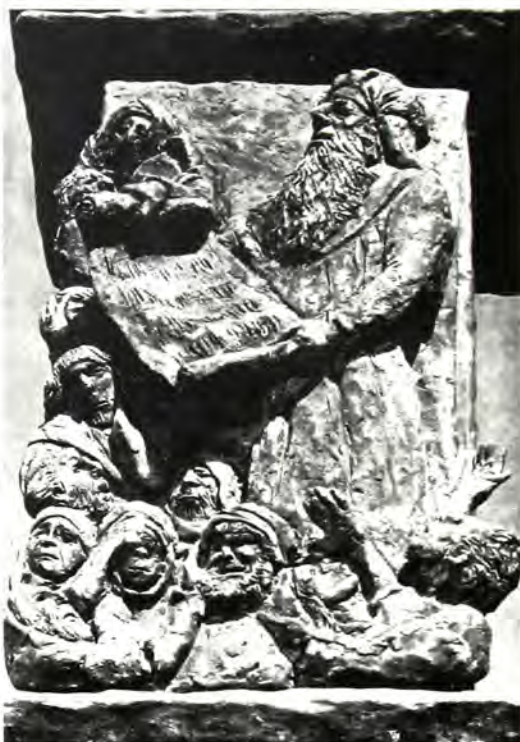
Ὁ Ἐζρά Ἀσφὲρ διδάσκει τὴν Τορά στὸ λαό. Ἀπὸ τὴ Μενορά ἔμπροσθεν τῆς Κνέσετ, Ἱερουσαλὴμ.

Στὴν ἐπόμενη γενιά ὁ Ἀκίβα ὑπῆρξε ὁ συγγραφέας μιᾶς συλλογῆς παραδοσιακῶν νόμων, ἀπὸ τὴν ὁποία, ἀργότερα, ἀναπτύχθηκε ἡ Μισνά. Αὐτὸς ὑπῆρξε ὁ μεγαλύτερος ραββίνος τῆς γενιᾶς του καὶ ὅλων τῶν μετέπειτα χρόνων, ἐκεῖνος τὸν ὁποῖο - ὅπως ἀναφέρει ὁ Θρόλος - ἀκόμη κι ὁ Μωυσῆς ἐξήλεψε, ὅταν σὲ ἓνα δράμα τὸ δόθηκε ἡ δυνα-