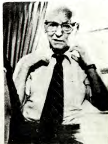
Ό Ίσαάκ Μπάσεβιτς Σίγκερ