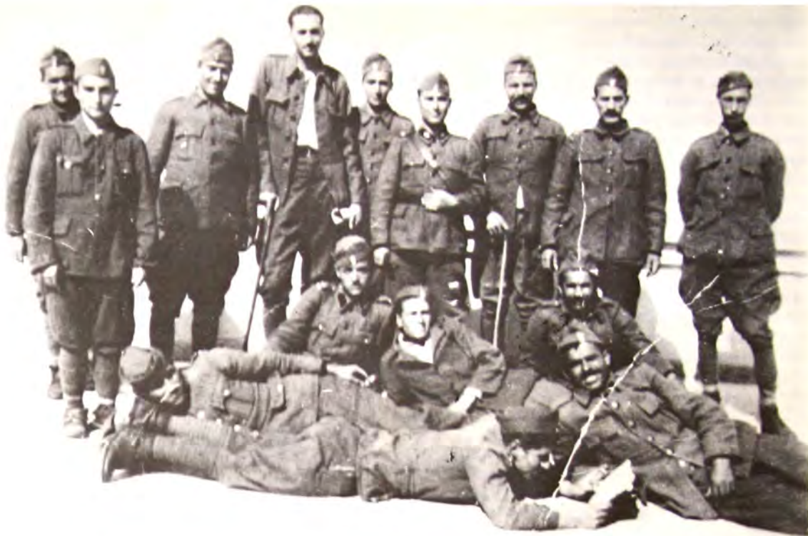
Μάρτιος 1940: Χριστιανοί και Έβραϊοι τραυματίες στο Μποσπάνειο Νοσοκομείο Μυτιλήνης.

ταῦτα ἐγράφησαν ὑπὸ τοῦ Τσερνιχόβσκυ ὡς ἱστορία ἢ ὡς ἀλληγορία.