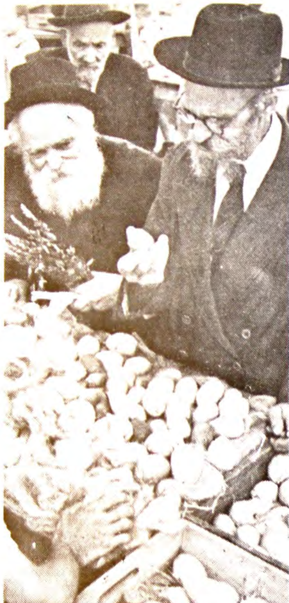
Χαρακτηριστικὴ εἰκόνα Ἰσραηλινῆς ἀγορᾶς, παραμονὴ τοῦ Σουκότ.

Ἀπὸ τὴν ἀρχαία ἤδη ἐποχὴ ἡ γιορτὴ τοῦ Σουκότ ἀναγνωρίστηκε σάν μιὰ γιορτὴ ἀφιερωμένη στὴν ἰδέα τῆς ἀδελφότητος τῶν ἀνθρώπων καὶ τῶν δεσμῶν πού ἐνώνουν τὸν Ἑβραϊκὸ λαὸ μὲ τὴν ὑπόλοιπη οἰκο-