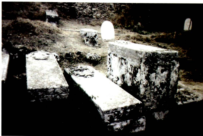
Εβραϊκό νεκροταφείο Ζακύνθου. Μνήματα Ραββίνων που χρονολογούνται από τον 15ο αι.