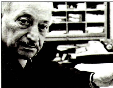
«Η Βία είναι σαν αγριόχορτο: δεν μαραίνεται ακόμη και στη μεγαλύτερη Ήπραςία», υποστήριζε πάντα ο Σιμόν Βιζενταλ κραδαινοντας φωτογραφίες ναζιστών εγκληματιών πολέμου στο μικρό γραφείο του στη Βιέννη.

Ήρθε στον κόσμο παραμονή Πρωτοχρονιάς του 1908 στο χωριό Μπούσατς, τότε τμήμα της Αυστροουγγρικής Αυτοκρατορίας. Γόνος ευκατάστατης οικογένειας εμπορέων, ουδέποτε φανταζόταν τη δραματική τροπή που θα έπαιρνε η ζωή του. Η απόρριψη από την πολυτεχνική σχολή του Λβιβ λόγω θρησκούματος τον ανάγκασε να χτυπήσει την πόρτα του Πολυτεχνείου της Πράγας, από όπου αποφοίτησε το 1932 ως αρχιτέκτων μηχανικός.