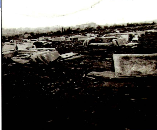
Το κατεστραμμένο εβραϊκό νεκροταφείο Θεσσαλονίκης. Φωτογραφία του 1944, αμέσως μετά την απελευθέρωση.

εις τον θάνατον αυτού. Τοῦτο αποδεικνύεται και εξ ολοκλήρου σειράς ανά χείρας μας των τότε εφημερίδων. Πλιν όμως δέον να παρατηρηθῇ ὅτι ουδέποτε ο Ελληνικός Λαός παρεσύρθη από τον τότε τύπον και ουδέποτε συνέβη επεισόδιον τι πεζοδρομίου εναντίον των Ισραηλιτών εκ μέρους της μάζας του Ελληνικού Λαού. Οὕτω κατ' Αύγουστον του 1941 ὅλως αιφνιδίως συλαμβάνονται εντός του καταστήματός των ένα πρωί πεντήκοντα (50) περίπου Ισραηλίται. Εγκλείονται εις τας φυλακάς Επταπυργίου όπου κρατούνται επί τρεῖς μήνας περίπου και ἐπειτα απολύονται χωρίς καν να τους δοθῇ καμμία ἐξήγησις οὔτε καν να τους ανακρίνουν. Κατά την περίοδον ταύτην εμφανίζονται συχνά εις τα γραφεία της Κοινότητος διάφοροι Γερμανοί οἰτινες διὰ του θορύβου των διὰ φωνῶν και απειλῶν κάμουν ἄνω κάτω ὅλας τας υπηρεσίας της Κοινότητος. Επί τέλους εκδηλώνουν και την αιτίαν της επισκέψεως. Θέλουν μίαν κατάστασιν των πλουσιῶν εβραίων. Ἄλλην ἡμέραν εμφανίζονται και ζητοῦν τα αρχεῖα ἢ την βιβλιοθήκην ἢ και την διεύθυνσιν του τᾶδε Ισραηλίτου δῆθεν αντιδραστικοῦ και πολλὰς ἄλλας τοιαύτας πληροφορίας. Ἐνα Γερμανικὸ φορτηγὸ σταθμεύει προ των θυρῶν της Κοινότητος και σε λίγη ὥρα εν μέσω φωνῶν, σπρωξιμάτων και ξυλοδαρμῶν φορτώνονται ἐπὶ του αυτοκινήτου ὅλα τα βιβλία, τα μητρώα, τα ἔγγραφα και λοιπὰ κοινοτικά αρχεῖα. Από της εποχῆς της ἀφίξεως των Γερμανῶν εις Θεσσαλονίκην ως Πρόεδρον της Κοινότητος εγκαθίστοιν οι Γερμανοί τον Σάρκο Σαλιέλ. Οὗτος υποβοηθεῖται υπό τινος Ισραηλίτου εκ Καστορίας γερμανομαθούς ονόματι Αλμπάλα.