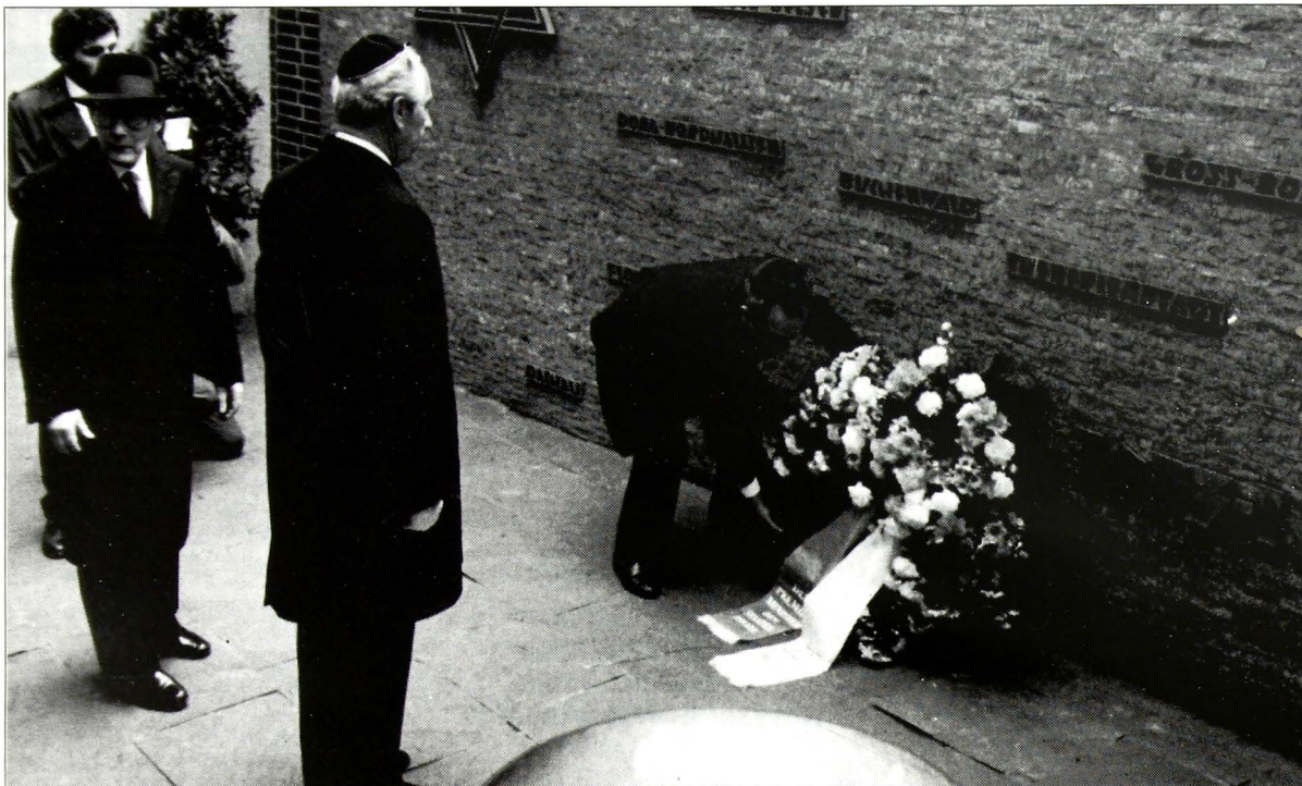
Από την κατάθεση στεφάνου στο Κέντρο της Εβραϊκής Κοινότητας του Δ.Βερολίνου, στις 29 Ιανουαρίου, 1986. Από αριστερά προς τα δεξιά: Helmut Kohl, πρόεδρος της Γερμανικής Δημοκρατίας, Shimon Peres πρωθυπουργός του κράτους του Ισραήλ και οι Yitzhak Ben-Ari, πρόεδρος του Ισραήλ στη Βόννη.