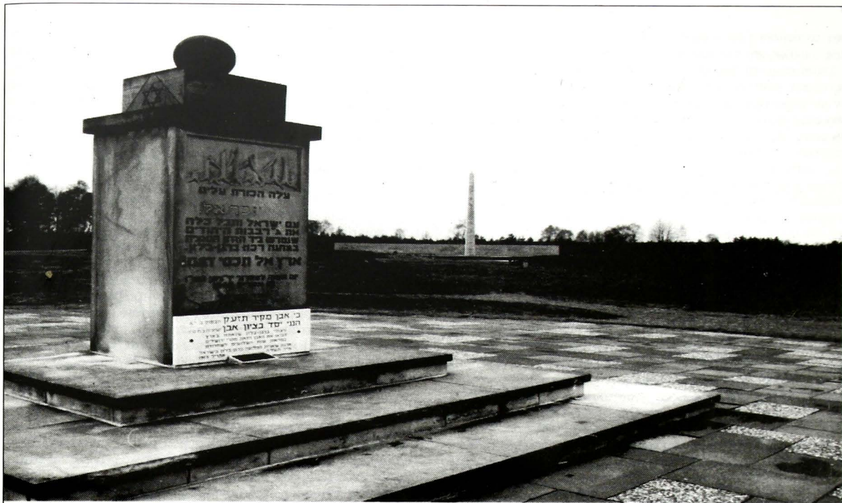
Μνημείο θυμάτων στο χώρο του στρατοπέδου συγκέντρωσης Bergen - Belsen.