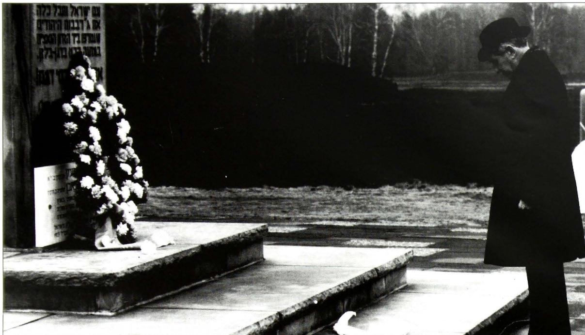
Ο κ. Χαΐμ Χέρτζοκ, Πρόεδρος του Κράτους του Ισραήλ κατά την κατάθεση στεφάνου στο μνημείο του στρατοπέδου συγκεντρώσεως Bergen - Belsen στα πλαίσια της επίσημης επίσκεψής του στην Ομοσπονδιακή Δημοκρατία της Γερμανίας τον Απρίλιο 1987.