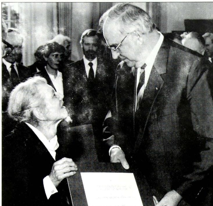
Η Δρ. Gertrud Luckner ενώ λαμβάνει το βραβείο Sir Sigmund Strenberg από το Καγκελάριο Κολ, στη Βόννη στις 16 Δεκεμβρίου 1987