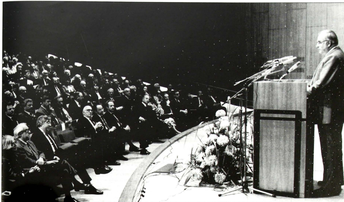
Από την ομιλία του Καγκελάριου κ. Χέλμουτ Κολ σε παγκόσμιο συνέδριο ιστορικών που έγινε με την αιγίδα του Ινστιτούτου Leo Baeck της Νέας Υόρκης, στην Κρατική Βιβλιοθήκη του Βερολίνου, στις 28 Οκτωβρίου 1985.