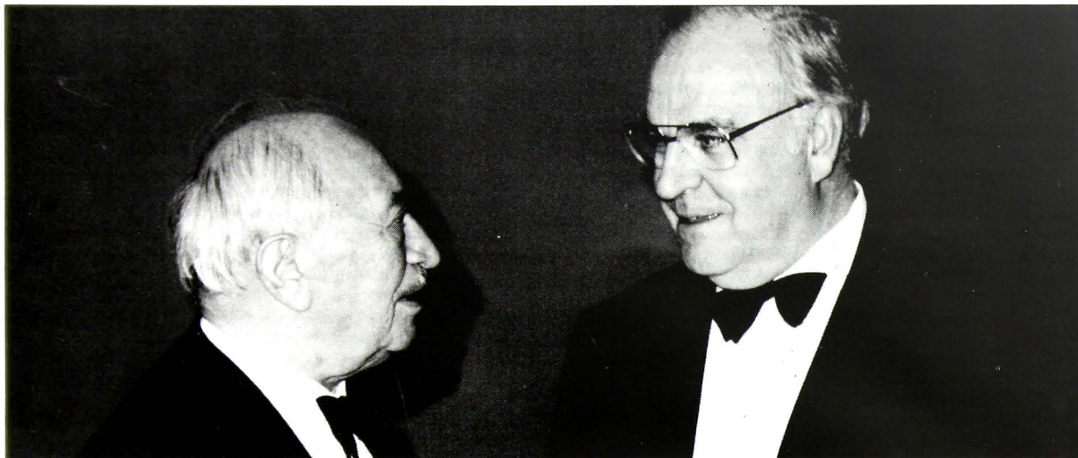
Ο Καγκελάριος Κολ συζητώντας με τον κ. Σίμον Βίξενταλ.