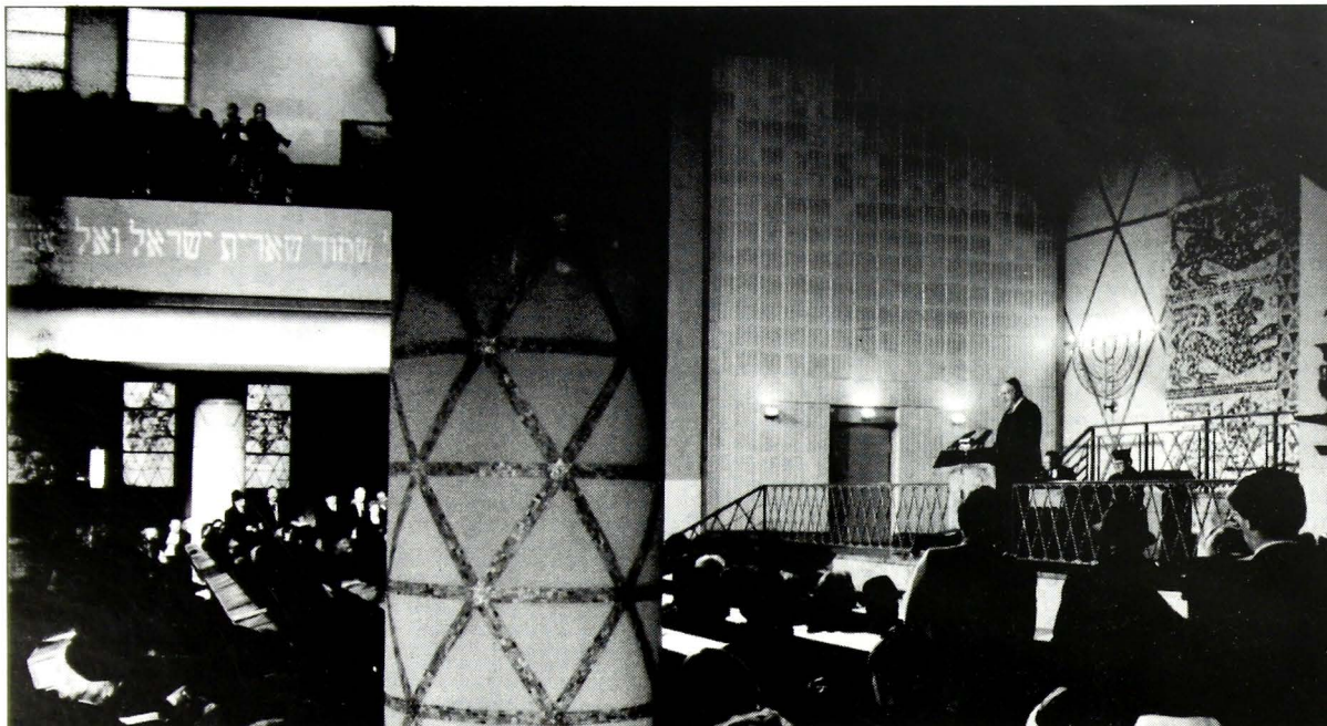
Ο κ. Χέλμουτ Κολ κατά την ομιλία στη Δυτική Συναγωγή της Φρανκφούρτης