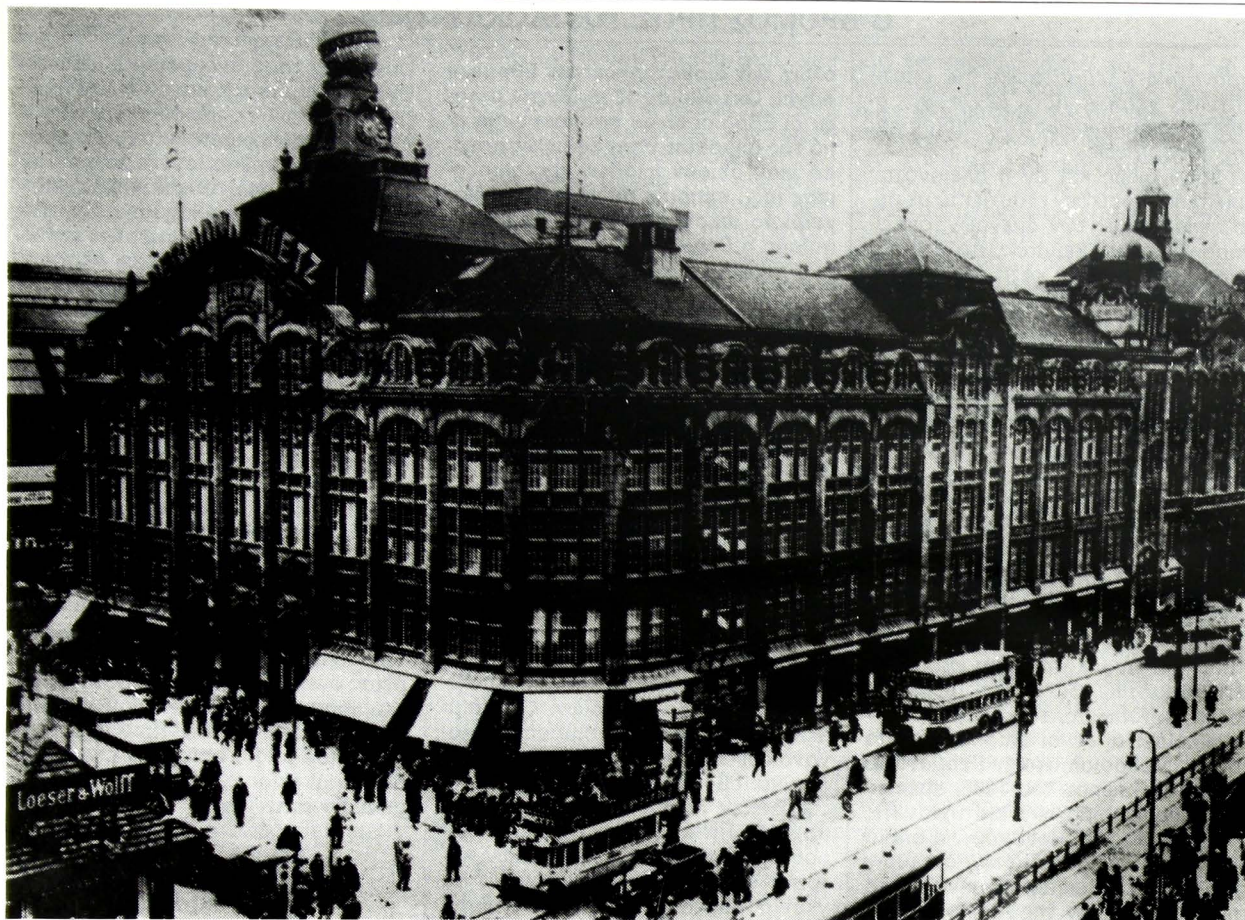
Το μεγαλοκατάστημα Tietz στο Βερολίνο: οι Ναζί το πήραν χωρίς να αποζημιώσουν τους ιδιοκτήτες.