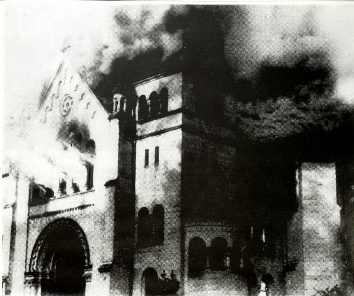
Η Συναγωγή του Baden - Baden στις φλόγες μετά τον εμπρησμό από τα S.S. Φωτογραφία της 10ης Νοεμβρίου 1938.