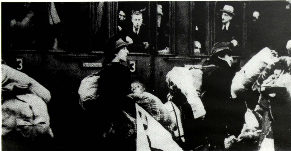
Αναχώρηση Εβραίων «στο δρόμο προς Ανατολάς».

Ένα άλλο σημείο που δείχνει τον σαδισμό των Γερμανών — ήταν το γεγονός ότι από το 1939 οι Εβραίοι δεν μπορούσαν να φάνε πια καθόλου κρέας . Ας σημειωθεί εδώ, ότι μετά από τις 12.30 που έληγε ο περιορισμός της αγοράς τροφίμων, λειτουργούσαν ορισμένα καταστήματα αλλά μόνο για Εβραίους, ώστε να πηγαίνουν εκεί μόνοι τους και να μην ενοχλούν τους άριους. Στα καταστήματα αυτά, οι Γερμανοί έστελναν αρκετά συχνά χοιρινό κρέας. Κι ενώ πολλοί άριοι έπρεπε να περιμένουν καιρό για να βρουν χοιρινό κρέας, στα Εβραϊκά μαγαζιά ήταν άφθονο, ακριβώς γιατί ήξεραν ότι οι Εβραίοι δεν μπορούν να το πάρουν. Αρκετοί Εβραίοι το αγόραζαν βέβαια και ύστερα στα κρυφά, με κίνδυνο της ζωής τους, το αντάλλαζαν με κάποιο άλλο είδος που τύχαινε να έχει κάποιος φίλος τους αν τους είχαν μείνει φίλοι ακόμα.