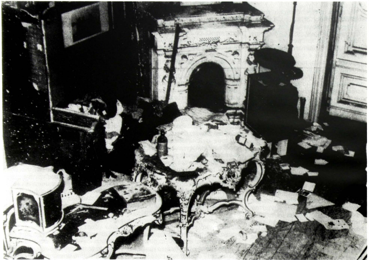
Κατοικία εβραϊκής οικογένειας μετά την επιδρομή.

λήψεις αυτά απέβλεπον εις τον εξαναγκασμόν προς αποδημίαν, αλλά όχι (ακόμη) εις την εξόντωσιν, δεν απετέλει το όλον. Καταστροφικωτέρα ήτο η εξουδετέρωσις της πολιτικής υπάρξεως, η απώλεια του μέχρι τούδε τρόπου ζωής και η εξαθλίωσις της συνειδήσεως των θυμάτων. Είναι περιγραφτός η προσβολή του ατόμου, την οποίαν συνεπήγετο η παράδοσις εις ένα στρατόπεδον συγκεντρώσεως, της οποίας ο φόβος υπεδούλωνε και ηπείλει την καθημερινήν ζωήν.