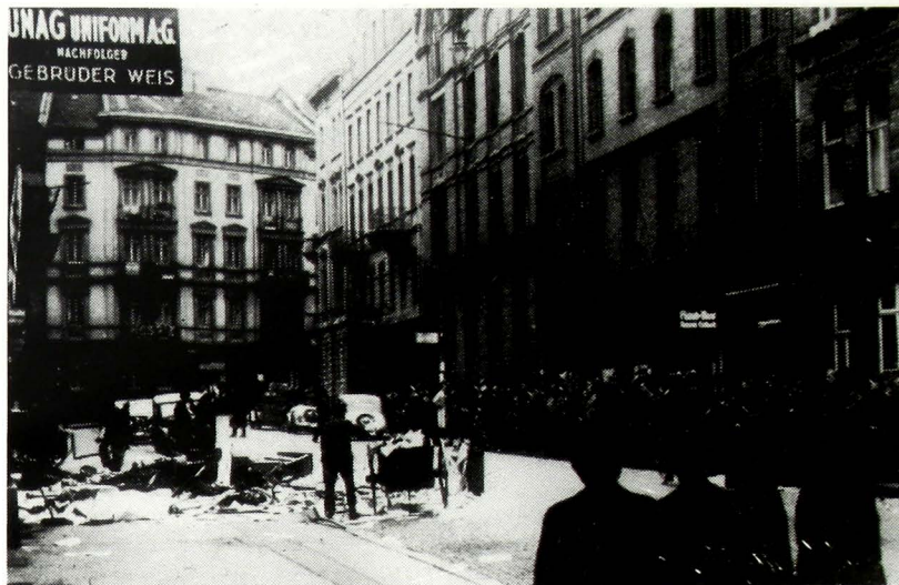
Το Εβραϊκό Κοινοτικό Κέντρο στο Kassel: το καθαρίζουν την επομένη της «Νύχτας των Κρυστάλλων». Φωτογραφία της 10ης Νοεμβρίου 1938

Ο αντισημιτισμός και η εχθρότης προς τους Εβραίους, ως εξεδηλώθησαν μετά την κατάληψιν της εξουσίας υπό των εθνικοσοσιαλιστών το 1933 δια μειωτικών νόμων, δι' εμπο-