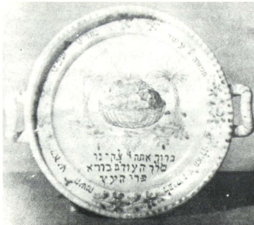
Κεραμικὸ πιάτο μέ τὰ διάφορα εἶδη φρούτων καί τὴν μπεραχά γιὰ τοὺς καρπούς τῶν δένδρων (Αὐστρία, 19ος αἰώνας).

Ἡ καθιέρωση αὐτῆς τῆς ἡμέρας σχετίζεται, φυσικά, μέ τίς εἰδικές κλιματολογικὲς συνθῆκες πού ἐπικρατοῦν στό 'Ερετς - 'Ισραῆλ, ὅπου μέχρι αὐτὴν τὴν ἡμερομηνία ἔχει πέσει τό μεγαλύτερο ποσοστὸ τῶν χειμερινῶν βροχῶν καί ἔκτοτε πλεόν ἀρχίζει ἡ περίοδος τῆς ἀνθίσεως καί τῆς ἀνα-