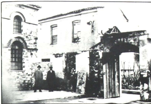
Ἡ νέα Συναγωγή πρό τῶν σεισμῶν. Διακρίνεται ὁ ἀιμνηστος πρόεδρος Δρ. Ἰωσήφ Κοέν.