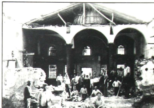
Ἀπό τό ἔργον ἀνεγέρσεως τῶν Συναγωγῶν μετά τήν ἀπελευθέρωσι.