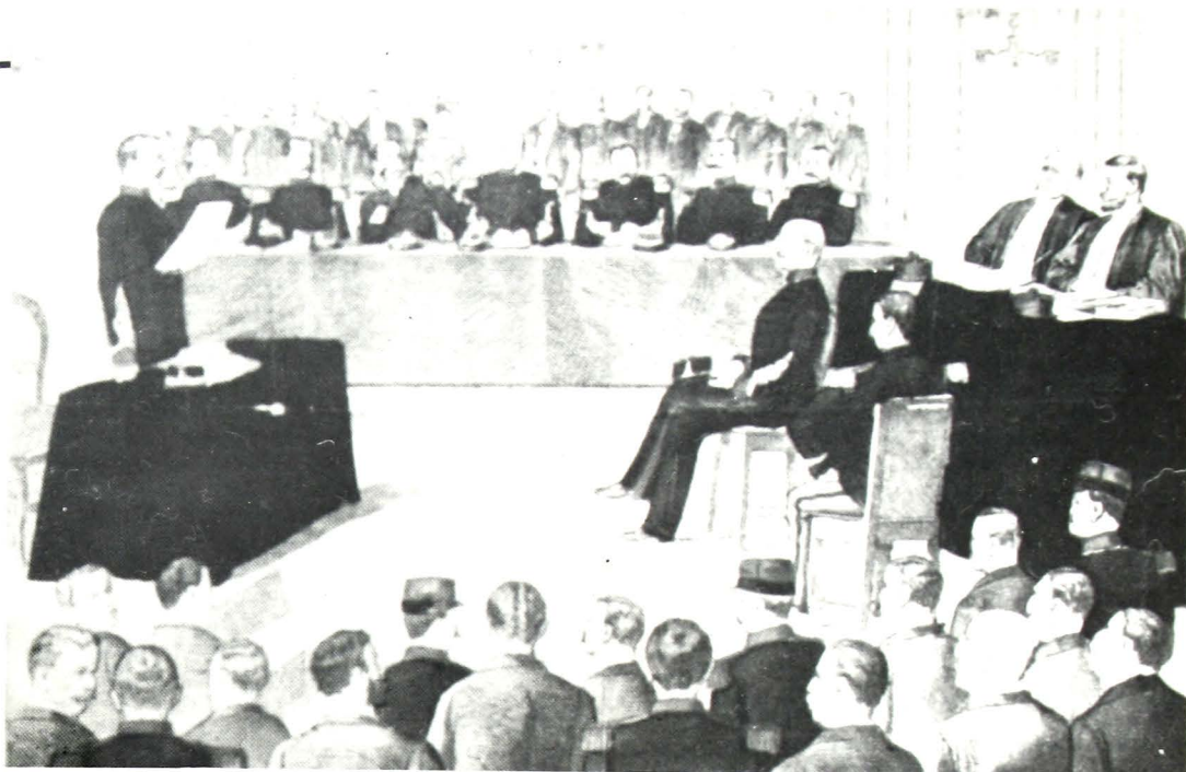
Λιθογραφία από τη δεύτερη δίκη του Ντρέυφους. Αγορεύει ο Εισαγγελέας, συνταγματάρχης Carrière. Πίσω του Ντρέυφους οι συνήγοροι του Edgar de Mange και Ferdinand Labori.

γαλλική στολή! Στ' όνομα του γαλλικού λαού σέ καθαιρούμε.