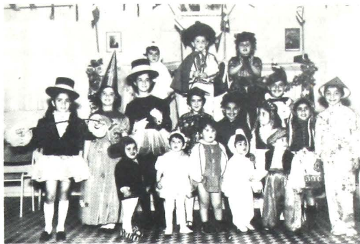
Πρίν από χρόνια, παιδική γιορτή Πουρίμ στη Λέσχη Βόλου.