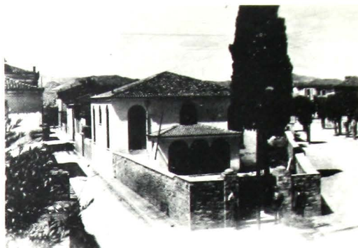
Η άνεγερθείσα, μετά τόν γερμανικόν διωγμόν, Συναγωγή Βόλου. Κατεστράφη υπό τών σεισμών τό 1953 - 55.