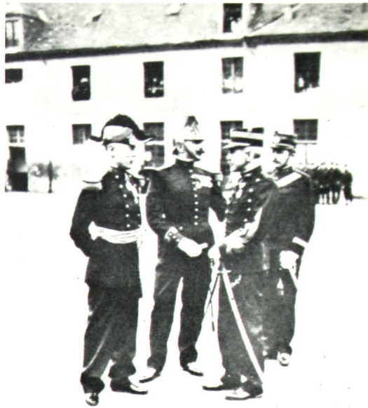
Μετά την άποκατάσταση του ό Ντρέύφους παρασημοφο- ρείται μέ τό σταυρό τής Λεγεώνας τής Τιμής 28, 'Ιούλιος, 1906.

«'Ο Ζολά πολέμησε ήρωικά υπερασπιζόμενος τό λογαγό Ντρέύφους. Τώρα πιά χρειάζεται ένας πρω- ταθλητής πού νά σταθεί στό στίβο γιά νά προστατέ- ψει τή Γαλλία».