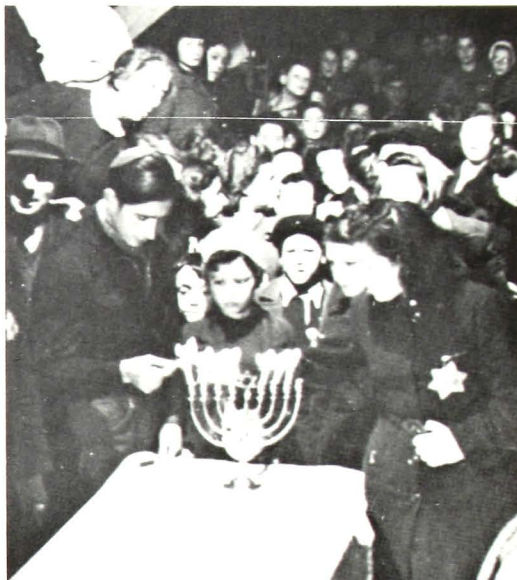
Οί έγκλώβιστοι του Westerborg, στρατοπέδου συγκεντρώσεως, γιορτάζουν τό Χανουκά (1942).

Δημοσιεύουμε την παρακάτω όμιλία του άειμνήστου διακεκριμένου λογίου - νομικού 'Ασέρ Ρ. Μωϋσή. 'Η δημοσίευση γίνεται γιατί τό θέμα τών Μακκαβαίων έχει κατ' ἐπανάληψη άπασχολήσει τούς ειδικούς τών θρησκευτών καί, έπίσης, γιατί βρισκόμαστε στήν περίοδο τής έορτής του «Χανουκά».