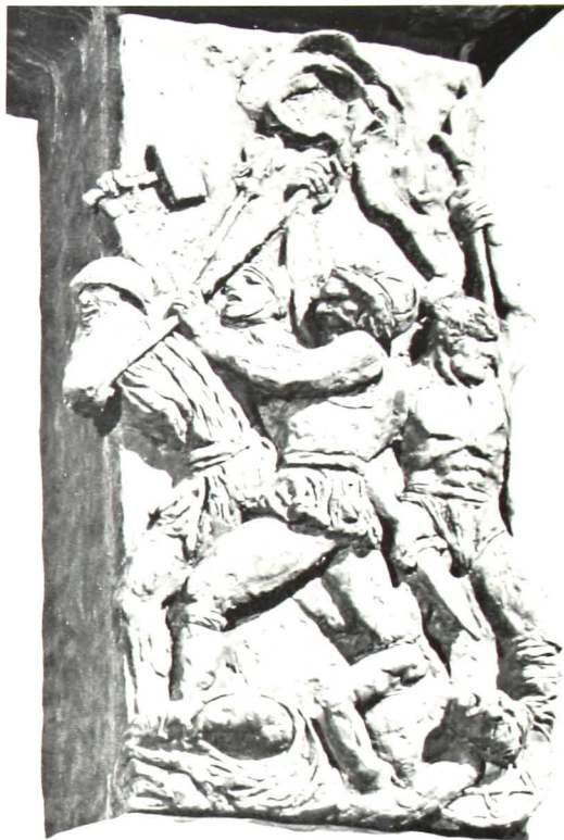
Οἱ Μακκαβαῖοι πολεμιστῆς, γλυπτὸ ἔργο τοῦ Benno Elkan.

Αὐτὰ εἶναι, ἐν συντομίᾳ τὰ ἱστορικὰ γεγονότα, τὰ συνδεόμενα μετὰ τὴν ἐορτὴν τοῦ Χανουκά, τὰ ὁποῖα κατ' ἐπιφάνειαν παρουσιάζουν τὸν ἰουδαϊσμόν ὡς μαχόμενον κατὰ τοῦ ἑλληνισμοῦ. Ἀλλὰ, ἥτο ὁ πόλεμος αὐτός, στὴν οὐσίαν του καὶ στὴν πραγματικότητα, πόλεμος ἑλληνοϊουδαϊκός; Ἐξεπροσώπει, στὴν διαμάχῃ αὐτῇ, ὁ Ἀντίοχος τὸ ἑλληνι-