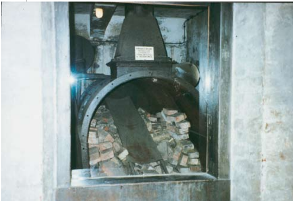
Κρεματόριο στο Άουσβιτς

προσοχή για να μην τους καταλάβει ο Κάπο, πήγαν κι εκείνοι με τη σειρά τους να δουν τι γινόταν. Ύστερα, με πρόσωπο κομμένο, χλωμό συνέχισαν να δουλεύουν.