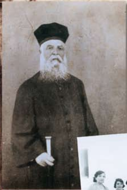
Α. ΕΜ. ΒΕΡΒΕΣ ΕΛΙΑΣ Great Rabbiner of Be'er

ΤΟΜΟΣ Α' • ΑΡ. ΦΥΛΛΟΥ 210 • ΙΟΥΛΙΟΣ - ΑΥΓΟΥΣΤΟΣ 2007 • ΤΑΜΟΥΖ-ΑΒ 5767