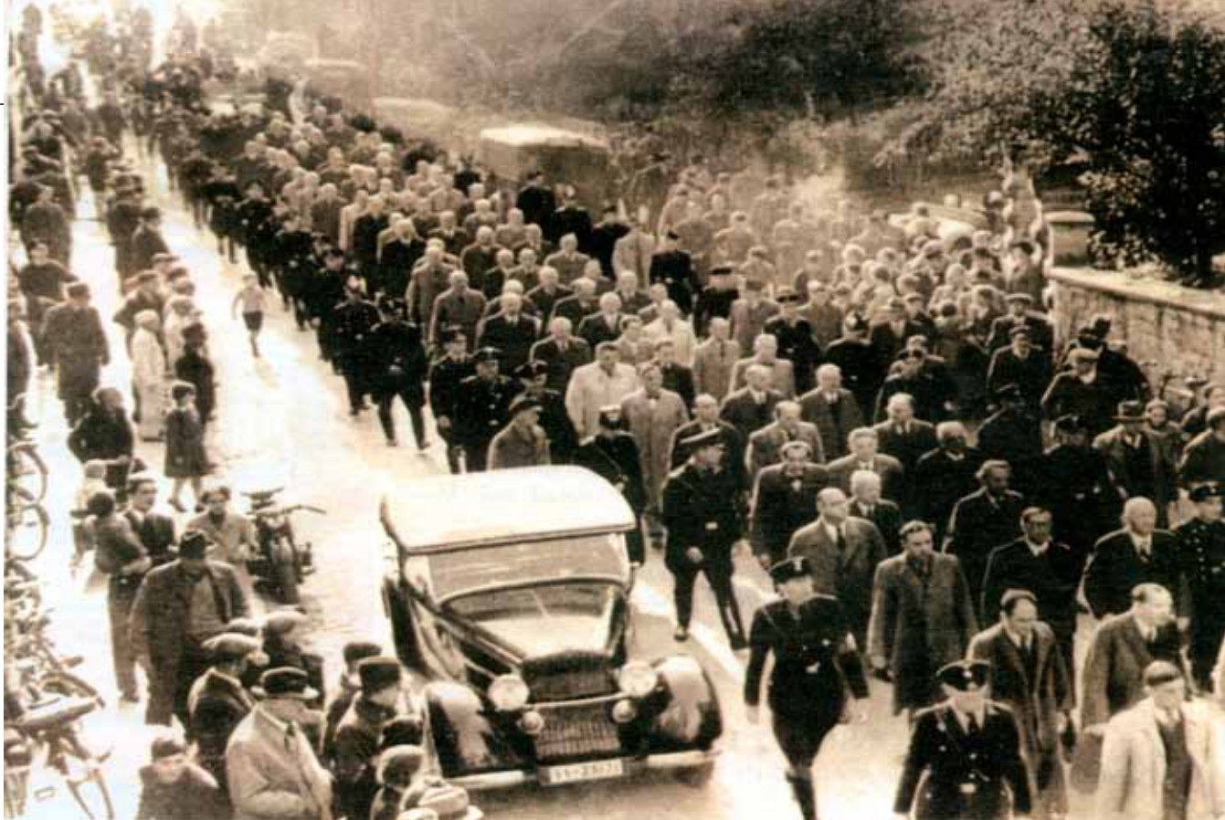
Μετά τη Νύχτα των Κρυστάλλων άνδρες των SS και της αστυνομίας συνοδεύουν τους Βερολινέζους Εβραίους για να μεταφερθούν στο στρατόπεδο συγκέντρωσης στο Σαχσενχάουζεν. 10 Νοεμβρίου 1938.