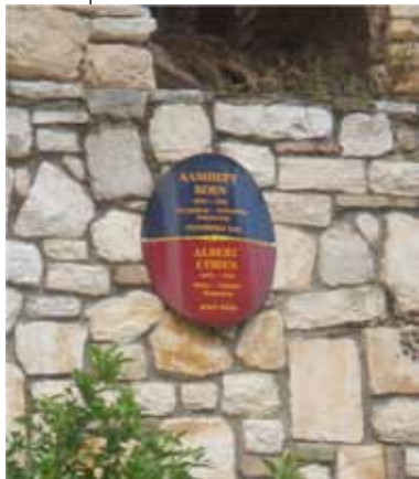
Αναμνηστική πλάκα στο σπίτι του Αλμπέρ Κοέν.