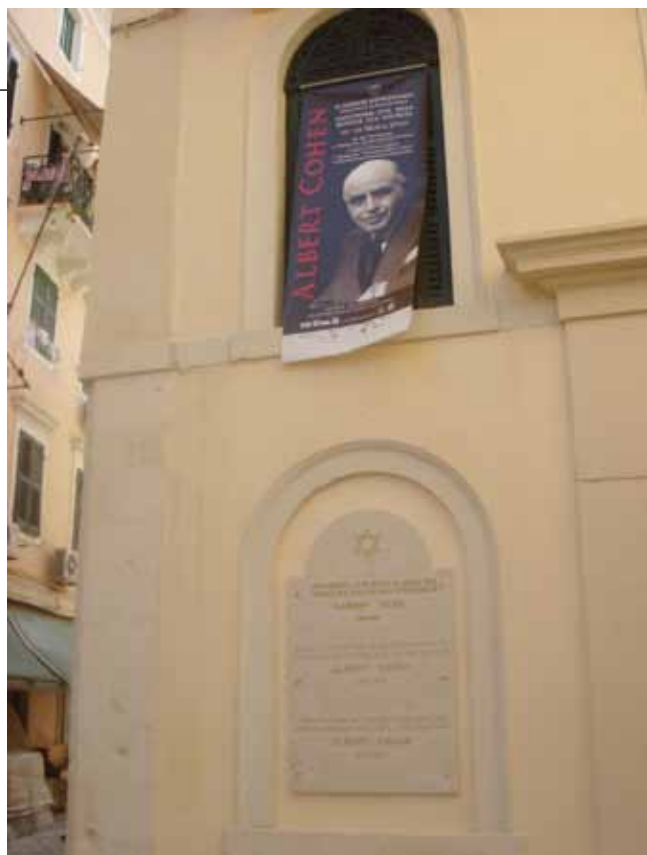
Η αφίσα των εκδηλώσεων στη Συναγωγή Κέρκυρας.

Το αφιέρωμα κορυφώθηκε με διήμερο Διεθνές Συ-