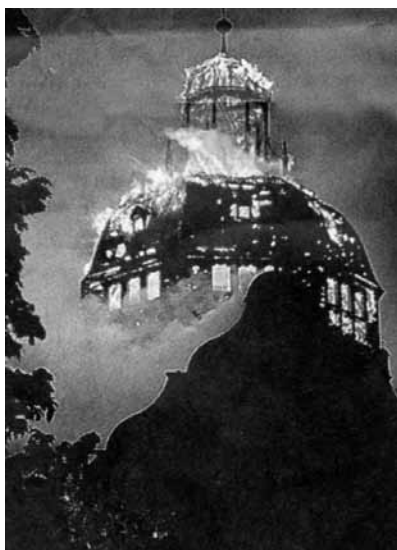
Πολλές συναγωγές καίγονταν όλη τη νύχτα μπροστά στα μάτια πυροσβεστών που είχαν διαταγές να παρέμβουν μόνο για να εμποδίσουν τη φωτιά να εξαπλωθεί στα διπλανά κτίρια.

τοι). Με όλα αυτά τα μέτρα δεν είναι απρόσμενο που υπήρξε μια σαφώς προδιαγεγραμμένη πορεία προς το δράμα της 9ης Νοεμβρίου του 1938. Το 1938 ήταν από τις σημαντικότερες χρονιές όσον αφορά στο εβραϊκό ζήτημα. Τον Απρίλιο του '38 περισσότερο από το 60% των εβραϊκών καταστημάτων είχαν αδειάσει ή «αριανοποιηθεί», δηλαδή είχαν περιέλθει σε Γερμανούς ιδιοκτήτες. Από τον Οκτώβριο τα διαβατήρια των Εβραίων έπρεπε να αναγράφουν υποχρεωτικά το γράμμα «J» (από το Juden, Εβραίοι). Ενα γεγονός στάθηκε η αφορμή για τα μαζικά