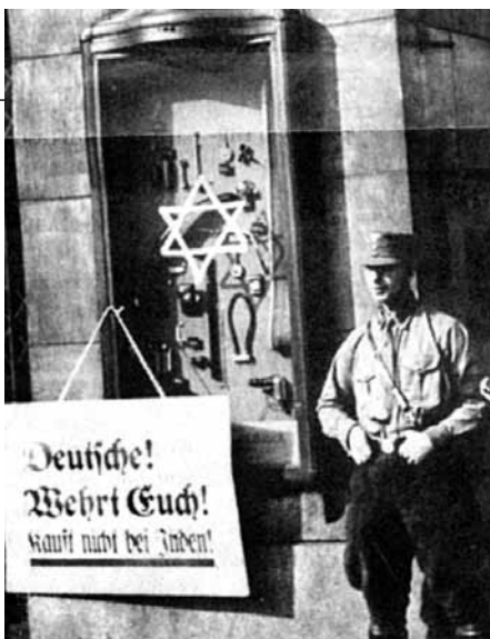
Βερολίνο, Πρωταπριλιά 1933. Οι ναζί εγκαινιάζουν το μποϊκοτάζ. Το πλακάτ γράφει: «Γερμανοί, προστατευτείτε, μην αγοράζετε από Εβραίους».

Η 9η Νοεμβρίου ήταν από κάθε άποψη θεμελιώδες γεγονός. Το ξέσπασμα του αντισημιτισμού για πρώτη φορά παίρνει τόσο μαζικές και ακραίες διαστάσεις. Ο Εβραίος ως «άλλος», ως εκπρόσωπος μιας ιστορικά καταπιεσμένης πολιτισμικής ετερότητας, βρίσκεται ξεκάθαρα πλέον στο στόχαστρο της ναζιστικής πολιτικής που επιθυμούσε ένα Ράιχ «judenrein», δηλαδή «καθαρό από Εβραίους». Η «Νύχτα των Πογκρόμ» αποτελεί την πρώτη μεθοδευμένη μαζική αντισημιτική πράξη και ήταν αποτέλεσμα της ενθάρρυνσης από το καθεστώς των βίαιων αντισημιτικών εκδηλώσεων που λάμβαναν χώρα στους δρόμους καθημερινά. Η βία των δρόμων είχε ξεκινήσει από την προσάρτηση της Αυστρίας στη Γερμανία στις 12 Μαρτίου 1938, και ακόμα πιο πίσω το καλοκαίρι του 1935, όταν είχε σημειωθεί πρωτοφανής έκρηξη αντισημιτικής βίας σε πολλές γερμανικές πόλεις. Μετά τη «Νύχτα των Πογκρόμ» ακολούθη-