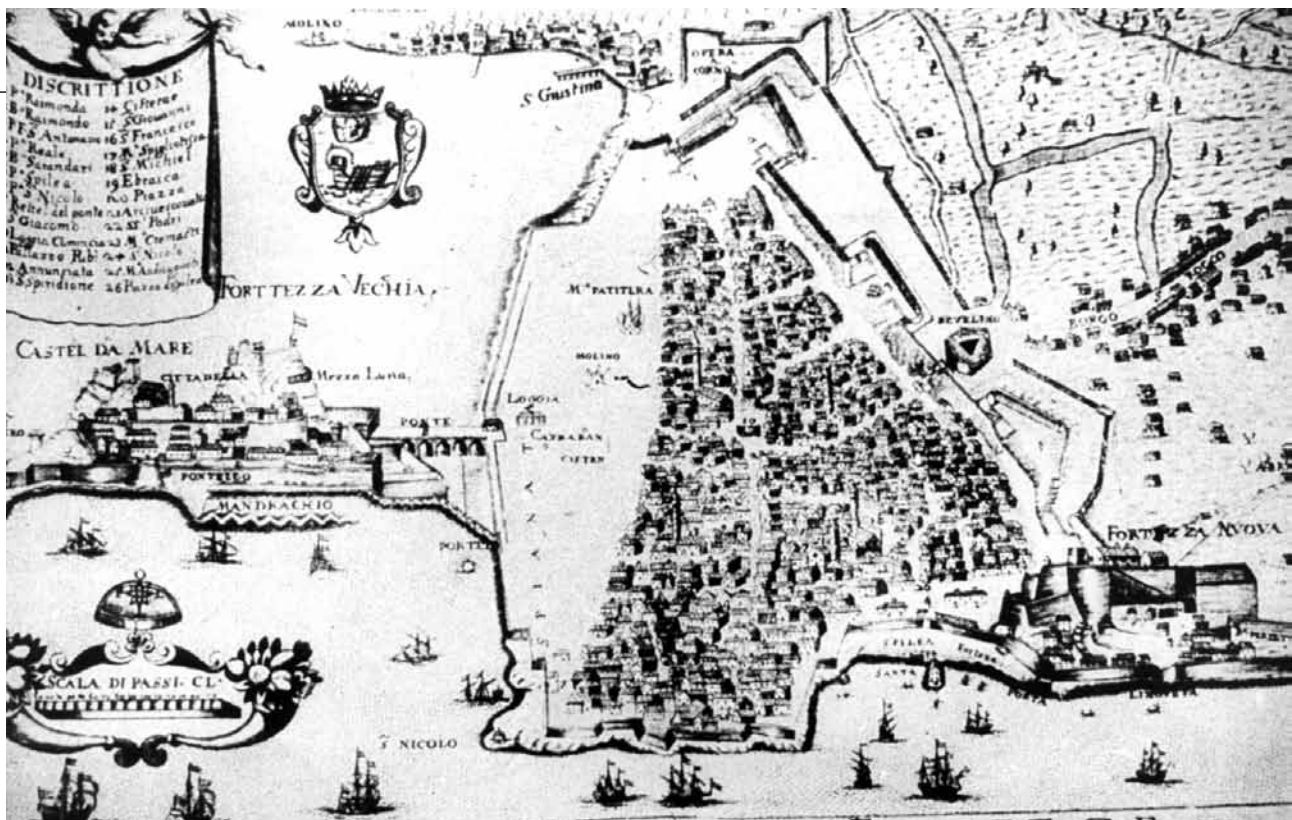
Ενετικός χάρτης της πόλης της Κέρκυρας, όπου παρουσιάζεται και η εβραϊκή συνοικία.

Πρόβλημα ως προς την εγκατάσταση των Εβραίων δημιουργήθηκε όταν, ύστερα από τις σοβαρές κατεδαφίσεις που έγιναν στις αρχές του 16 ου αιώνα εξαιτίας των οχυρώσεων, οι Εβραίοι σκόρπισαν παντού, κυρίως έξω από το Φρούριο. Από τότε η κερκυραϊκή Κοινότητα έκανε διαβήματα με αμείωτη επιμονή για τον περιορισμό των Εβραίων.