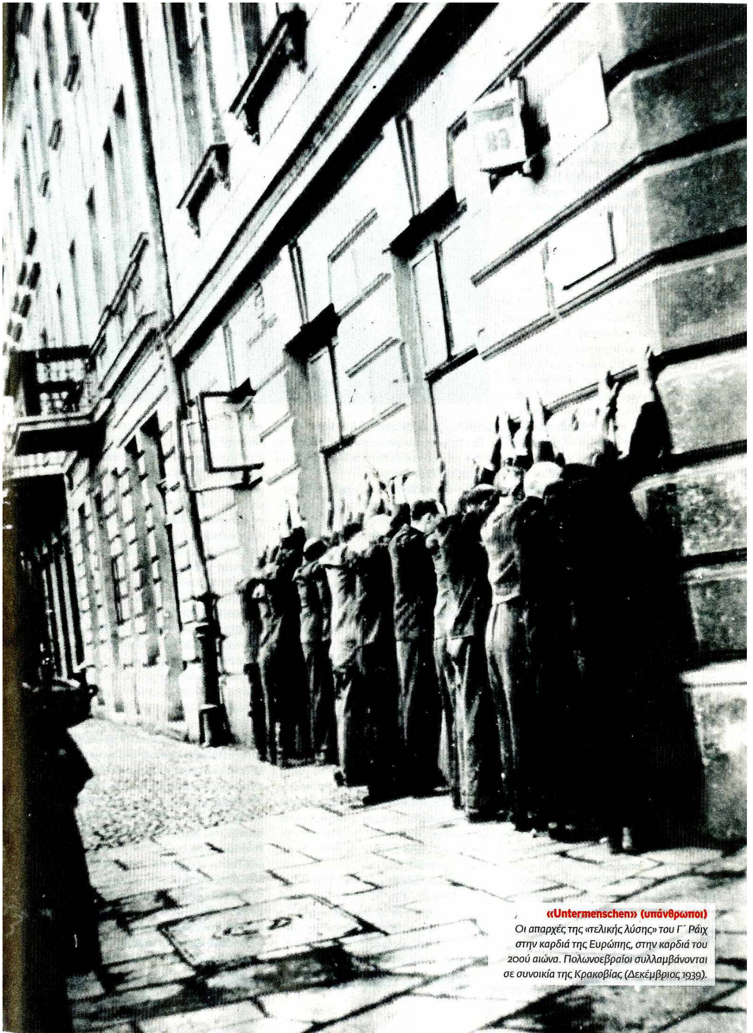
«Untermenschen» (υπάνθρωποι) Οι απαρχές της «εθελικής λύσης» του Γ' Ράιχ στην καρδιά της Ευρώπης, στην καρδιά του 20ού αιώνα. Πολωνοεβραίοι συλλαμβάνονται σε συνοικία της Κρακοβίας (Δεκέμβριος 1939).